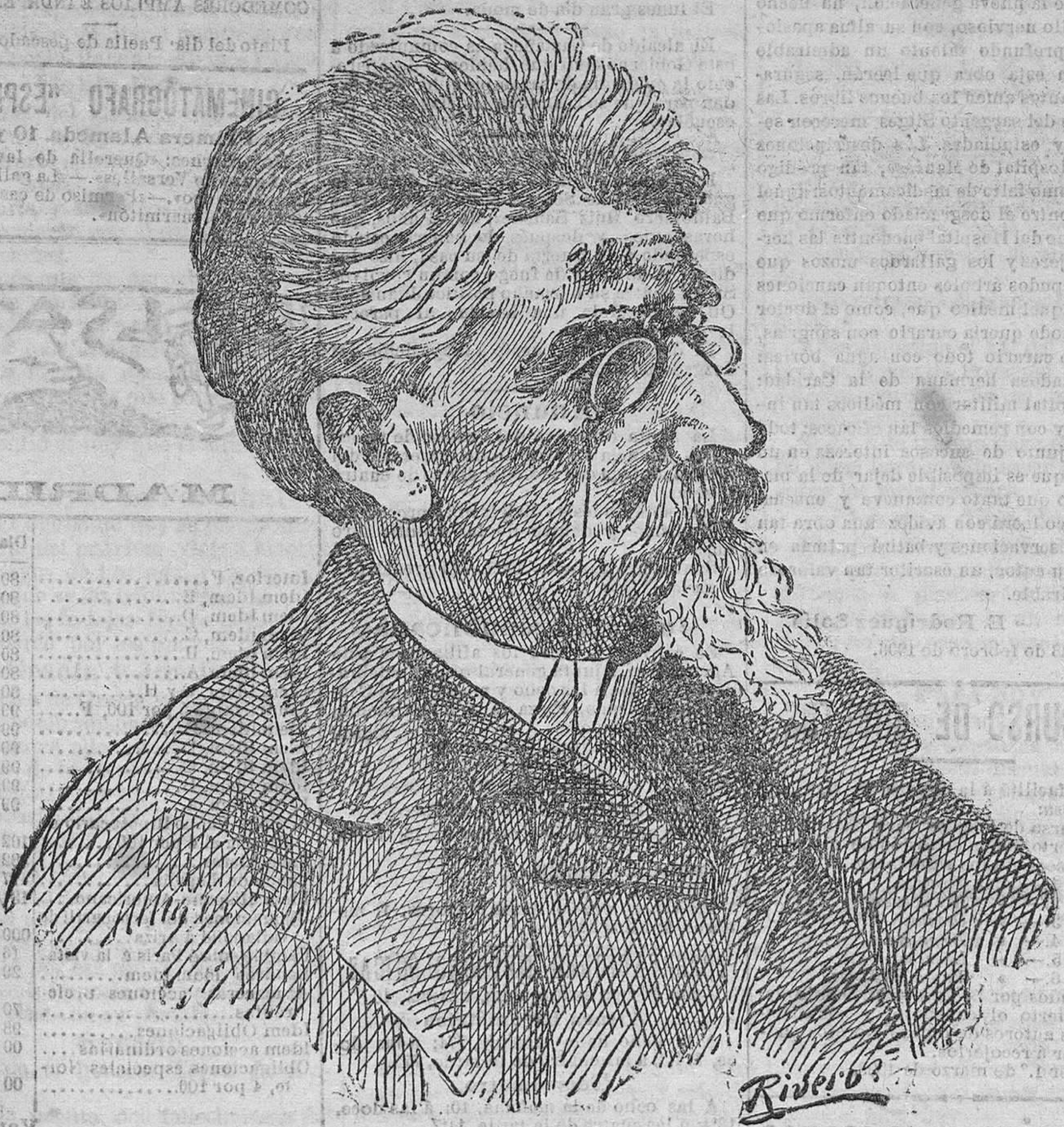
DON JOSÉ MARIA DE PEREDA