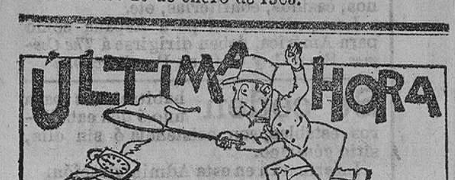
(Conferencia telegráfica de la madrugada)