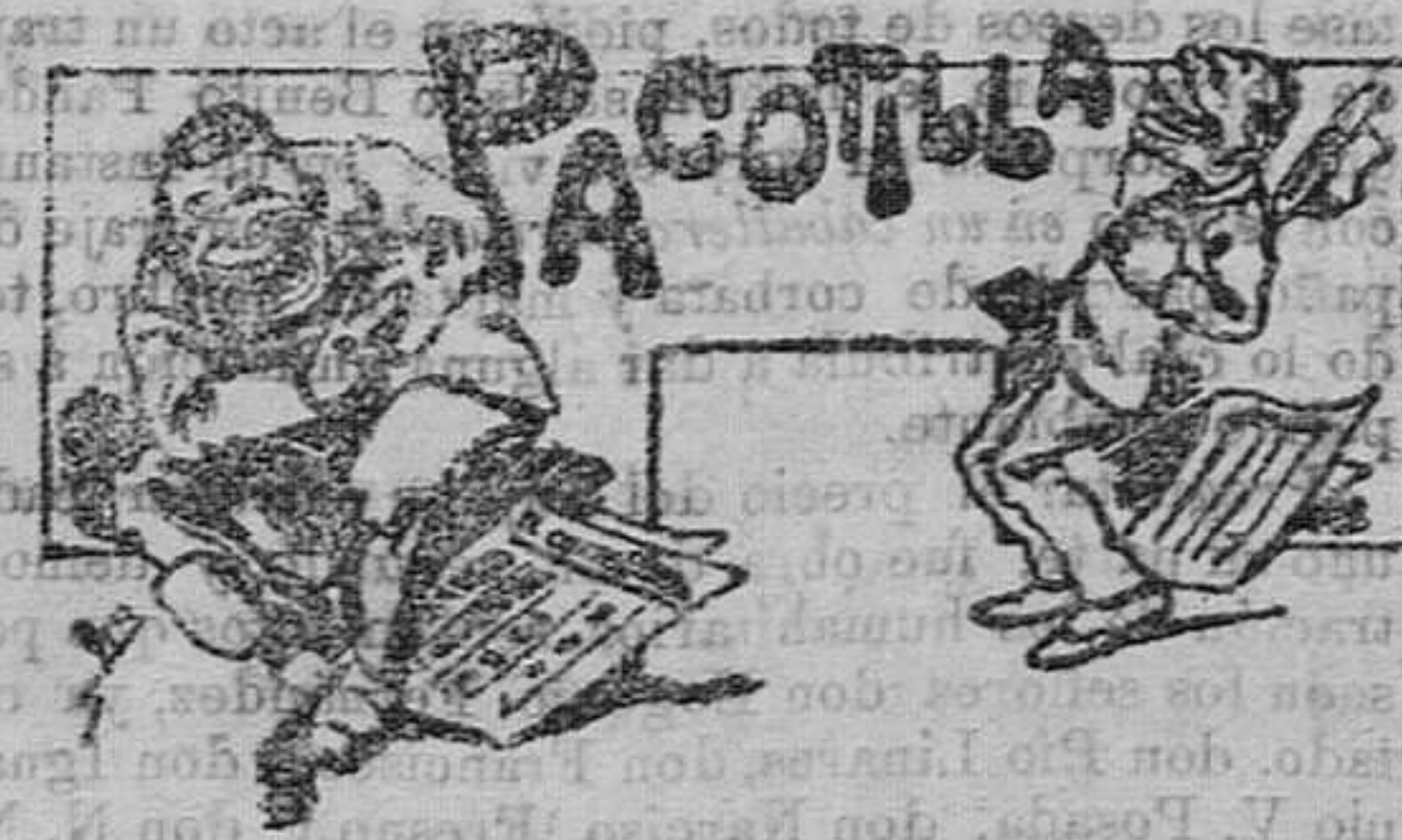
La poetisa de Renedo

Contra los moros. Ha salido el Sultán de Marruecos con el ministro de Estado aquéllos y con el de Hacienda el ilustrísimo señor Cervera.