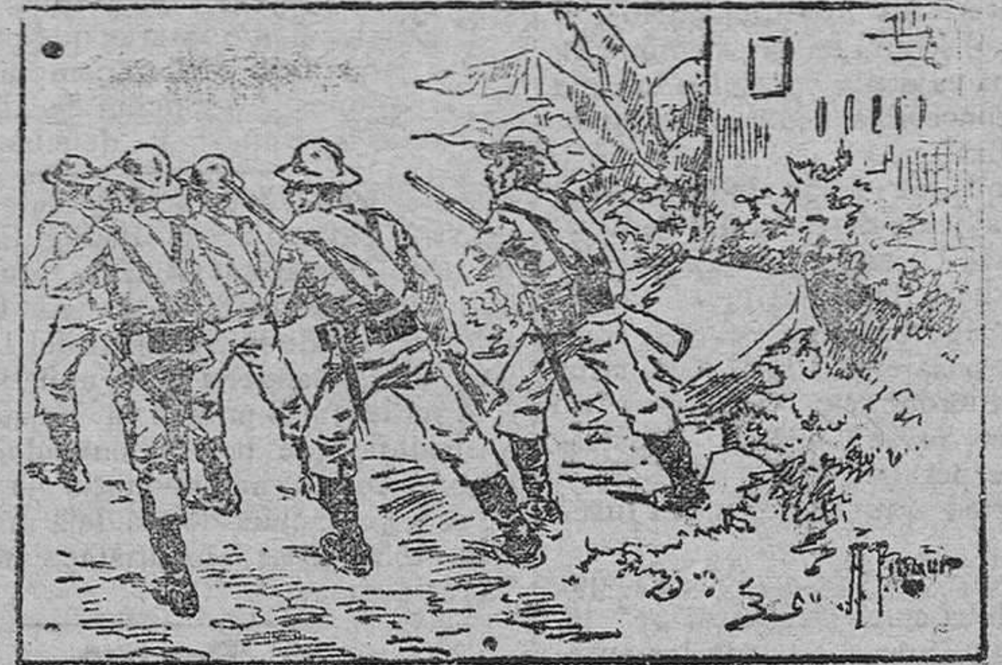
Accidente en el fortín "El Vigía"

Al saberse que, traidoramente, el cabo Vidal había entregado este fortín á los insurrectos, corrieron nuestras tropas al lugar del suceso, llegando oportunamente; pues en aquel momento el cabecilla Roloff, al frente de 30 individuos, se disponía á incendiarlo. El fortín quedó en poder de nuestro ejército y la partida de Roloff vencida y disuelta.