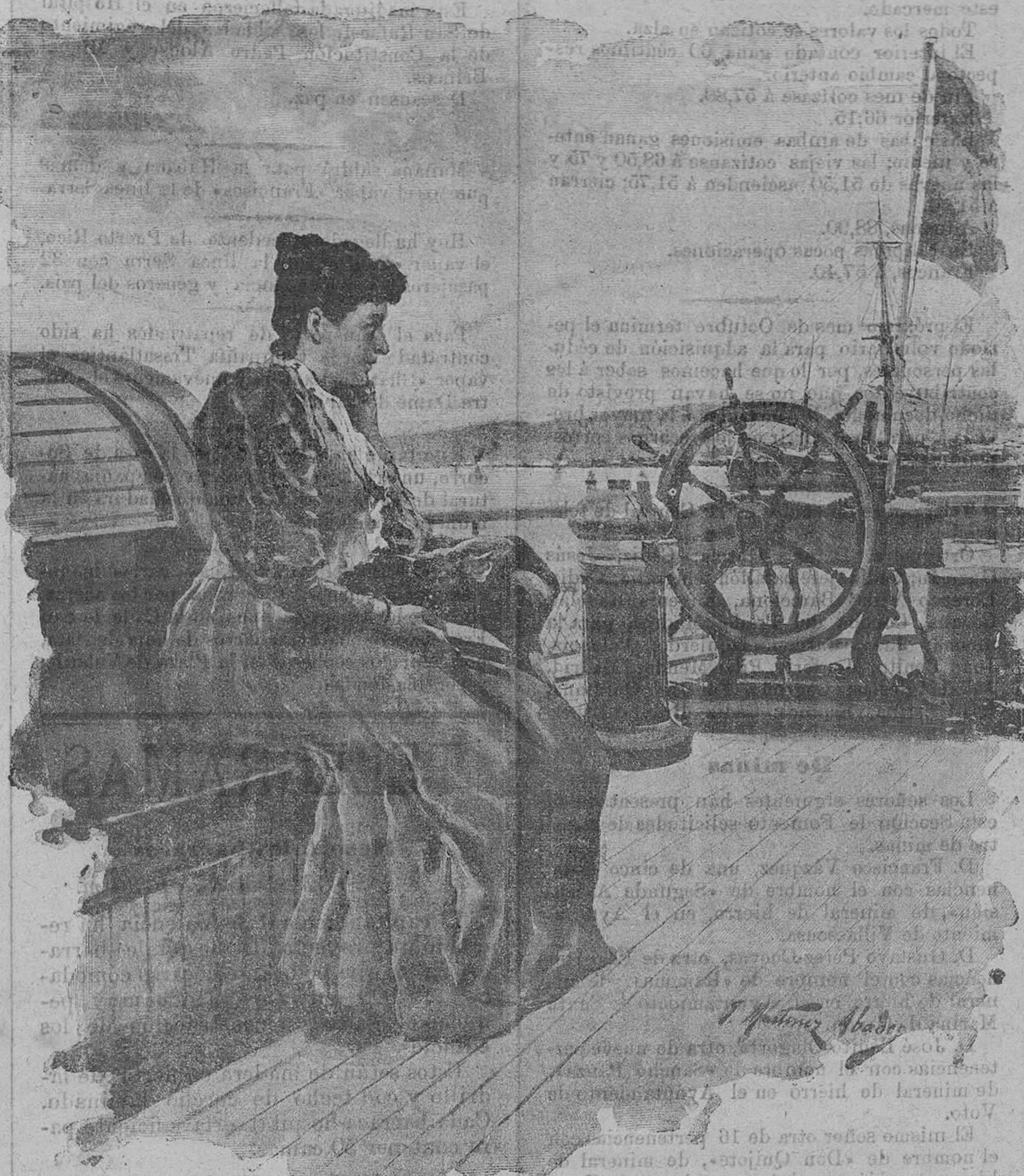
REPATRIADA.—Dibujo de Martínez Abades.

Porque si por este camino creemos llegar á un fin beneficioso para la patria, el