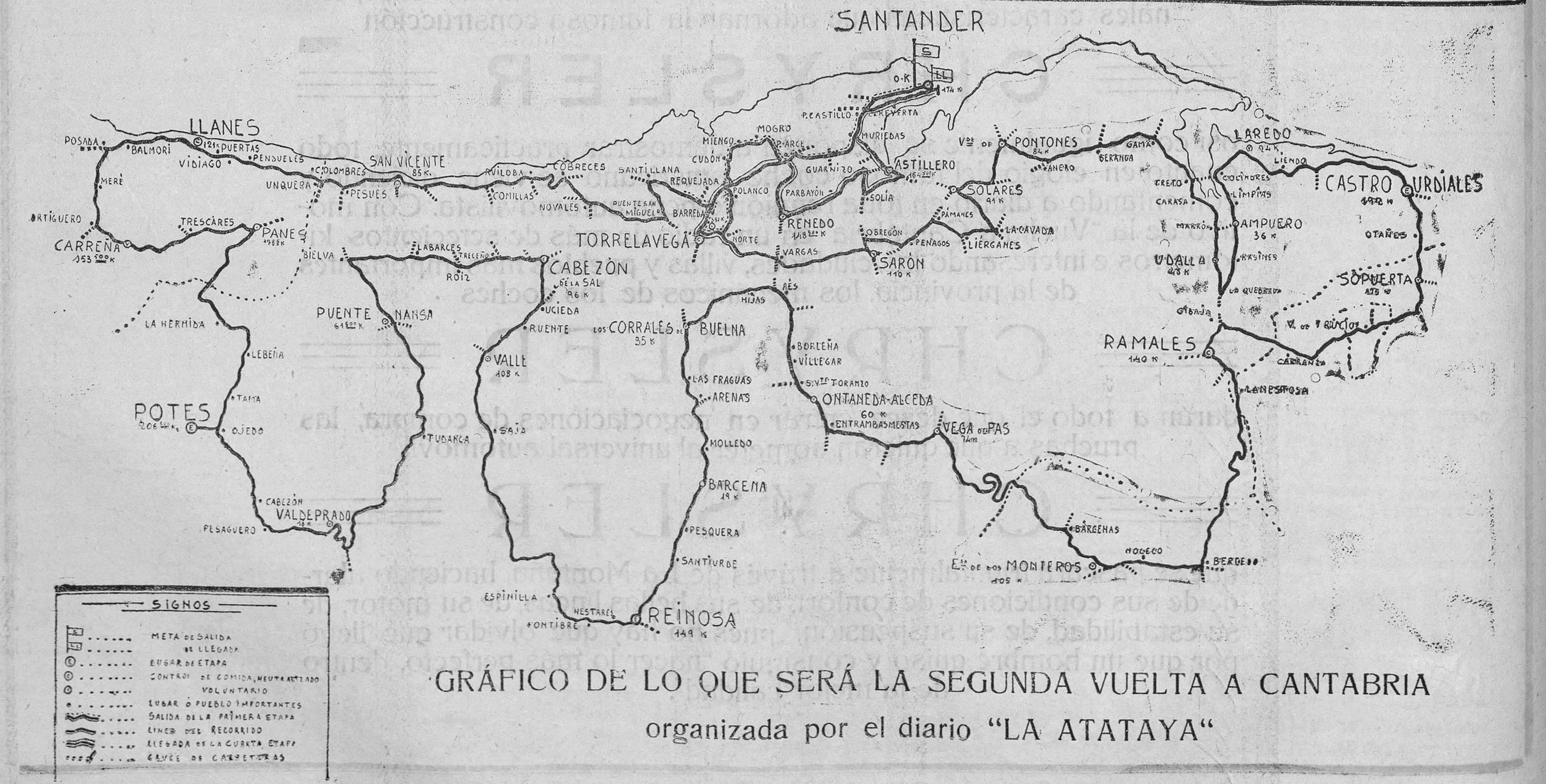
GRÁFICO DE LO QUE SERÁ LA SEGUNDA VUELTA A CANTABRIA organizada por el diario "LA ATALAYA"