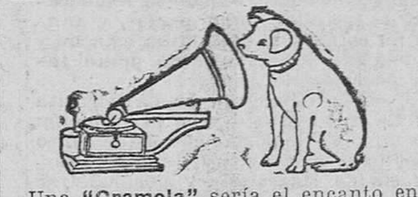
Una "Gramola" sería el encanto en su casa. Con muy poco dinero usted lo consigue.

Royalty Gran café restaurant - Hotel DE JULIAN GUTIERREZ Calificación. Cuarto de baño. Ascensor. Especialidad en bodas, banquetes, etc. Plato del día: Callos a la española.