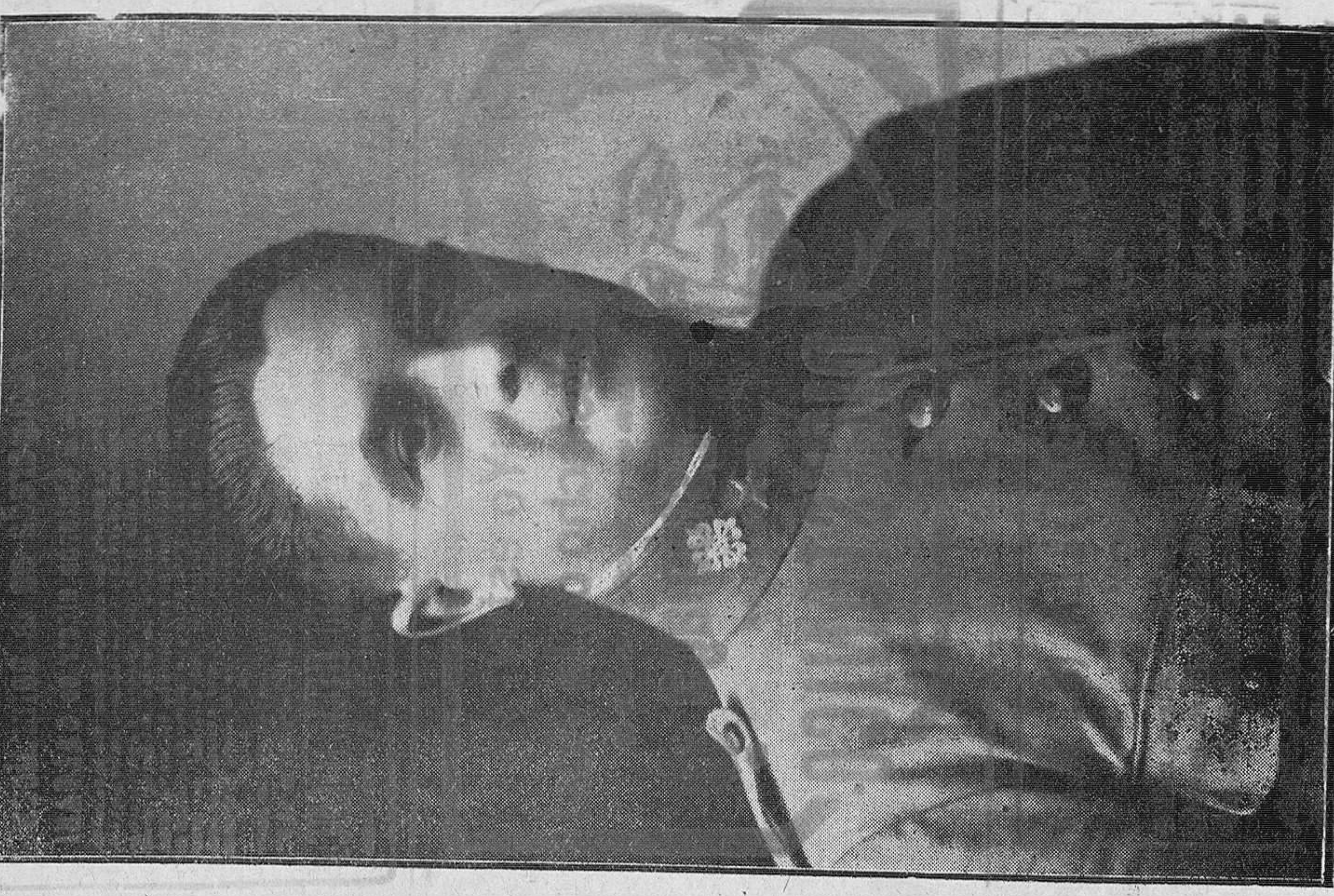
El comandante de Policía indígena, don Jesús Villar, natural de Laredo, asesinado por los franceses en 1808. En la foto se ve a Villar con su uniforme de entonces.