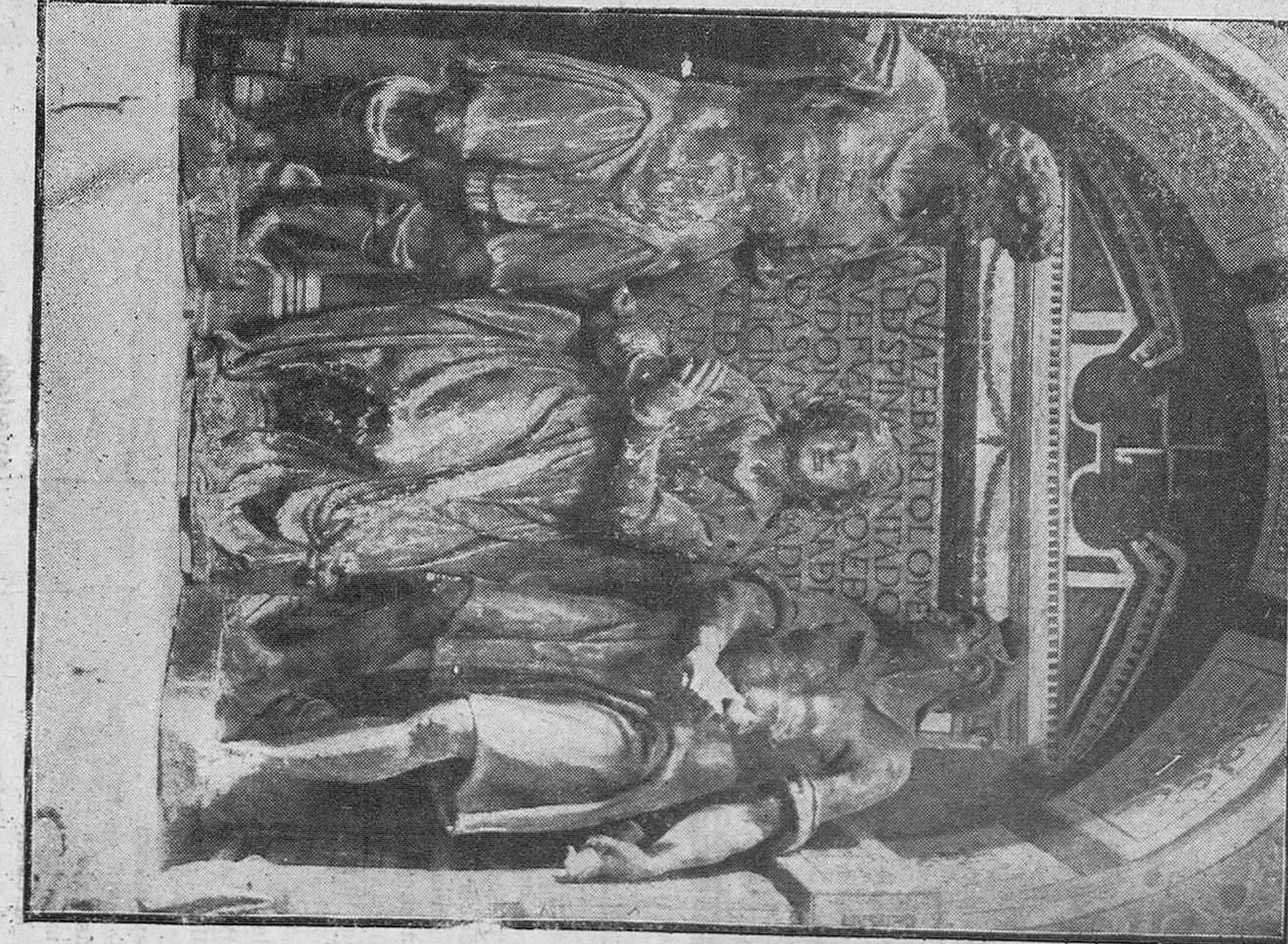
El martirio de Santa Catalina. Grupo escultórico que se conserva en la iglesia de Santa Catalina de Berruete.

En la patria de Berruete. TALLERES PUERTA LA SIERRA 2. Teléfono núm. 139.