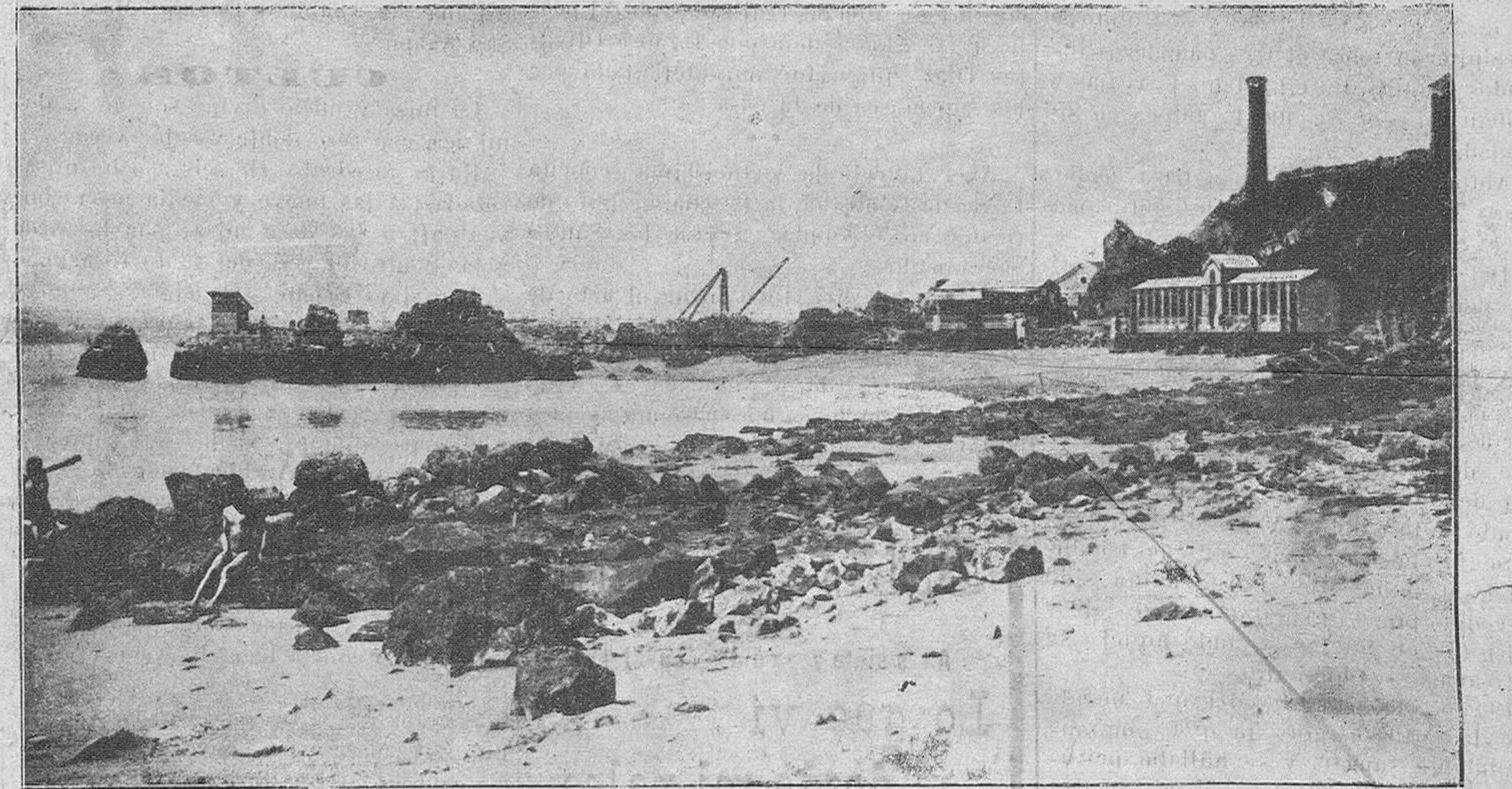
La playa de San Martín hace 20 años