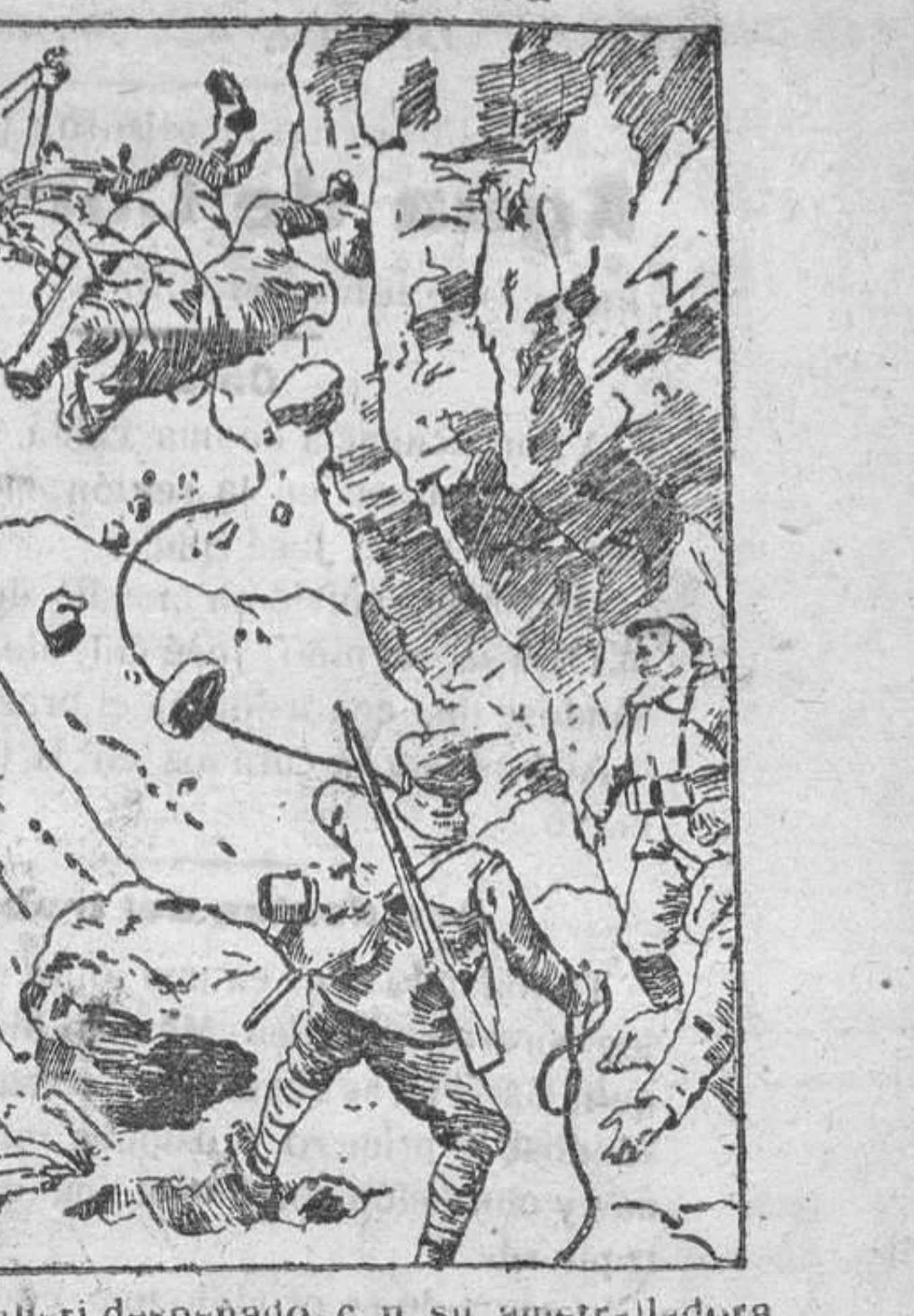
Bersagliero despenado con su ametralladora en una posición del arco.