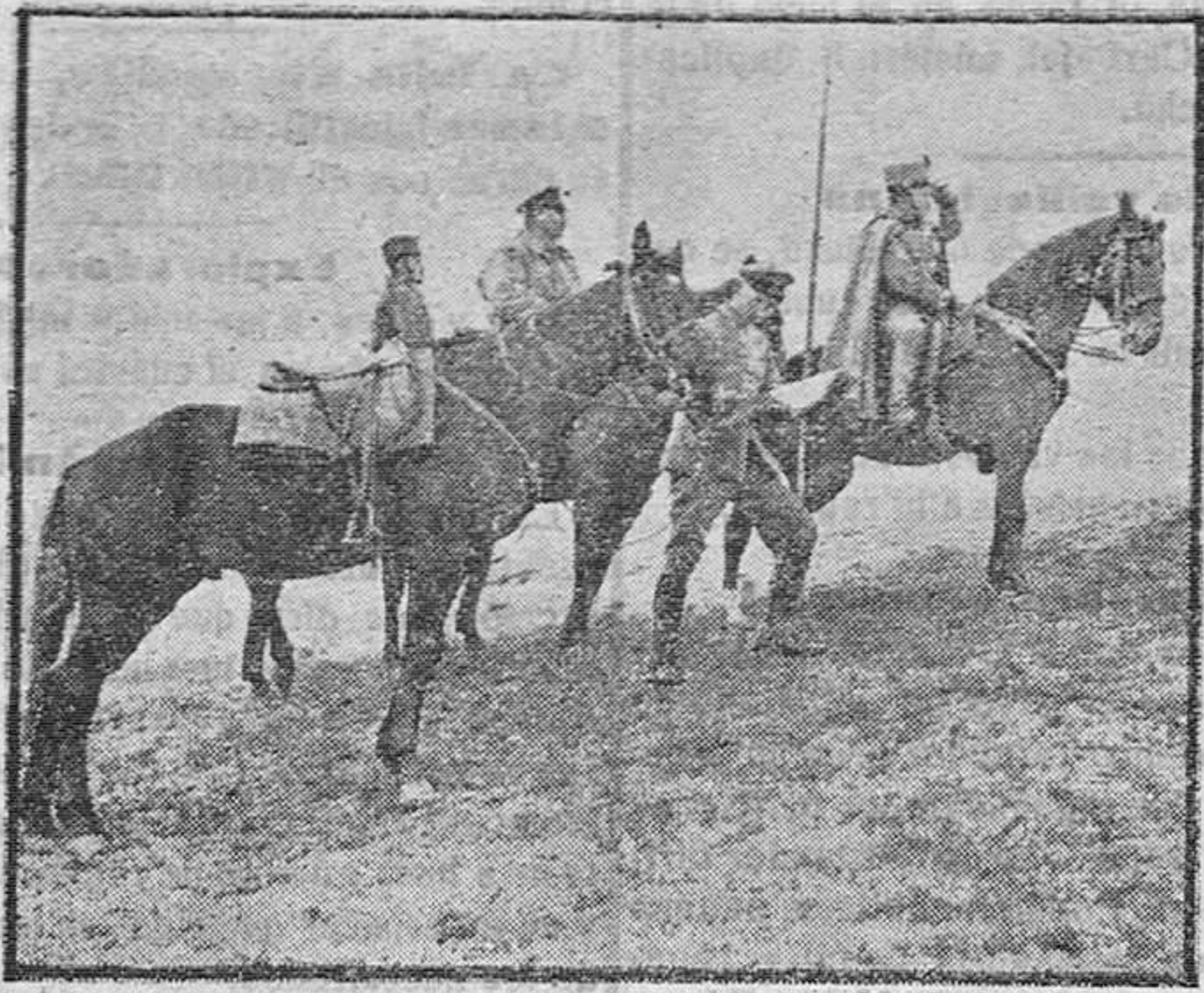
Patrulla de caballería alemana observando los movimientos del enemigo

Esto ocurrió el domingo último, o sea el 25 de los corrientes.