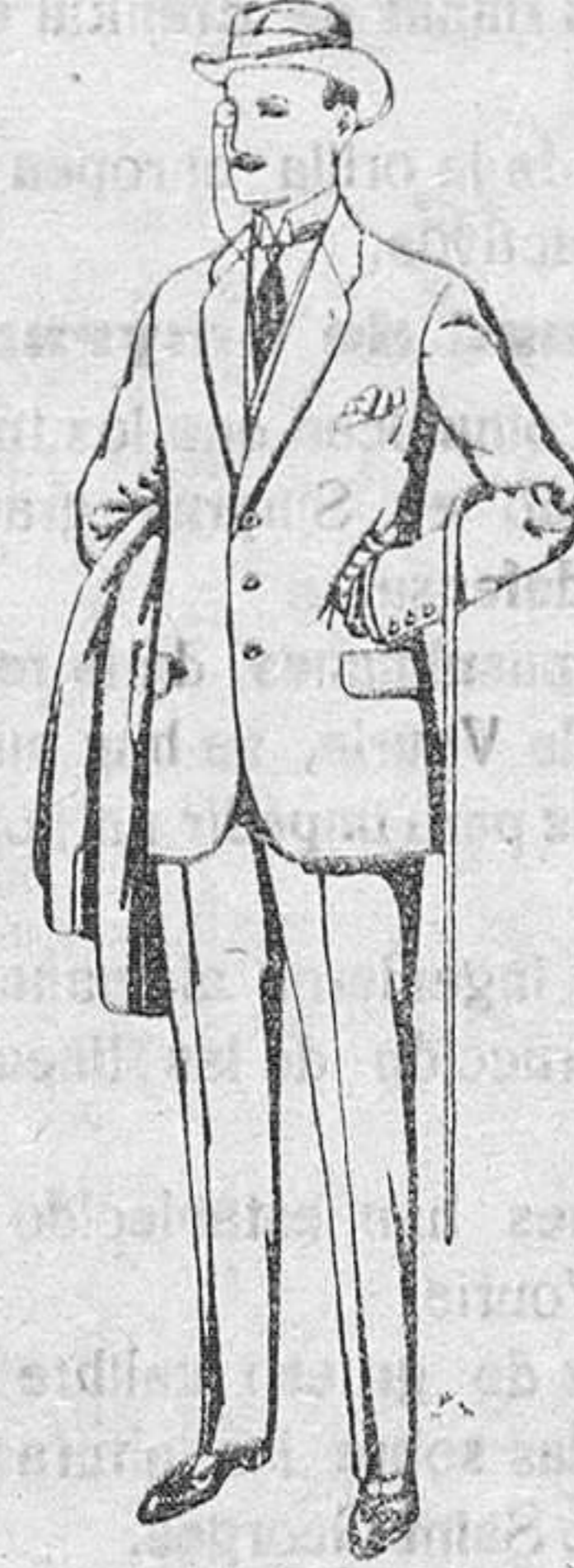
Trajes de paten cheviot, etc. De Pts. 17,50 a 70