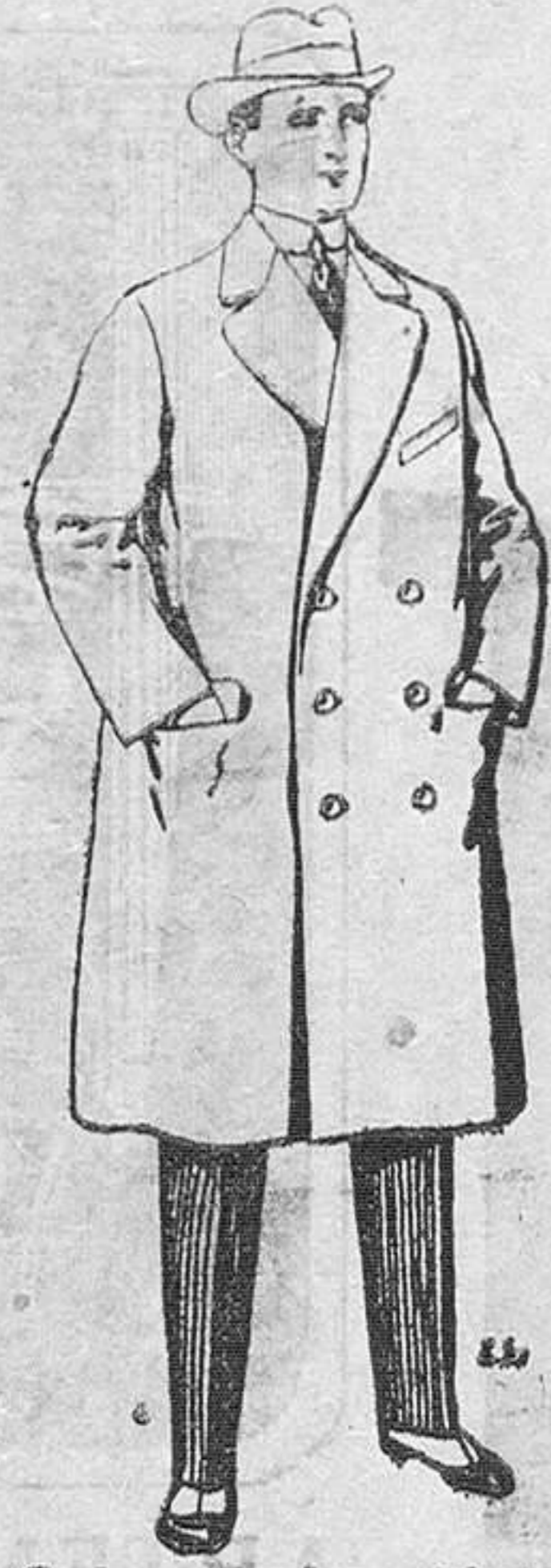
Gabanes de paten y cheviot. De Pts. 55 a 105