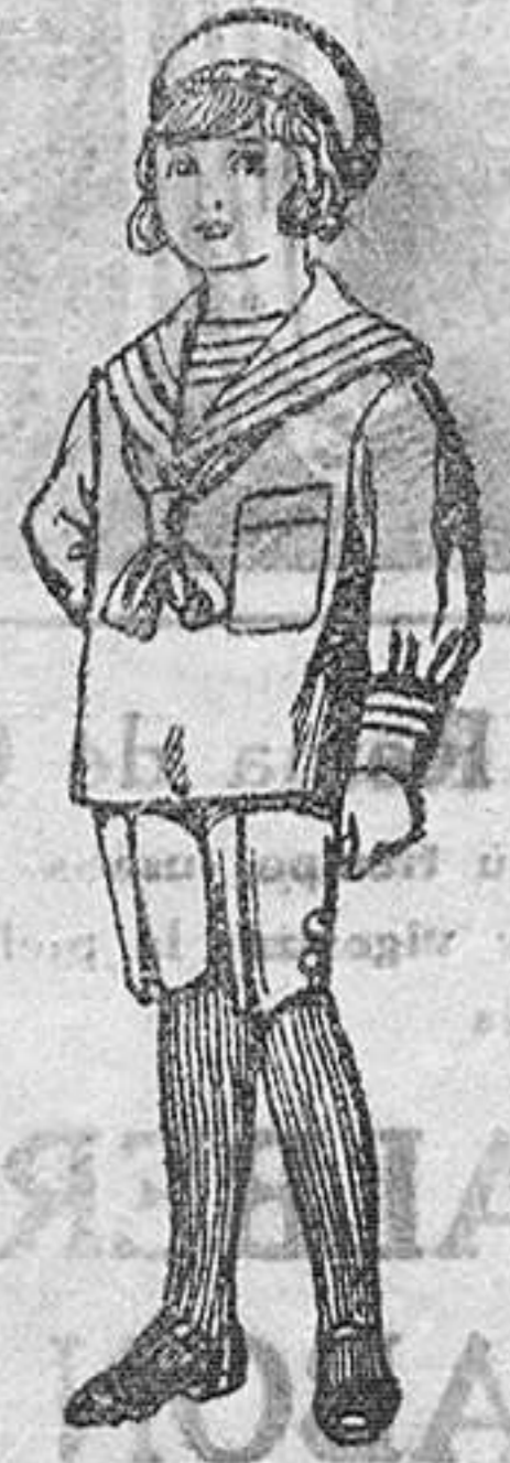
Trajes de jerga azul bordado en la manga para niños de 4 a 9 años De Pts. 20 a 22