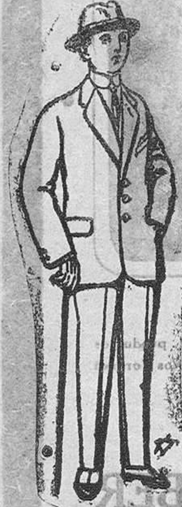
Trajes de paten vieja ó jerga, para niños de 10 a 18 años De Pts. 13 a 48