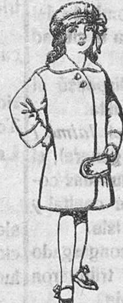
Abrigos de paten para niños de 4 a 9 años De Pts. 20 a 28