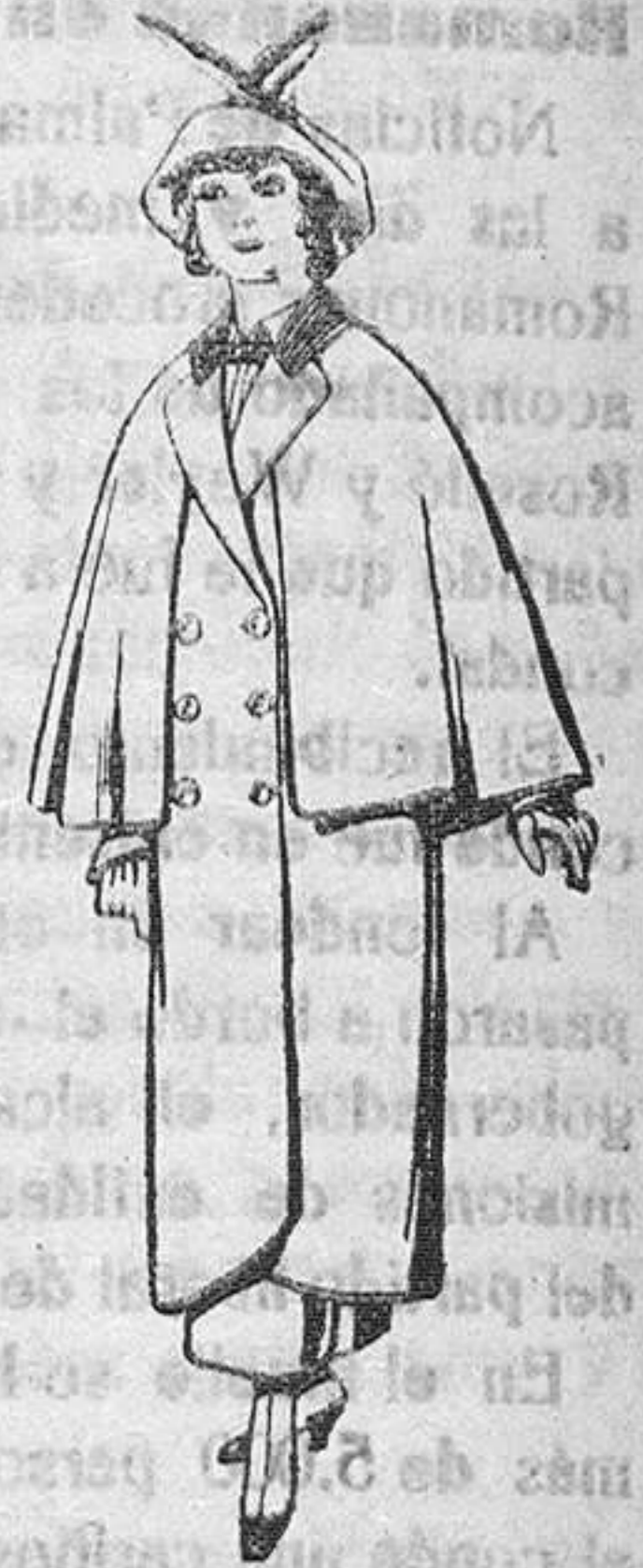
Abrigos de paten colores suaves para jovencitas de 12 a 16 años De Pts. 35 a 40

SECCIONES: Peletería, Camisería, Géneros de Punto, Corbatería, Guantería, Sombrerería, Zapatería, Paraguas, Bastones y Artículos de Viaje.