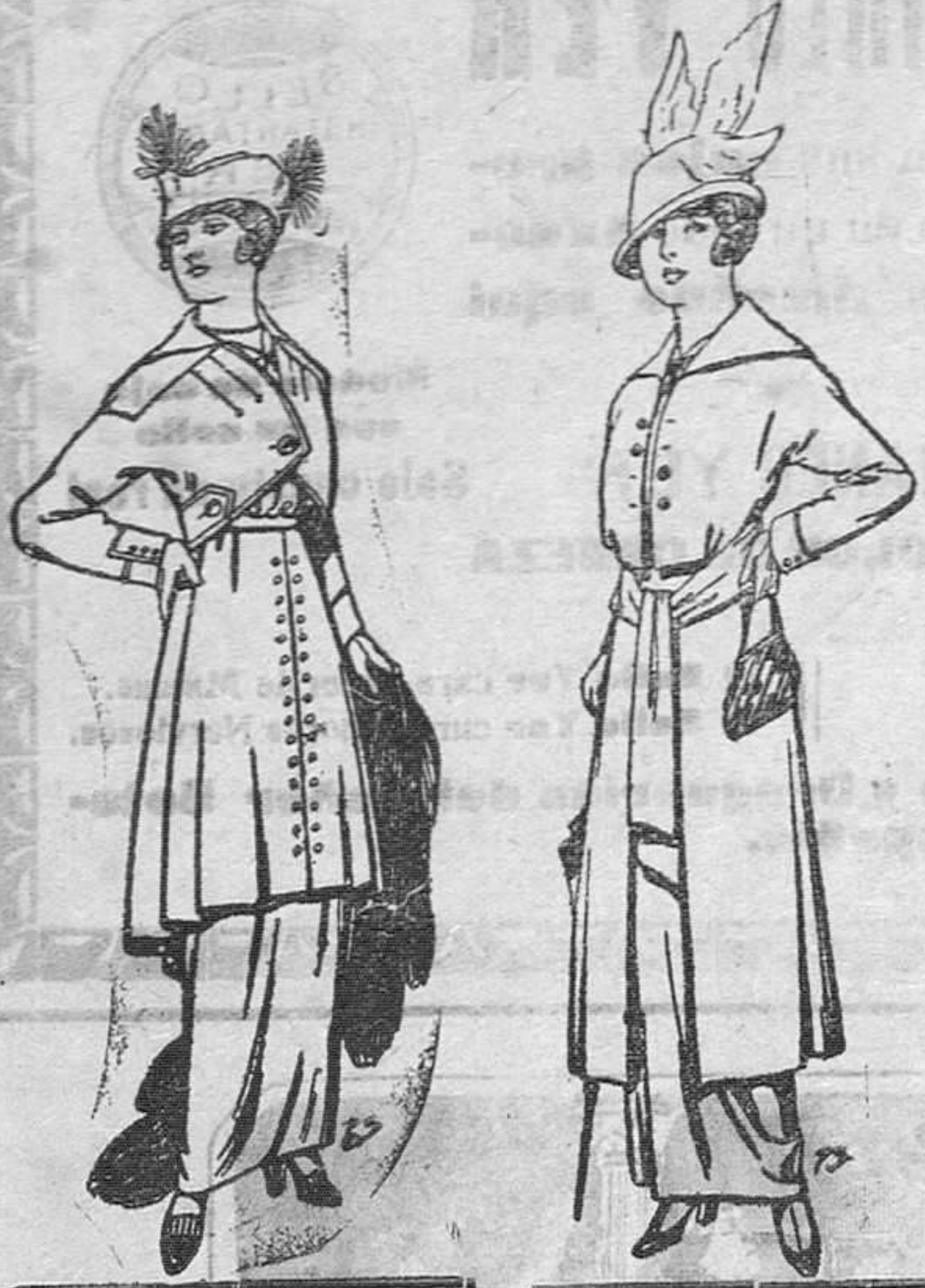
Trajes de jerga negra y azul Pts. . . 55

SUCURSALES: Madrid, Barcelona, Alicante, Almería, Bilbao, Cádiz, Cartagena, Gijón, Granada, Málaga, Palma de Mallorca, Sevilla, Valencia, Valladolid, Zaragoza