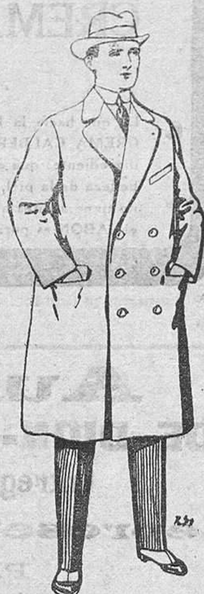
Gabanes de paten y cheviot. De Pls. 55 a 105