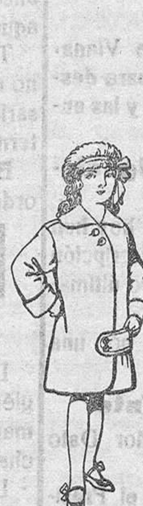
Abrigos de paten para niños de 4 a 9 años De Pls. 20 a 28