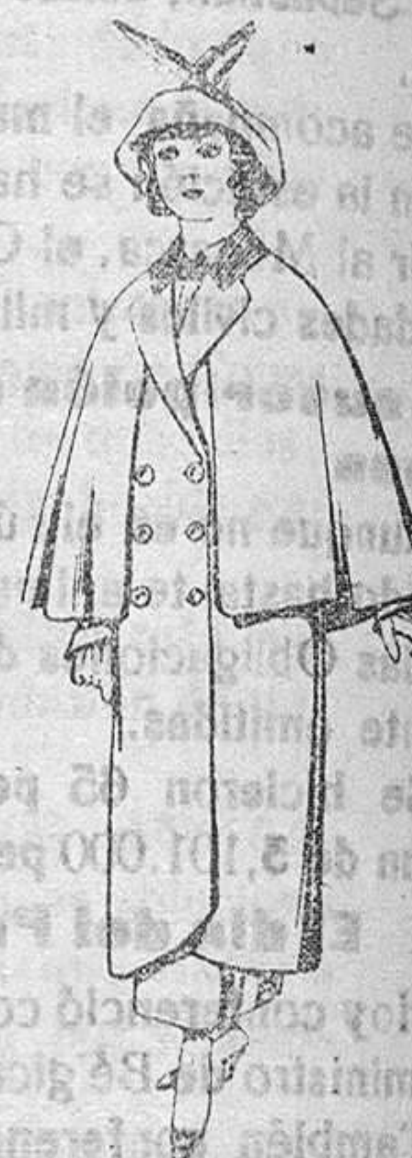
Abrigos de paten colores para niñas de 4 a 9 años De Pls. 35 a 40

SECCIONES: Peletería, Camisería, Géneros de Punto, Corbatería, Guantería, Sombrerería, Zapatería, Paraguas, Bastones y Artículos de Viaje.