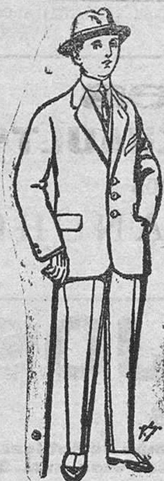
Trajes de paten vie. ó jerga para niños de 10 a 18 años De Pls. 13 a 48