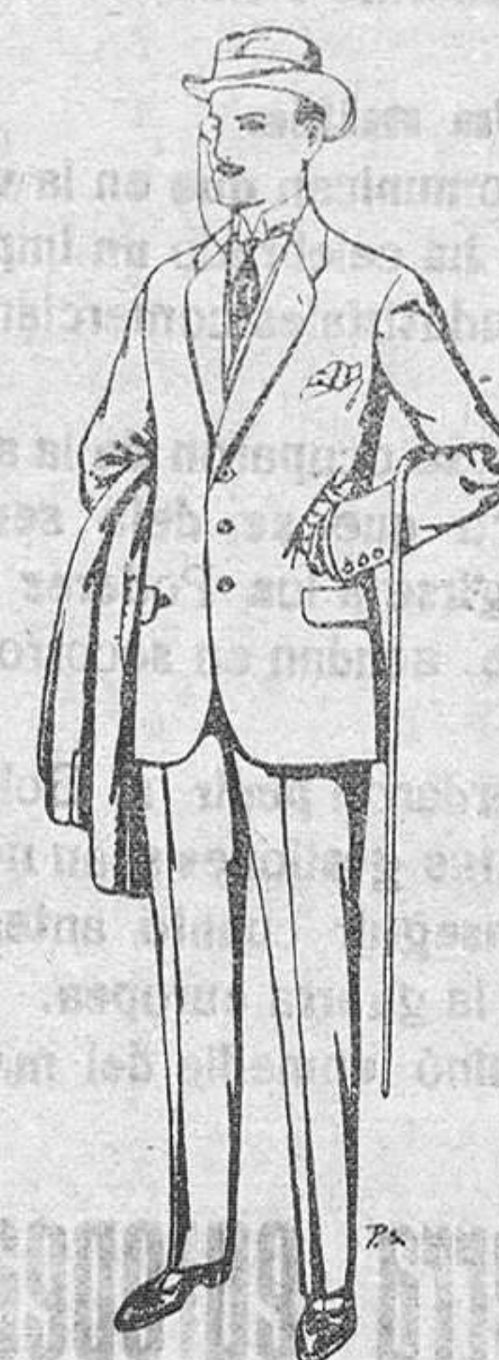
Trajes de paten cheviot, etc. De Pls. 17,50 a 70