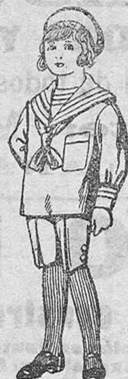
Trajes de jerga azul bordado oro en la manga para niños de 4 a 9 años De Pls. 20 a 22