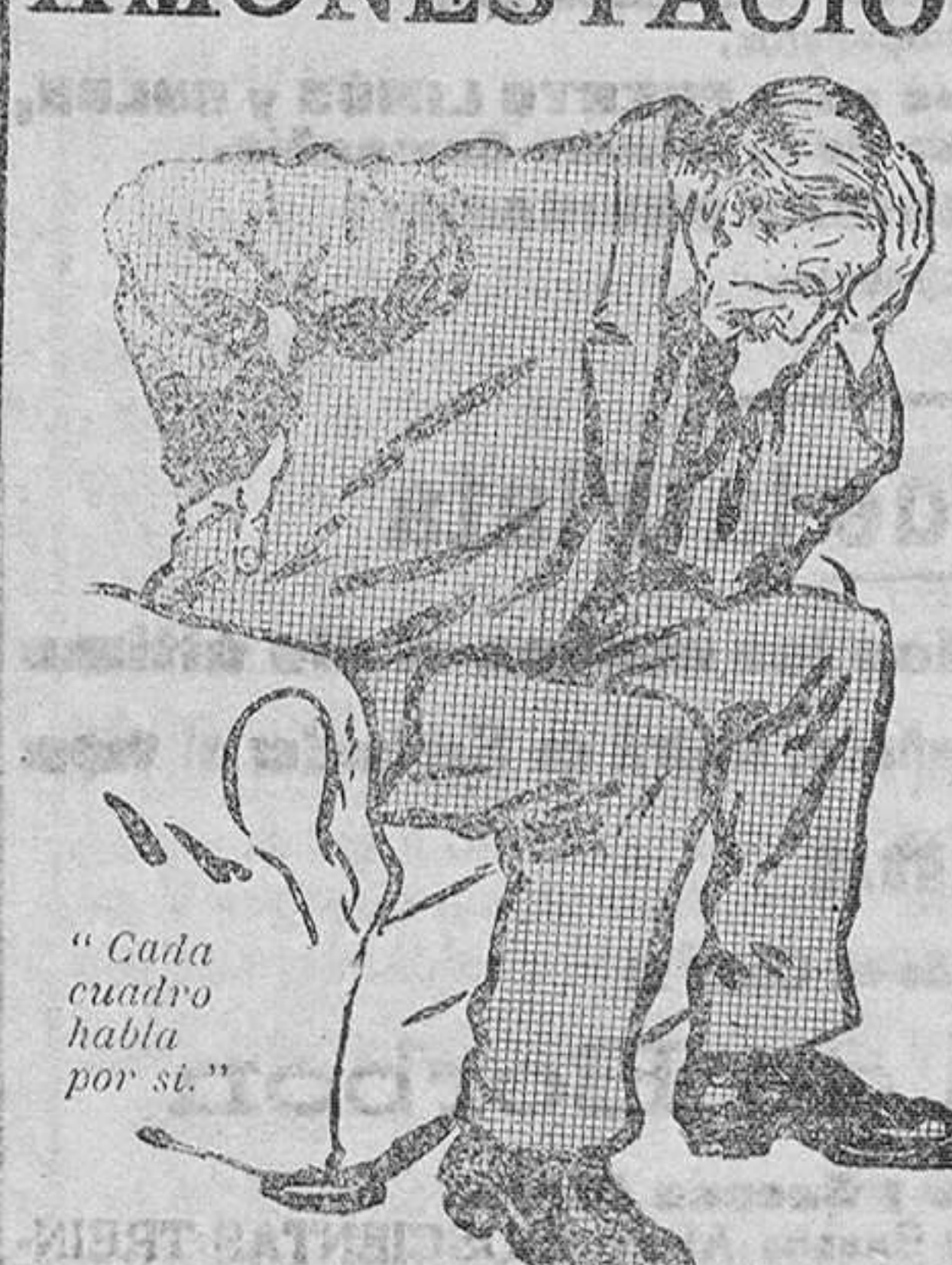
«Cada cuadro habla por sí»

De venta en la Librería General, Boulevard de Amós de Escalante, y en la del señor San Recreales, calle de la Blanca.