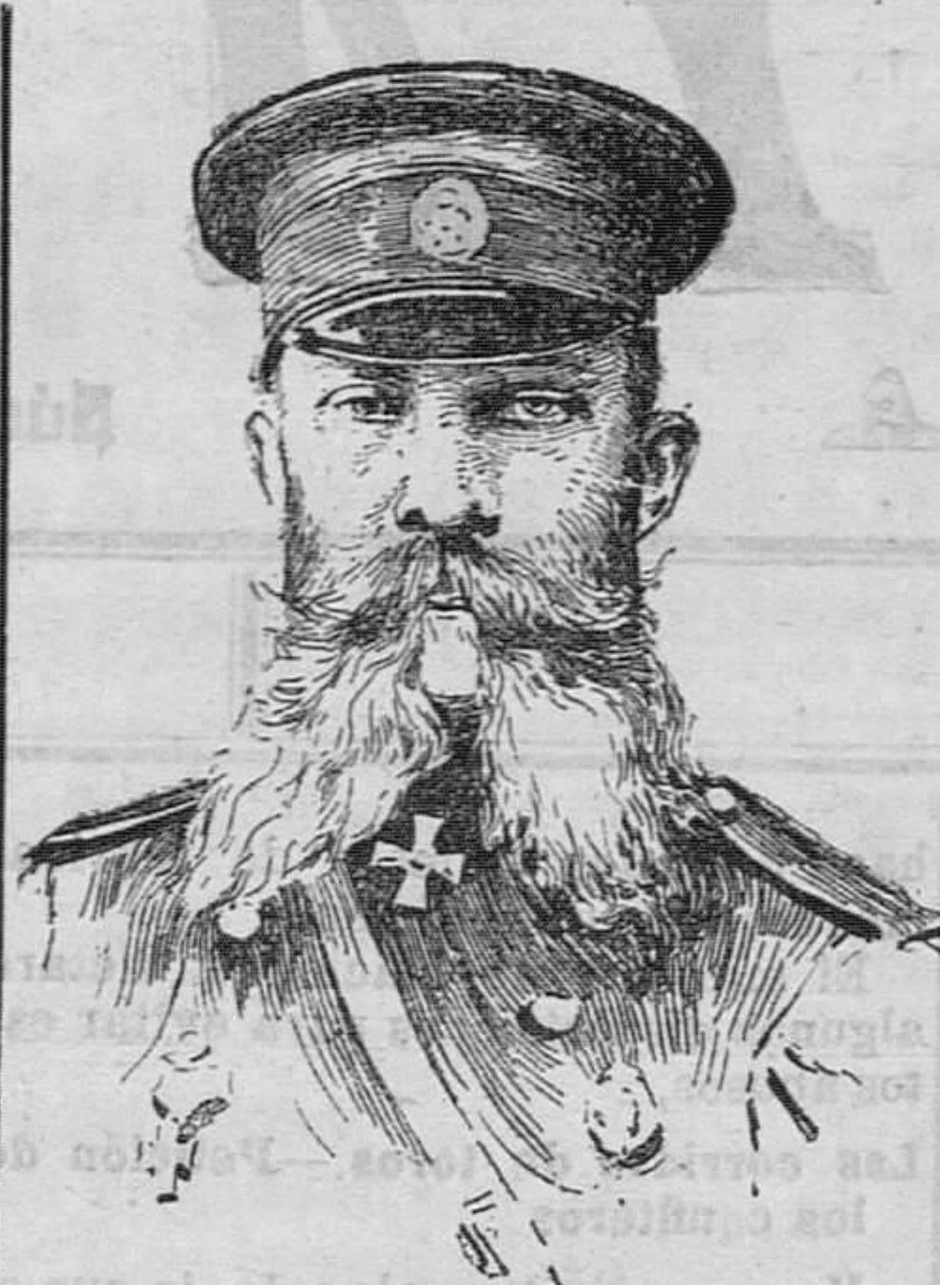
El general Gripenberg, comandante del primer cuerpo de ejército ruso...