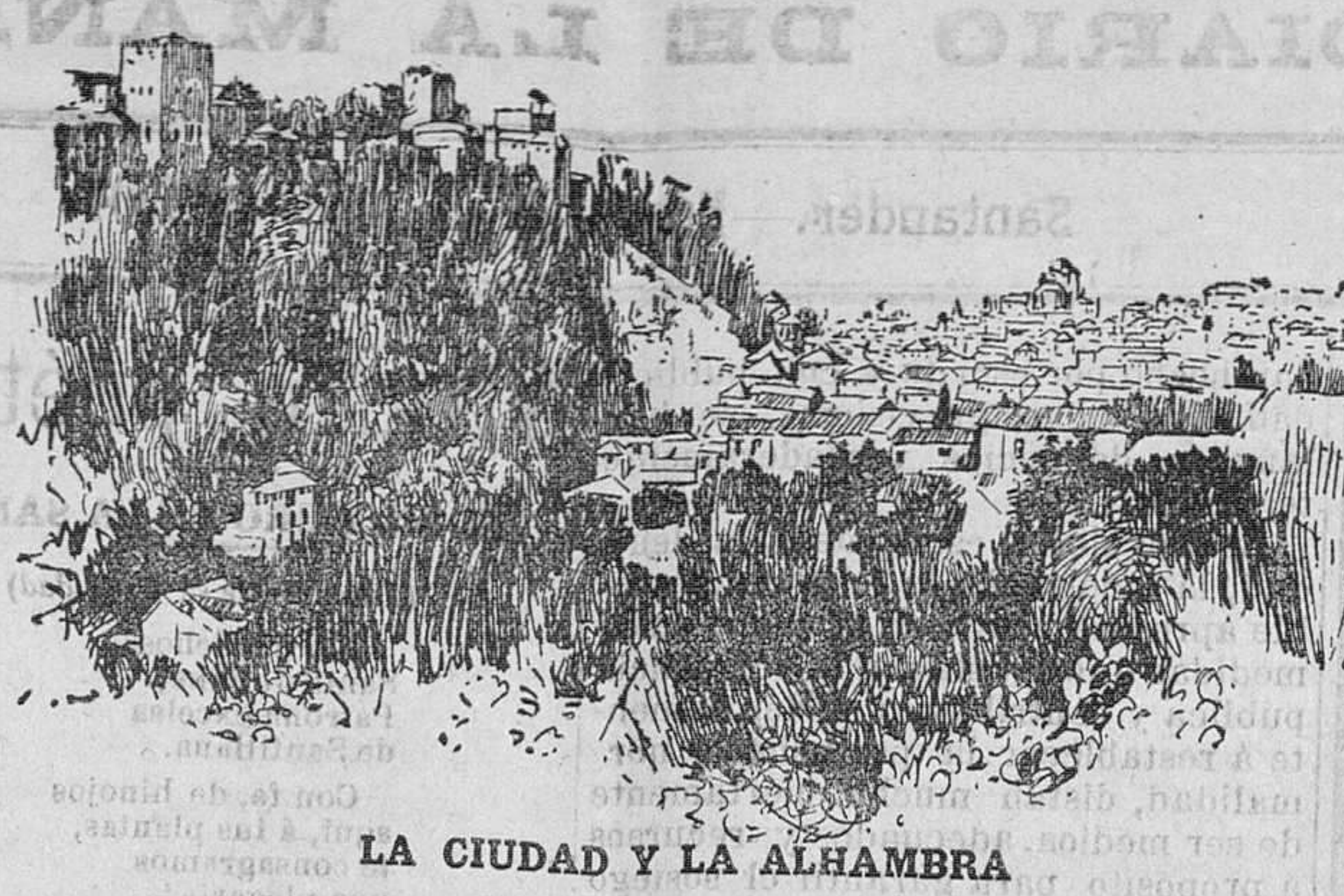
LA CIUDAD Y LA ALHAMBRA