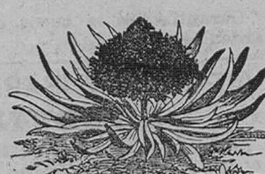
Socilla del Perú, Azul y blanca. Pieza, 1 peseta; docena en dos variedades, 6'50 pesetas.