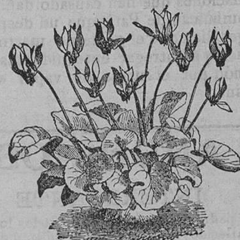
Ciclamen de Persia, Europa y Nápoles, 4 variedades.—Pieza, 75 cts.; docena, 6 pesetas.