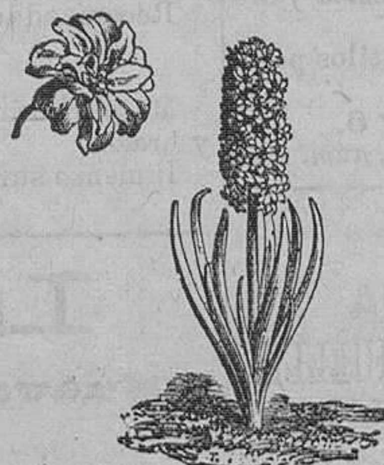
Jacintos dobles variados. Pieza, 50 céntimos; docena, 4'50 pesetas. El 100 en 24 variedades, 26 pesetas.