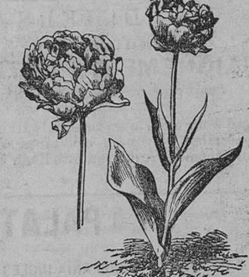
Tulipán doble. Pieza, 50 céntimos; docena, 4 50 pesetas; 100 en 24 variedades, 26 ptas.