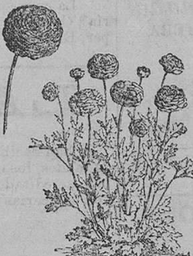
Renunculus dobles.—Pieza, 40 cts.; docena, 3'50 ptas.—En 50 variedades, 20 pesetas 100.