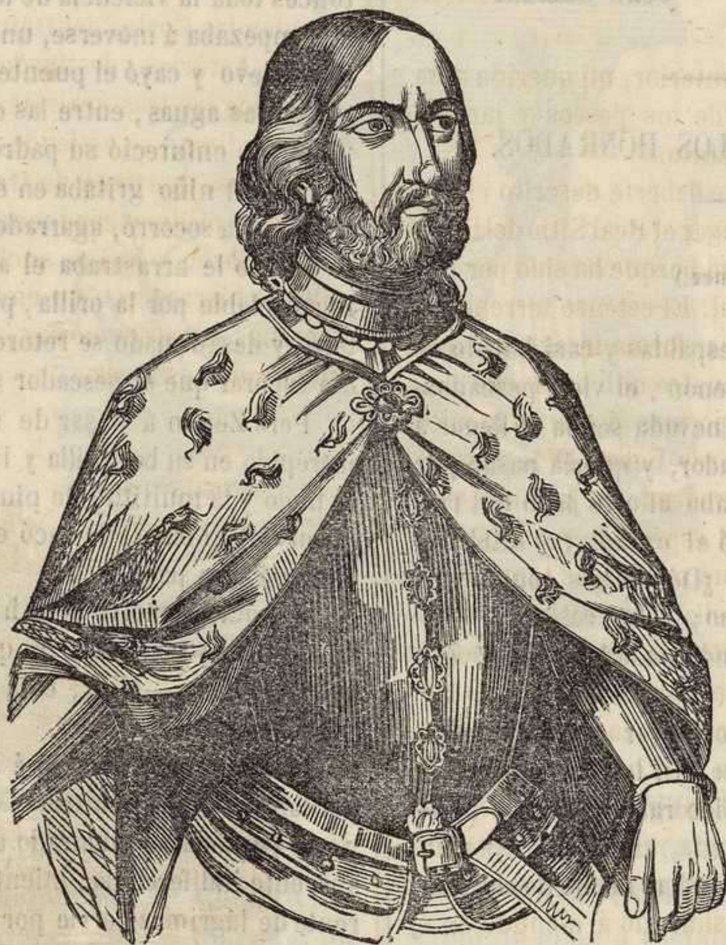
Don Ordoño primero.

Amado de sus súbditos por su piedad y virtudes,