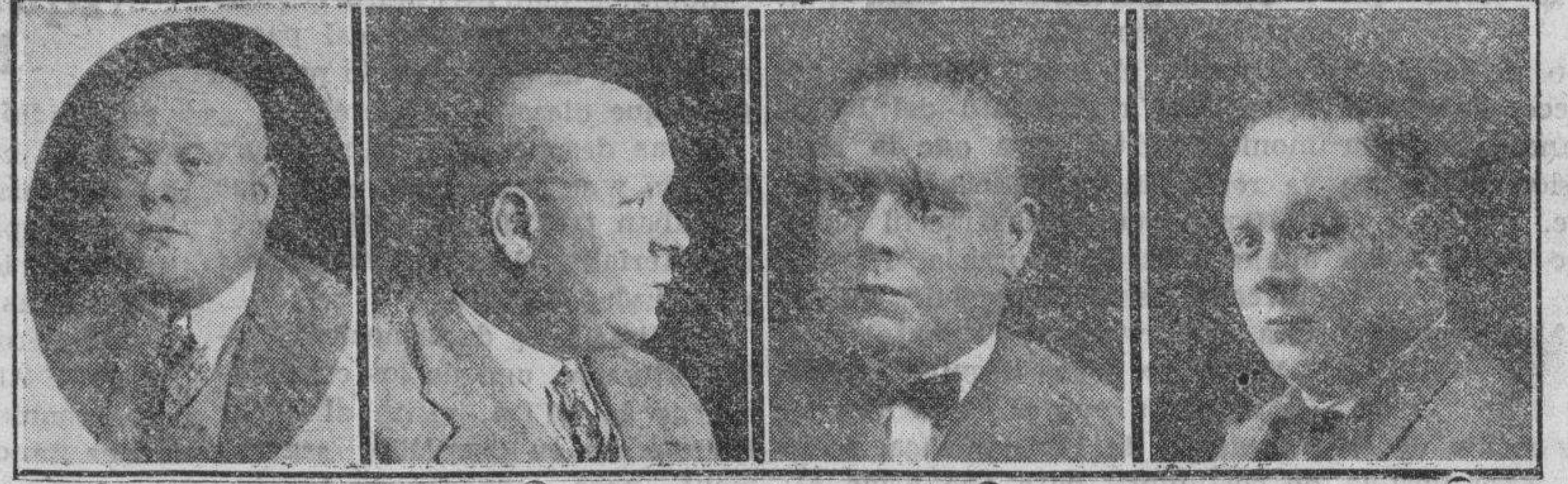
18 años calvo 5 meses tratamiento 9 meses tratamiento 14 meses curado

Con el fin de demostrarles prácticamente sus maravillosas curas se proyecta una película científica de casos rebeldes curados después de llevar 30 años de Calvicie en el CINEMA ROYAL de Castellón, los días 5, 6, 7, 8 y 9 en todas las sesiones y en Valencia en el CINEMA SUIZO los días 10, 11, 12, 13, 14, 15 y 16 recibiendo gratuitamente en el Hotel Internacional desde las 9 de la mañana has nueve de la noche