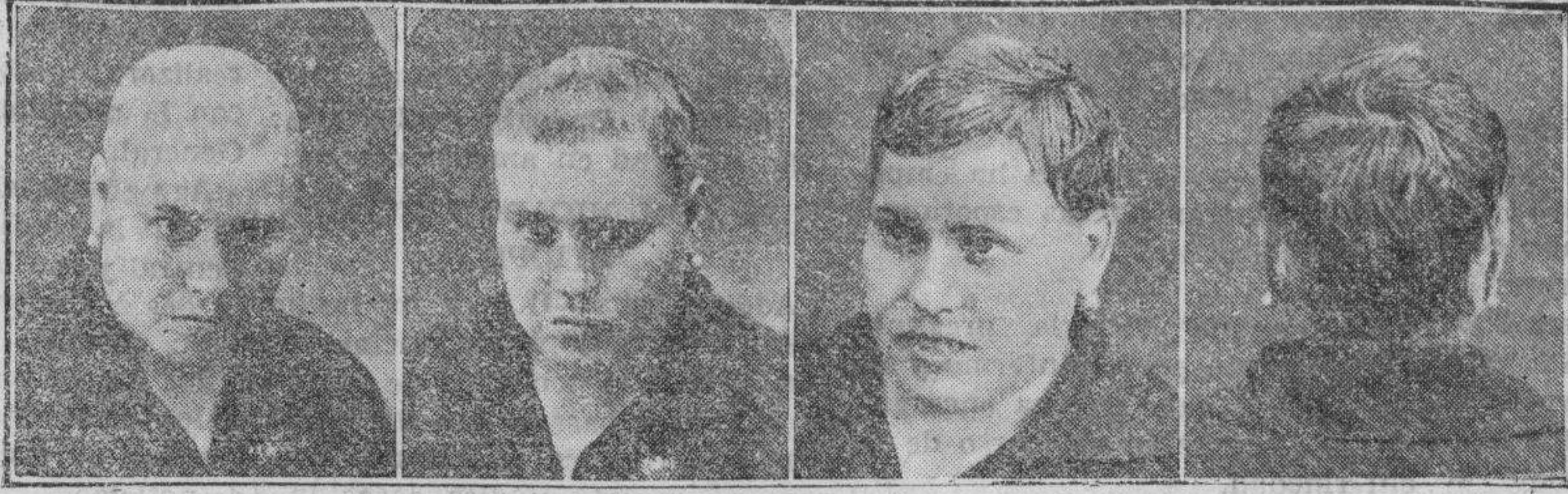
14 años calva 5 meses tratamiento 8 meses tratamiento 12 meses curada

Recibiré a los interesados gratuitamente lunes en Castellón Hotel Suizo y martes, miércoles y jueves en el Hotel Internacional, Bailén, 8-Valencia REVELACION SENSACIONAL. El rejuvenecimiento de la fisonomía humana con el tratamiento del capilar J. MOURADE