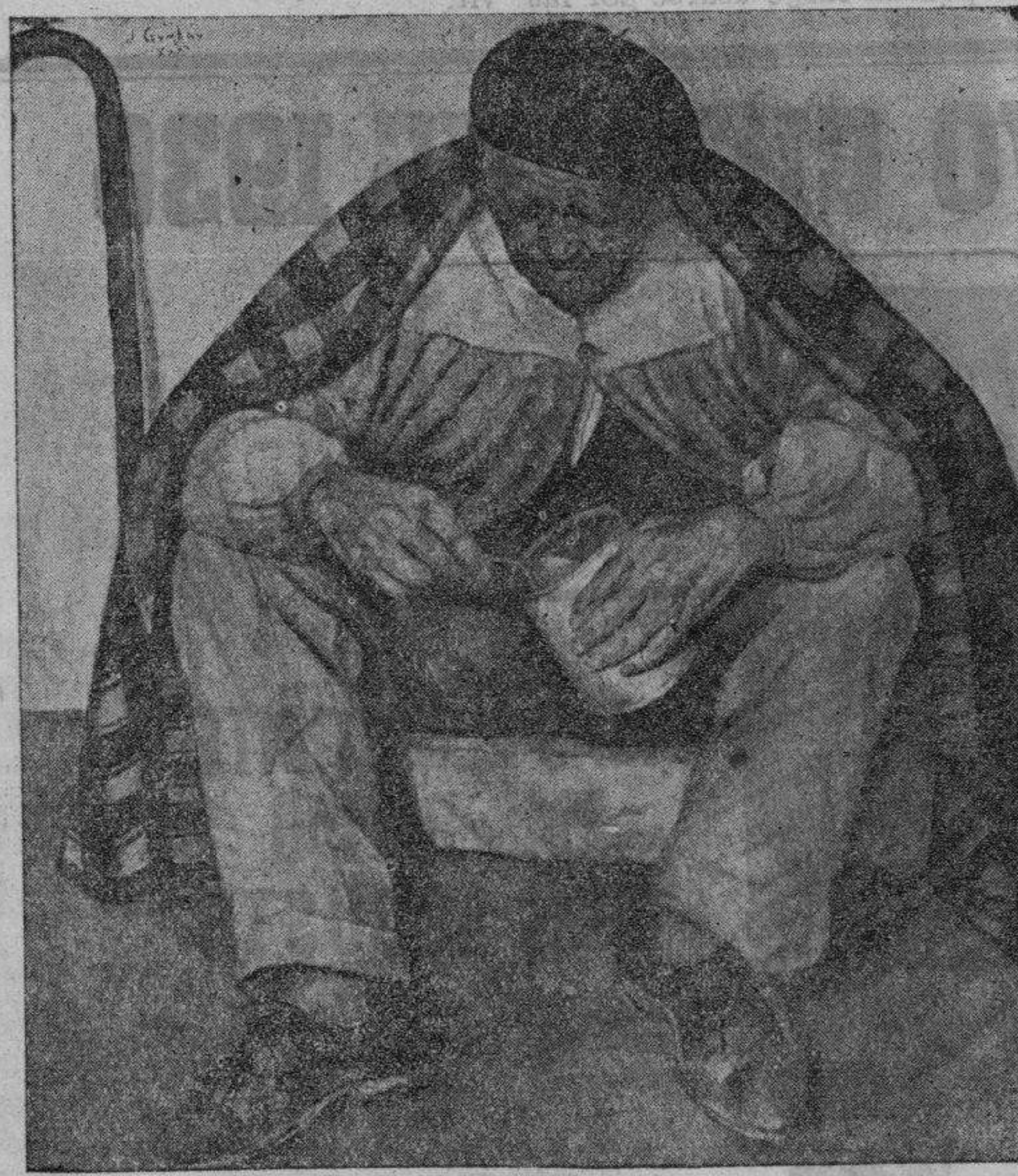
RECOMPENSA AL TRABAJO

Y compuso su formidable cuadro "Recompensa al trabajo", cuyo grabado avalora este reportaje.