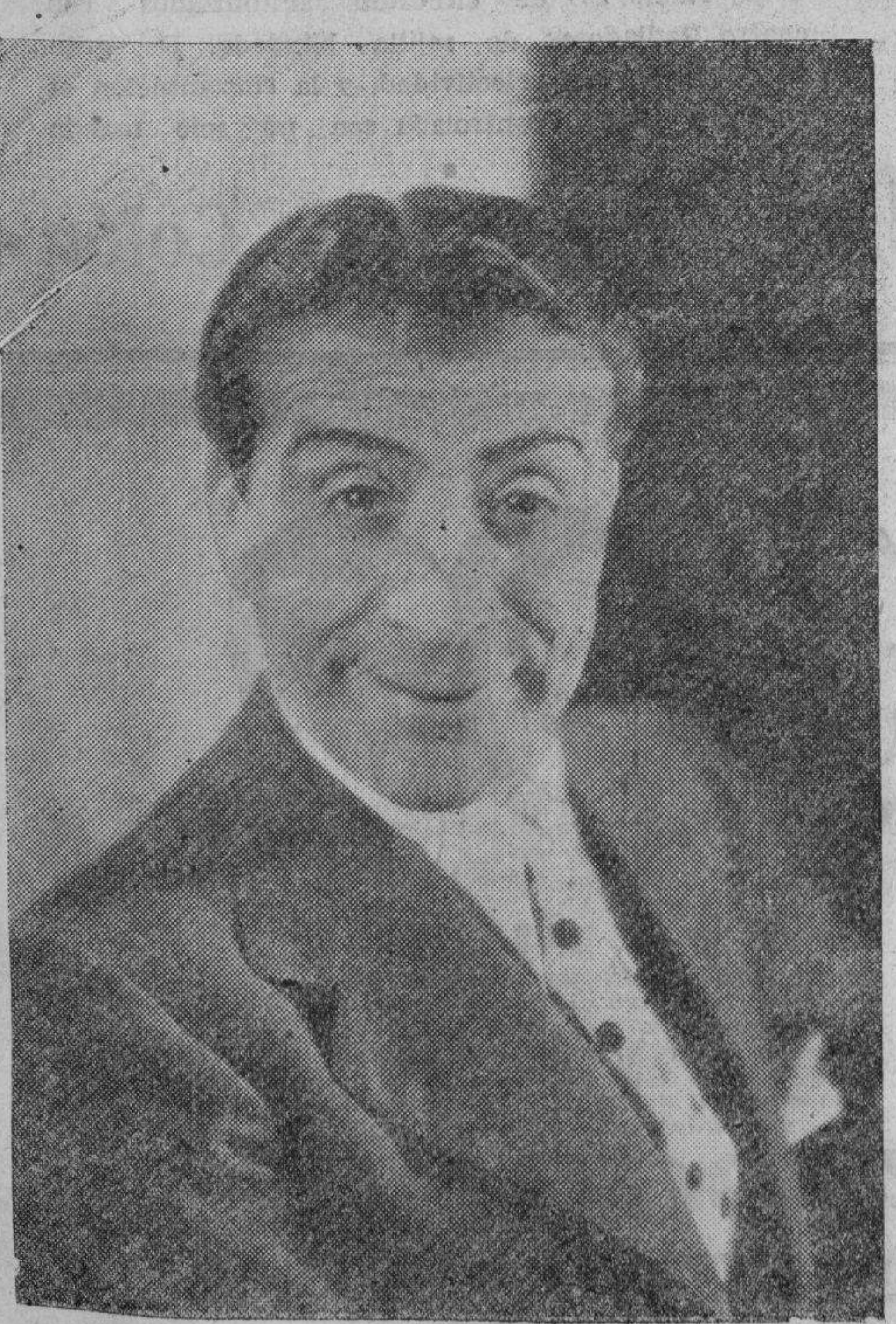
MIGUEL LIGERO, el popular y saladisimo actor, que hace una verdadera creación de su rol en la película CIFESA, LA HERMANA SAN SULPICIO