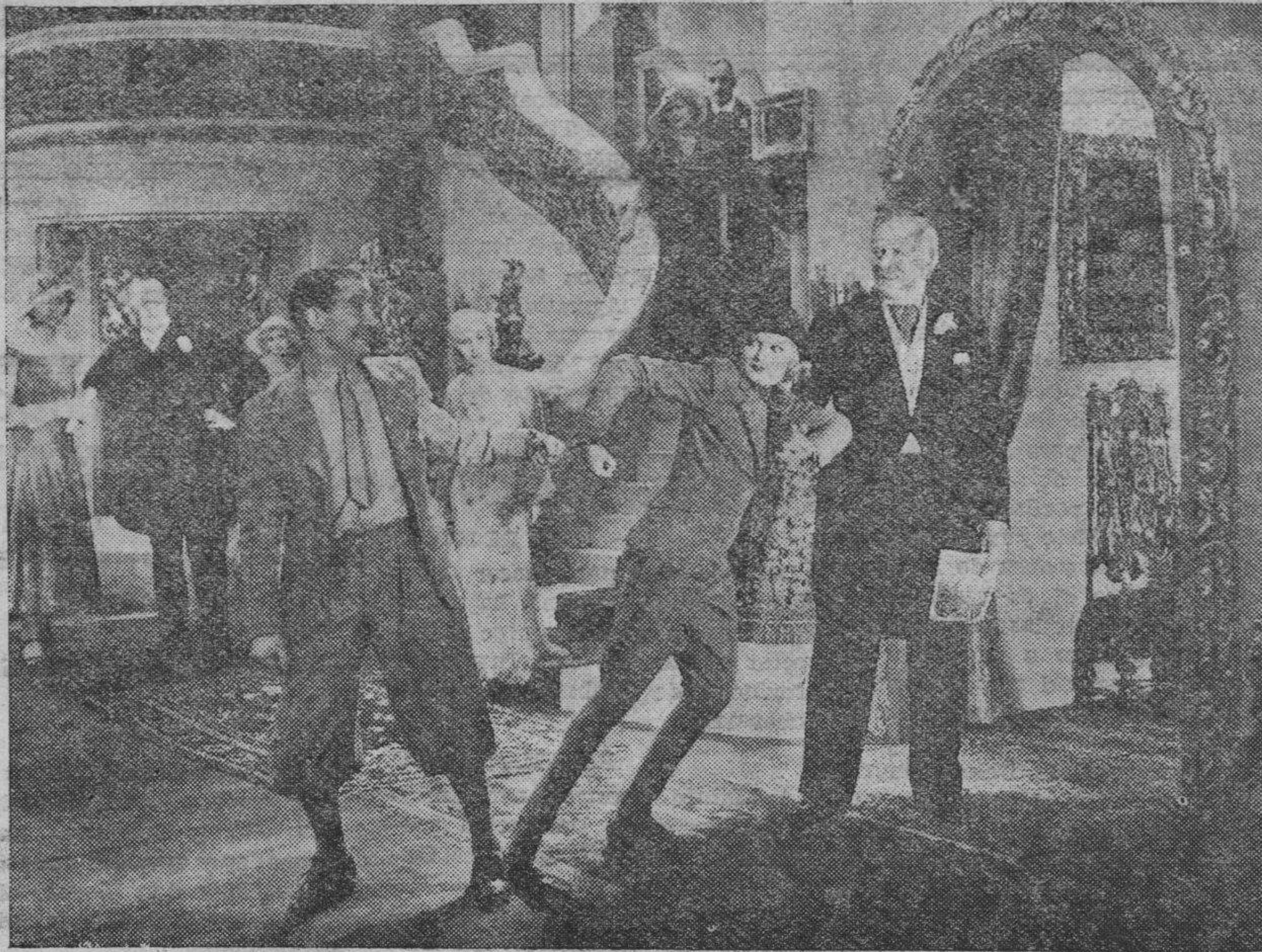
Una escena de la divertidísima producción ¡VAYA NIÑA! que CIFESA presentará en breve en uno de nuestros más concurridos salones