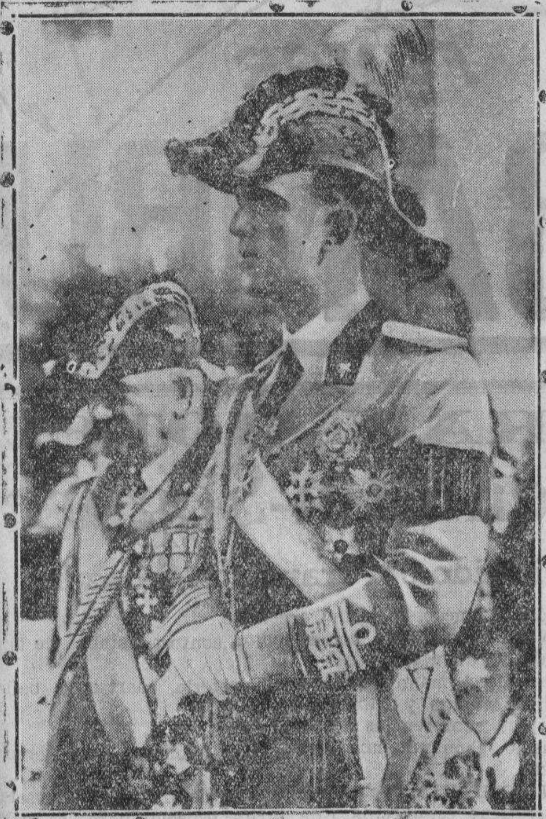
Se ha celebrado en Roma con gran brillantez, el aniversario de la fundación del Regimiento de granaderos en presencia del príncipe heredero Humberto (a la izquierda)