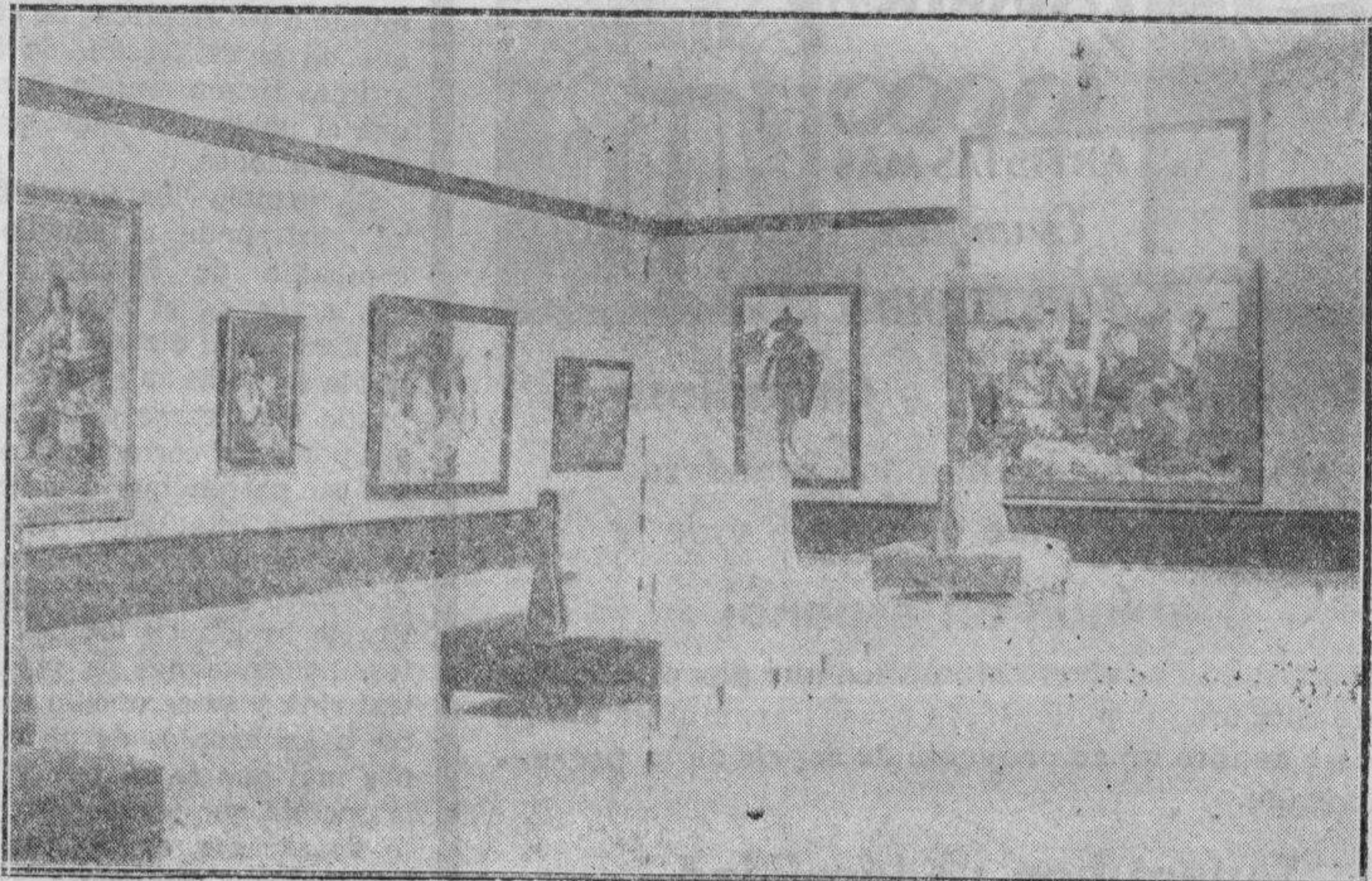
Otra sala del Museo