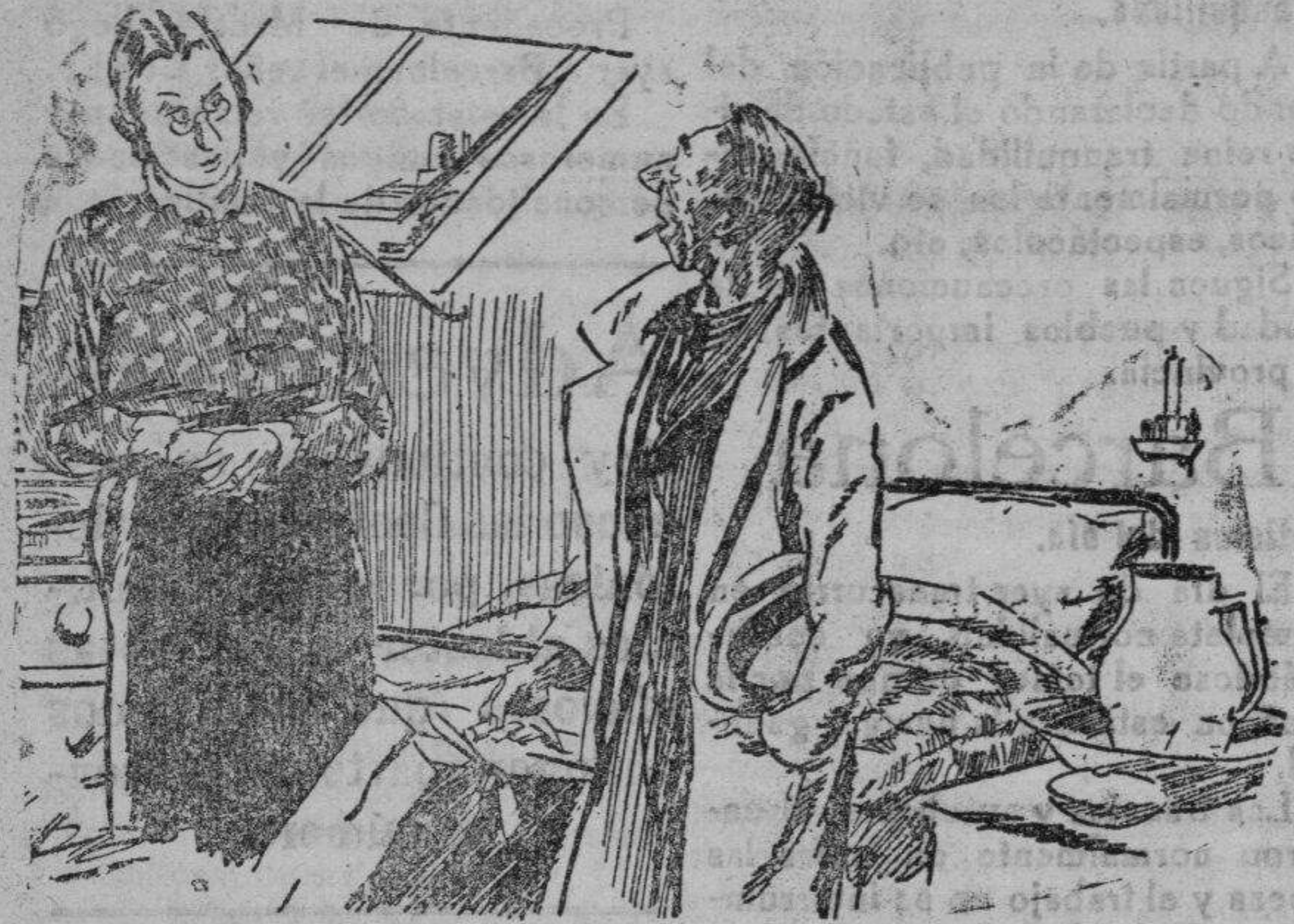
El huésped curioso

el camión UNIC es garantía de buen servicio durante muchos años la amortización de su valor resulta mucho más económica y su beneficio más prolongado e. dávalos masip - castellón - calle cajal, 31