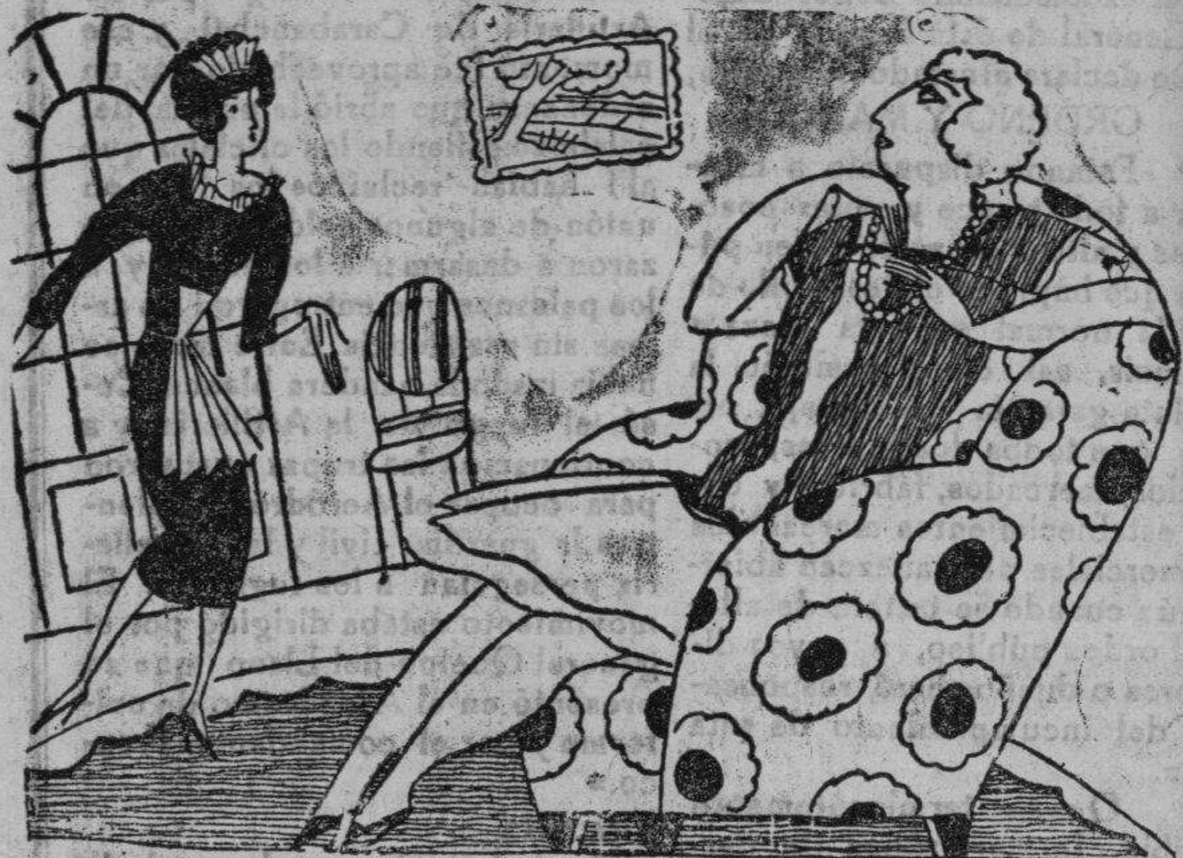
El paquete recibido

Central: Herrero. 23.-Teléf. 205 Sucursal: R. Mijares, 65 y 67.-Teléf. 344 CASTELLON