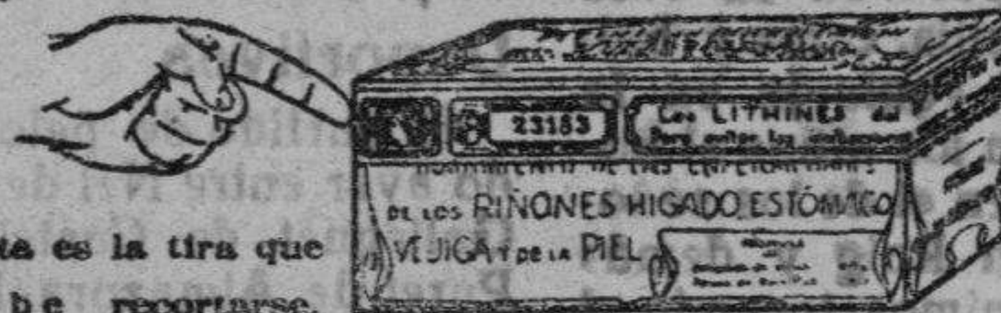
Esta es la tira que debe recortarse.

Representantes generales para España: Establecimientos Dalmáu Oliveres, Sociedad Anónima, P.º Industria, 14, Barcelona.