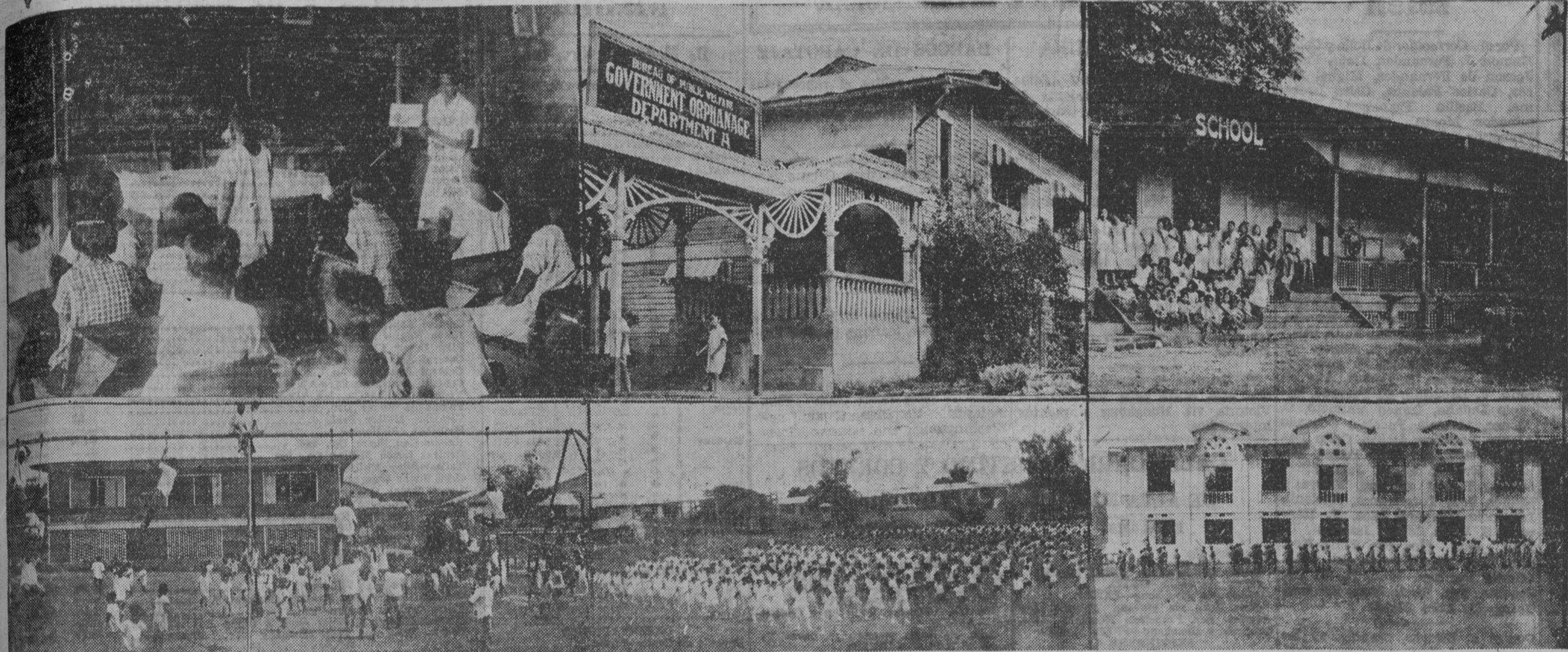
Vistas de Welfareville, la villa del Bienestar Infantil

El "Welfareville", la institución donde el gobierno se encarga del cuidado de los niños bajo la supervisión del Comisionado de Bienestar Público, abarca una extensión de 50 hectáreas de terrenos en el pueblo de San Felipe Neri, Rizal, a diez kilómetros de Manila. Esta institución lleva apropiadamente el nombre de "Villa de los Niños", porque dentro de ella y bajo su amparo viven y se educan un promedio de 1000 niños anualmente. Primeros años del Welfareville Aunque los esfuerzos que el gobierno está desplegando para el bienestar de los niños indigentes no es una actividad nueva, pues trabajos de esta naturaleza fueron comenzados el enero de 1917, el "Welfareville" es en sí una institución recientemente organizada. El terreno ocupado por esta villa fue comprado por el gobierno el 6 de enero de 1925, para afrontar la urgente necesidad de acomodar a los delincuentes menores que antes estaban bajo la custodia del gobierno de Manila. Con el establecimiento de esta villa estos delincuentes pasaron bajo la supervisión de la oficina del Co-