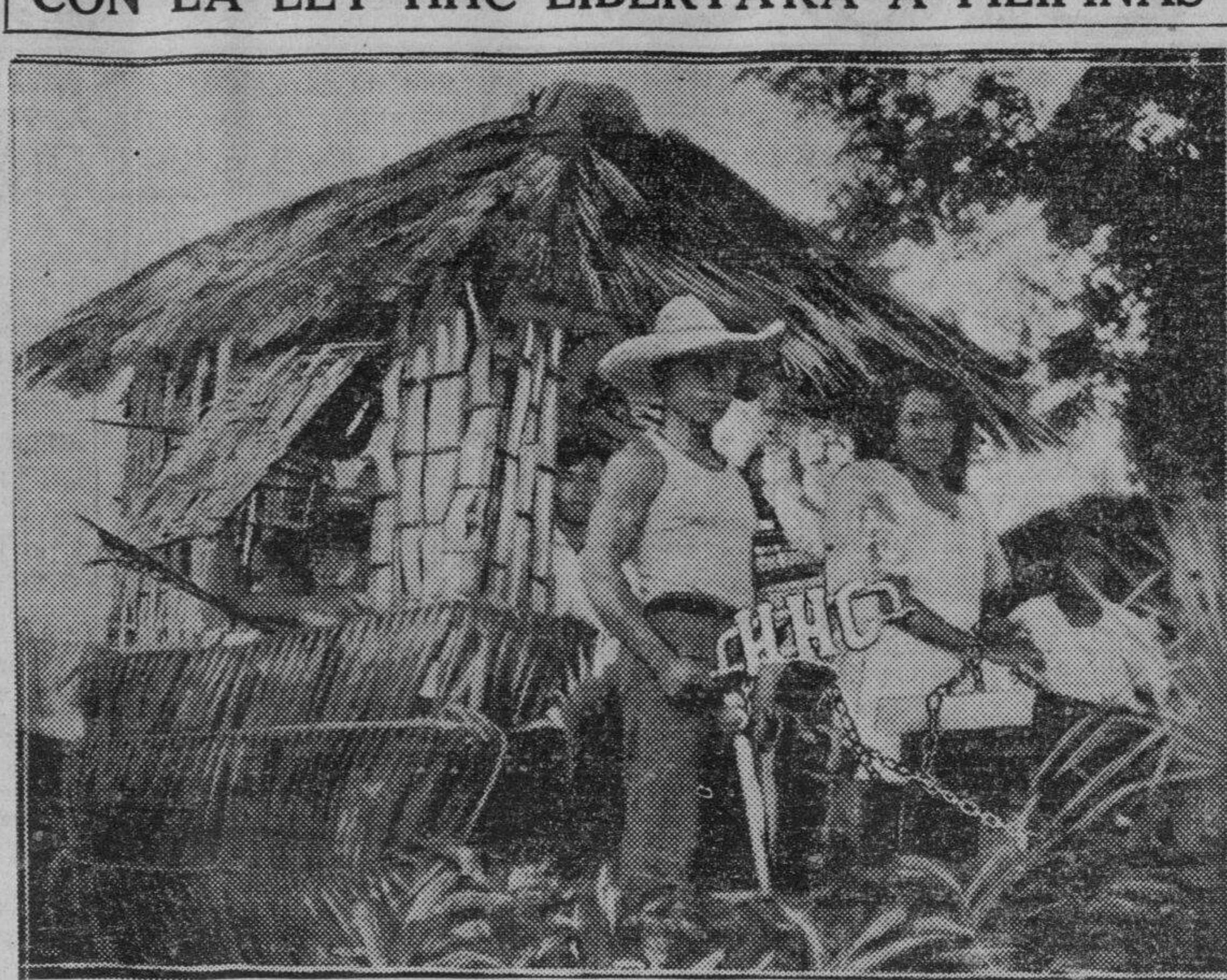
Carroza alegorica de la gran parada de los 'pros' en Daraga, Albay, en la que se ve a un hombre que tiene en sus manos el poder de la ley HHC para libertar a la mujer encadenada, Filipinas. Esta carroza fué muy aplaudida por la multitud que vio la manifestación.