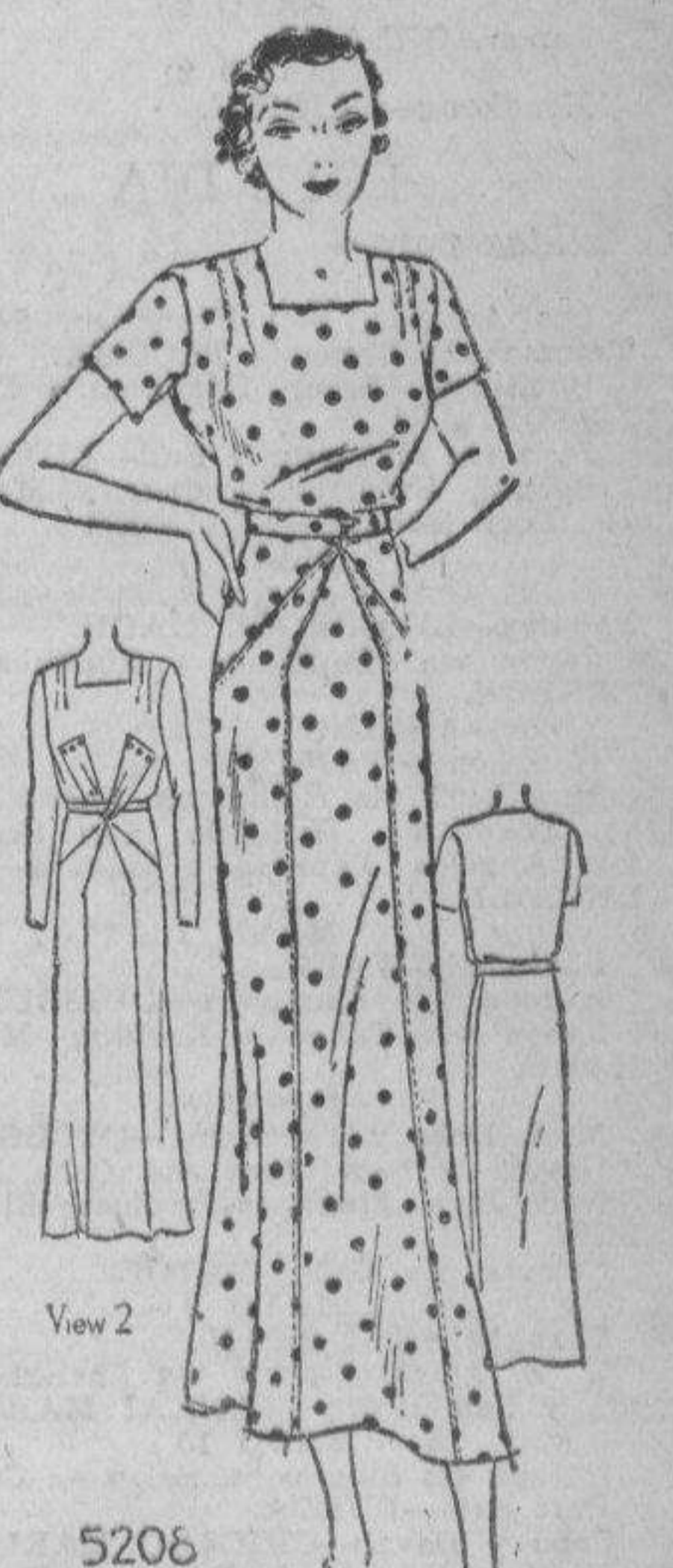
FASHION BUREAU (LA VANGUARDIA) United Features Suite 1110, 220 East 42nd St.

dicadora, que se olvidó de su muleta al dejar el teatro. El olvidadizo señor se presentó al día siguiente a reclamarla. El empresario, a quien no se le escapa una mosca cuando se trata de publicidad, tuvo una feliz idea: le regaló al olvidado y satisfecho parroquiano una muleta de lujo (que ya, suponemos, no necesitaba el cojo) y el artefacto original cruzó el Pacífico en via al salon de trofeos de la Columbia!