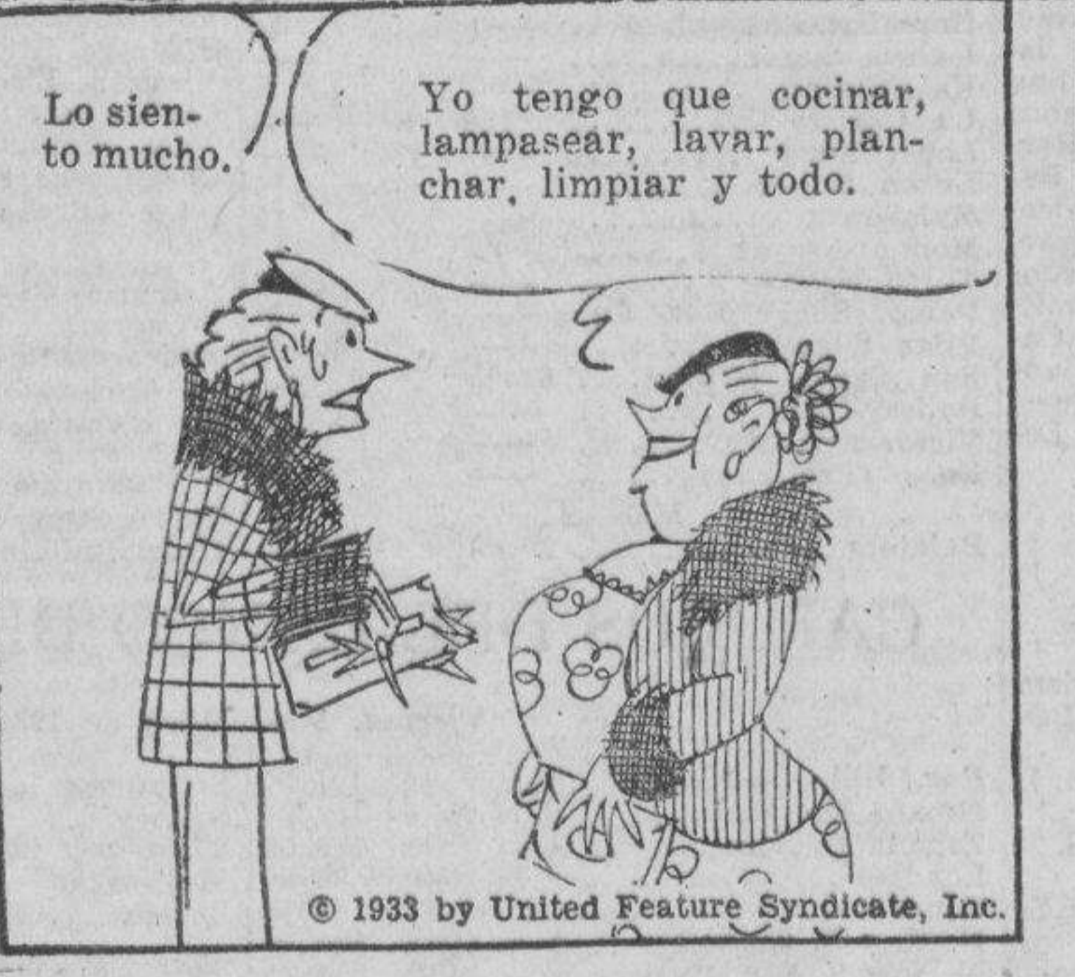
Yo tengo que cocinar, lampasear, lavar, planchar, limpiar y todo. Y Vd. está contenta de ello. Si, toda nube tiene su ribete de plata.