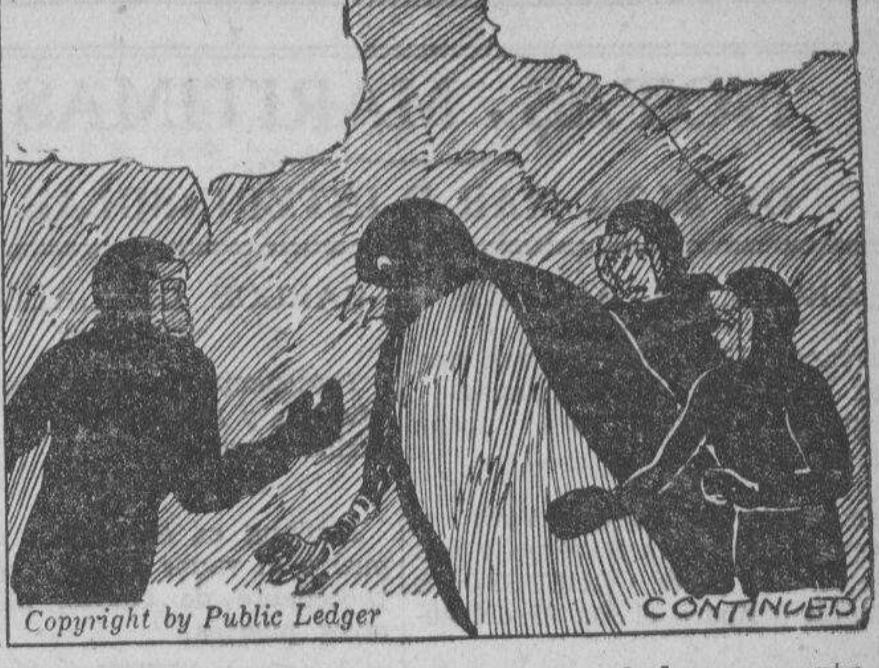
PROFESOR: Puede pensar. Soy capaz de leer su mente. Quiere mostrarse amigable. JIMMY: Preguntele donde estan nuestros camaradas.