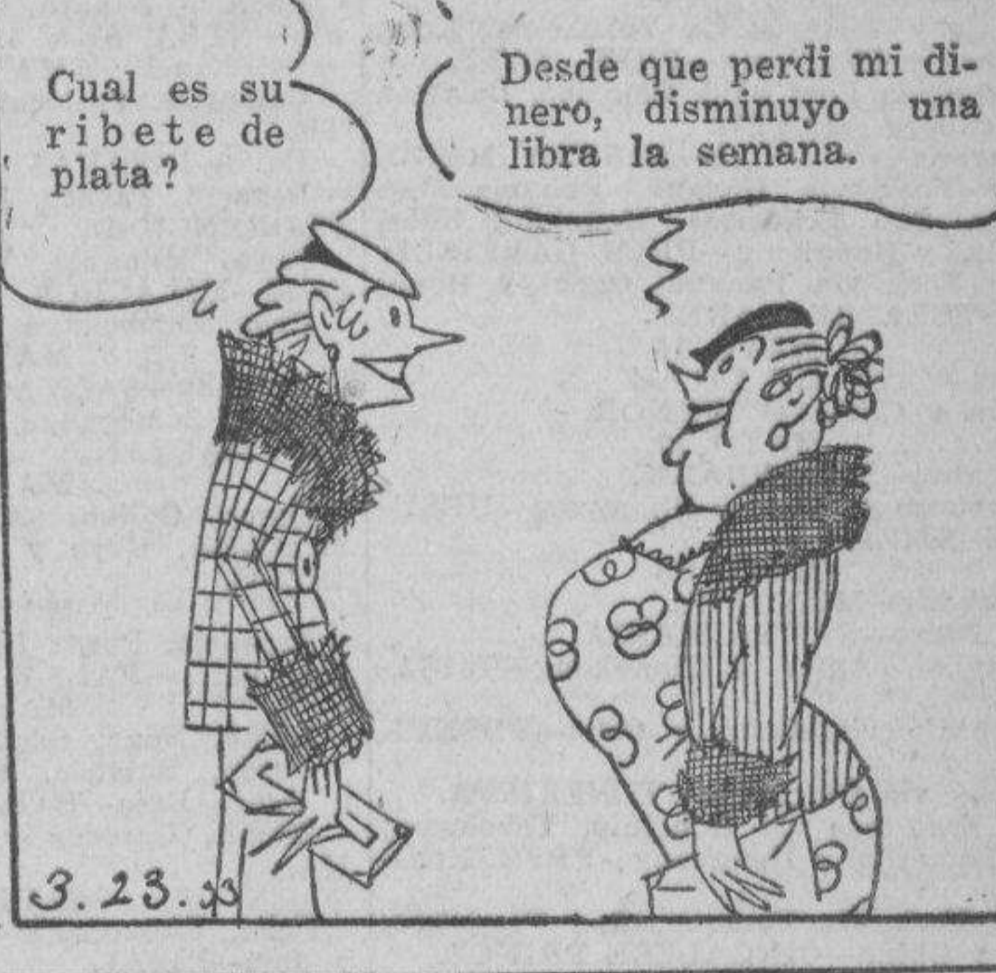
3. 23. 3