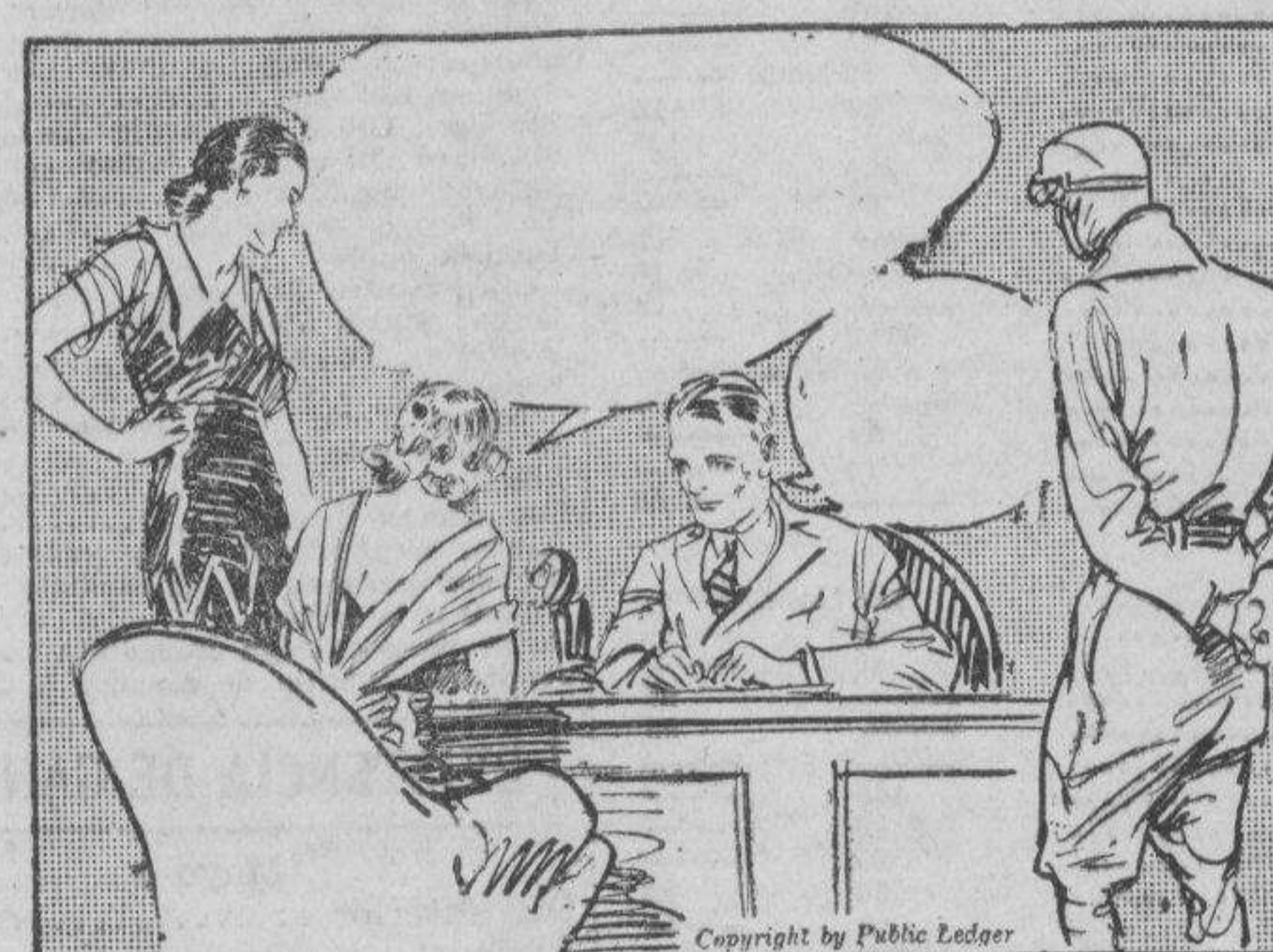
CONNIE: Mr. Wallace, si no tiene inconveniente, antes de que hablemos del informe sobre el caso de Electrus, quisiera telefonar para pedir alguna ropa para Mme. Zurich y para mi. WALLACE: Ya lo creo. Use ese despacho interior, si desea.