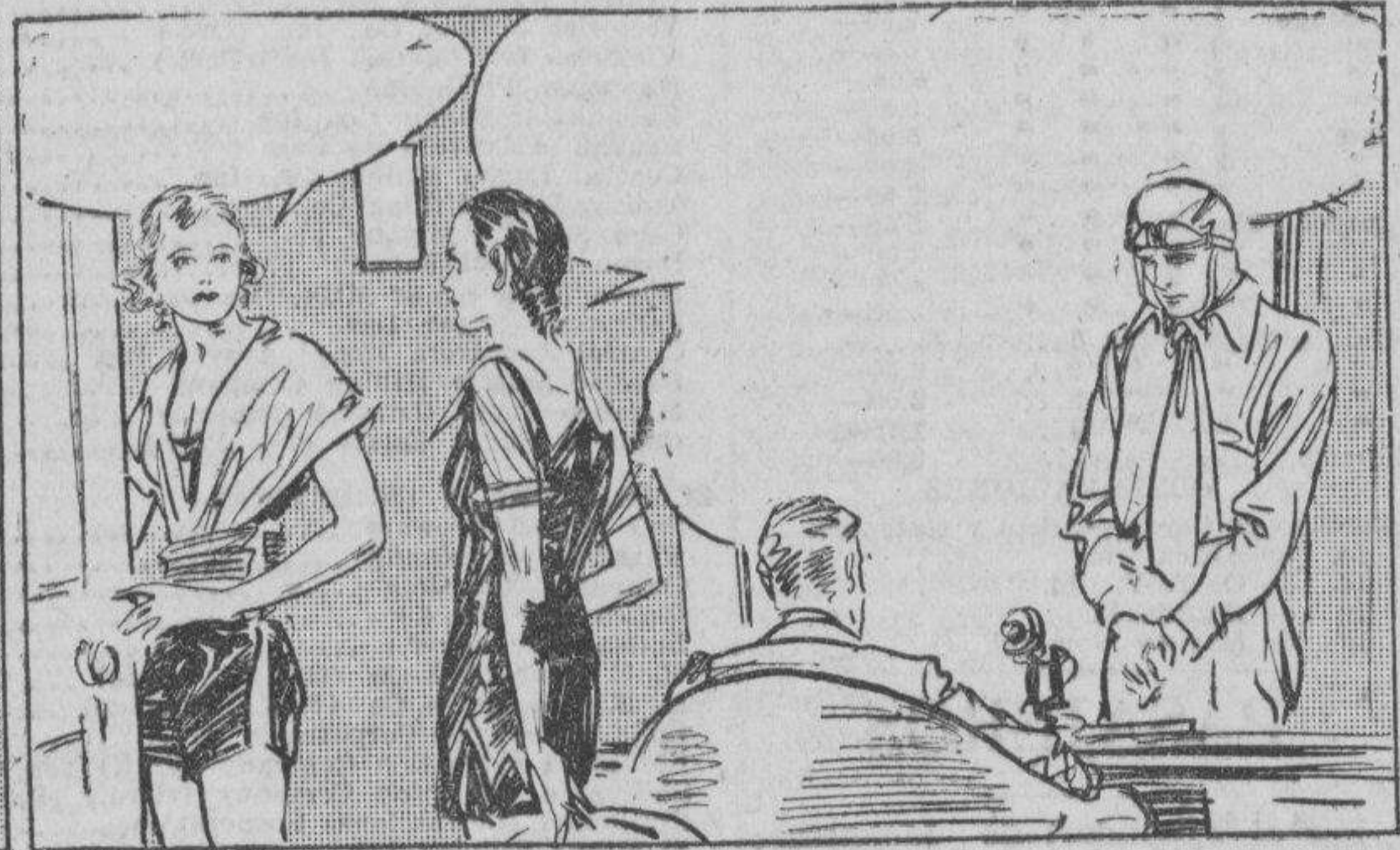
CONNIE: Venga, Mme. Zurich. Tenemos mucho que telefonar. ZURICH: Apenas se como comenzar. He vivido por tanto tiempo en Amperia que desconozco ya todos los estilos. WALLACE: Habia Vd. dicho que tenia un asunto personal de que hablar, Dizzy? DIZZY: Sí, Mr. Wallace. Ahora que esto ha terminado, tengo que decirle algo sobre mi.