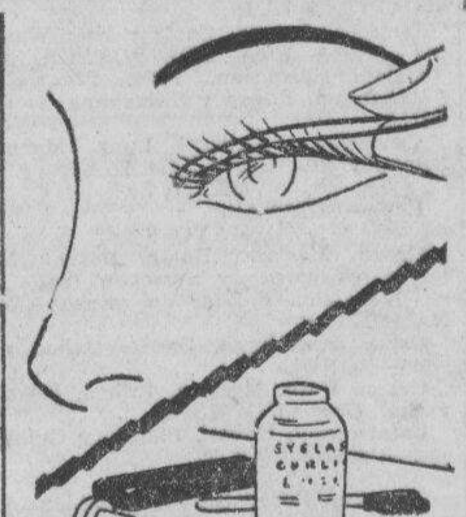
POR V. V.

Vd. no puede de hecho dar un rizo permanente a sus pestañas, pero puede poner en ellas una loción para rizar y hacerlas ondeadas. Es muy sencillo y manteniendo las pestañas rizadas hacia atrás sus ojos aparecerán mas grandes.