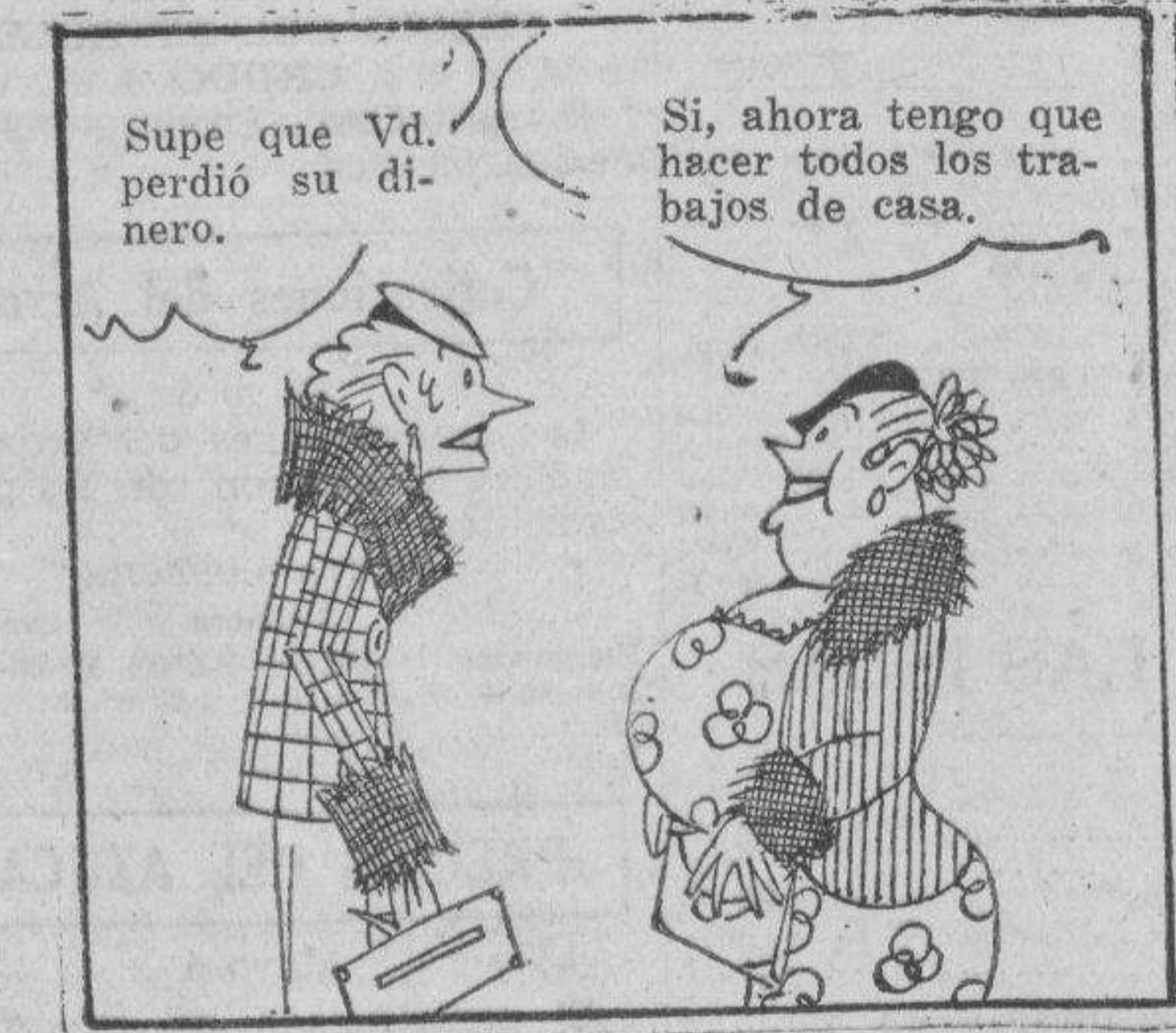
Supe que Vd. perdió su dinero. Si, ahora tengo que hacer todos los trabajos de casa. Lo siento mucho.