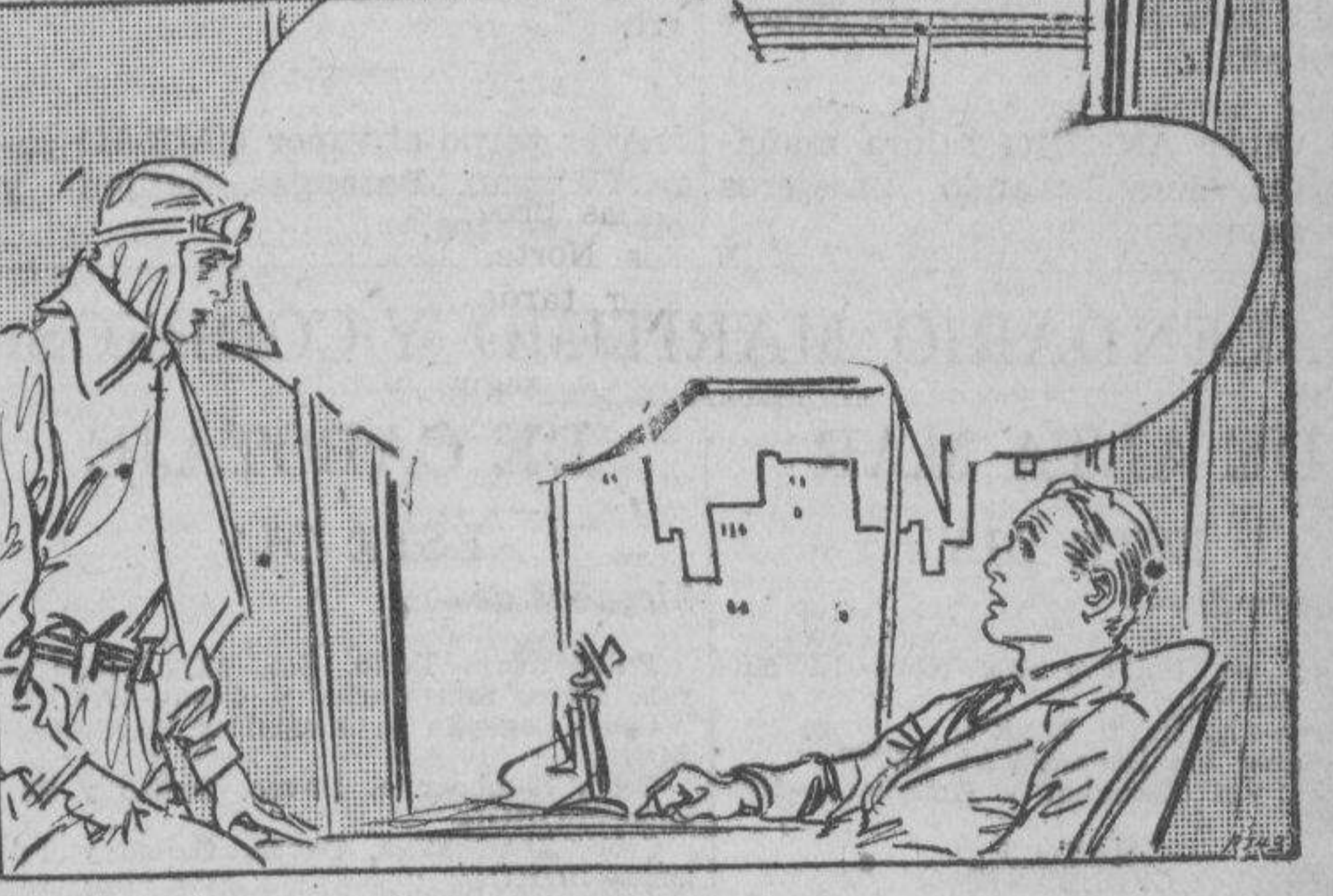
DIZZY: Soy un fugitivo de la justicia, Mr. Wallace. Soy buscado por las autoridades federales por un robo de correspondencia. Es su deber ponerme bajo arresto. WALLACE: Robo de correspondencia? Dizzy. Vd. no está hablando en serio, supongo.