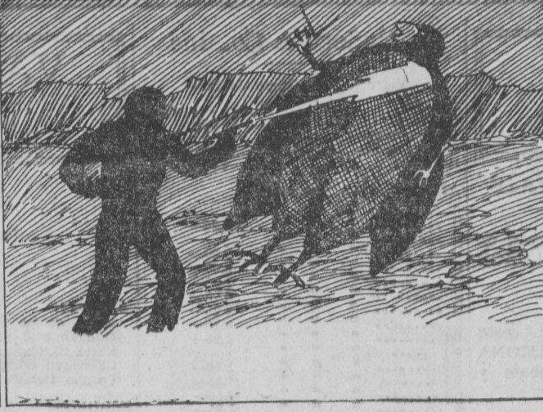
Luego una descarga debil del fusil de Jimmy hace caer al enorme hombre-pájaro.