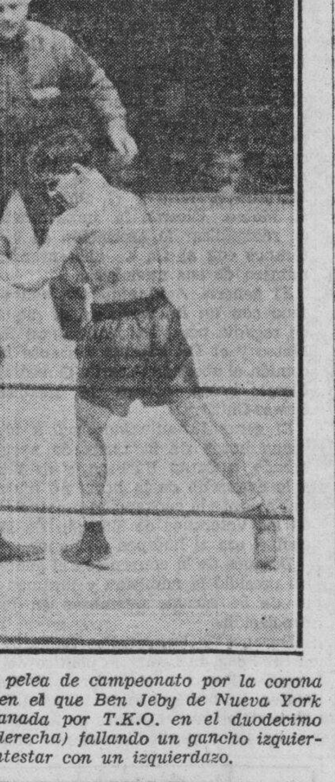
Fotografía tomada durante la pelea de campeonato por la corona de peso middleweight del mundo en el que Ben Jebly de Nueva York derrotó a Frank Battaglia del Canada por T.K.O. en el duodécimo asalto, presenta a Battaglia (a la derecha) fallando un gancho izquierdo mientras Jebly se dispone a contestar con un izquierdo.