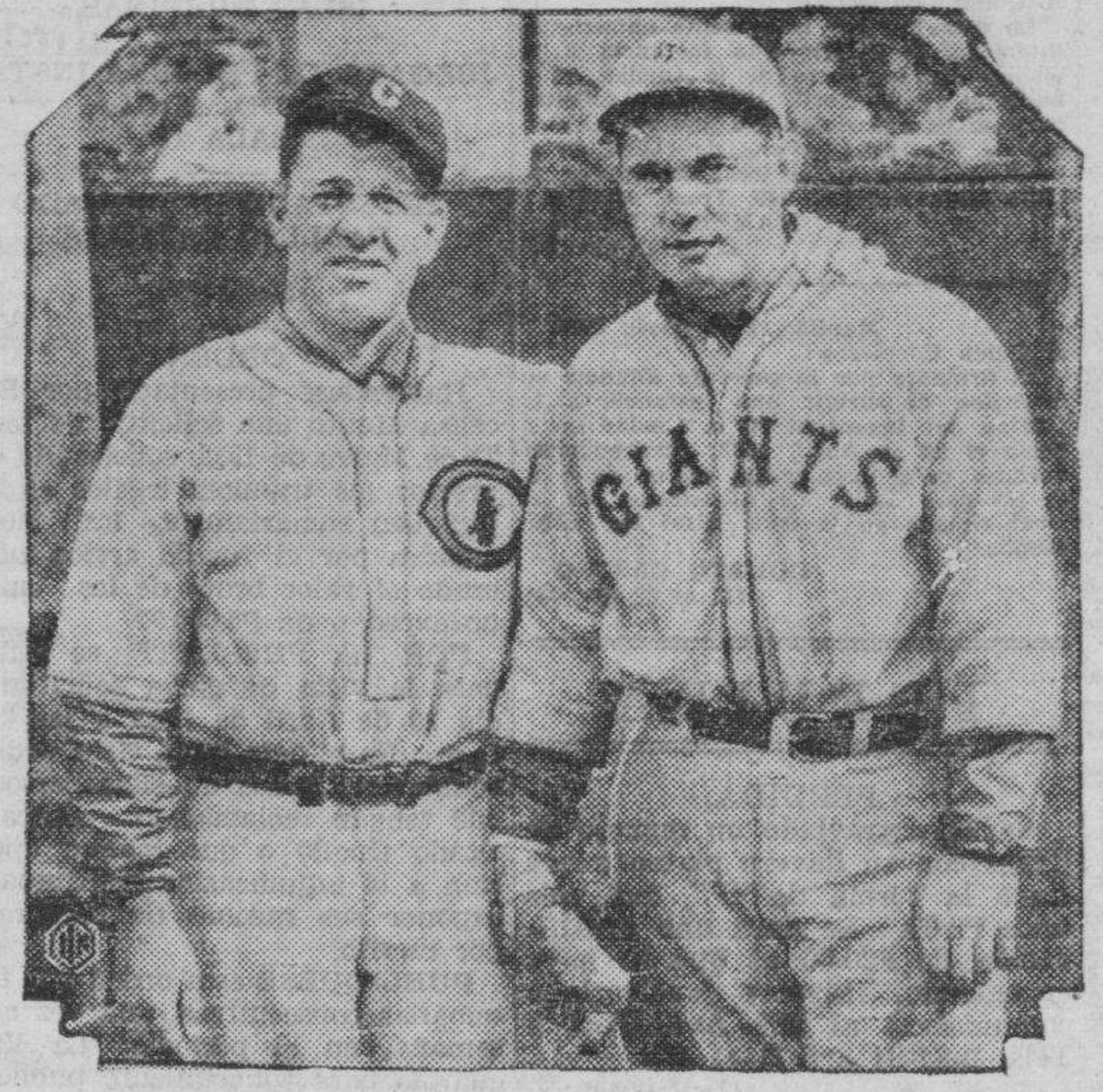
Poco antes de que sus dos equipos se encontraran en el primer partido de baseball de la primavera, Bill Terry (a la derecha) manager de los Gigantes de Nueva York y Charlie Grimm piloto de los Chicago Cubs fotografiados mientras discuten sus probabilidades.