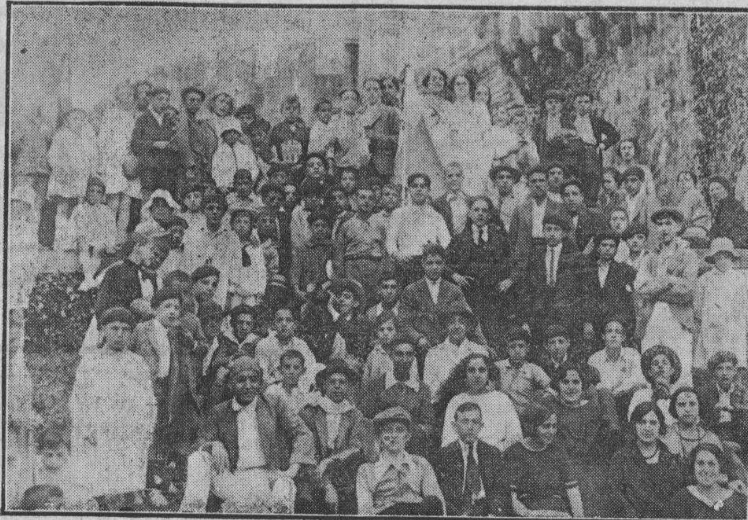
1.—LOS DEL CLUB «KENDU» Y NIÑOS DE LA CIRCUNSCOLAR DE LAS CORTES. 2.—UN GRUPO DE CHICAS MUY GUAPAS DEL CLUB DEPORTIVO DE BARACALDO