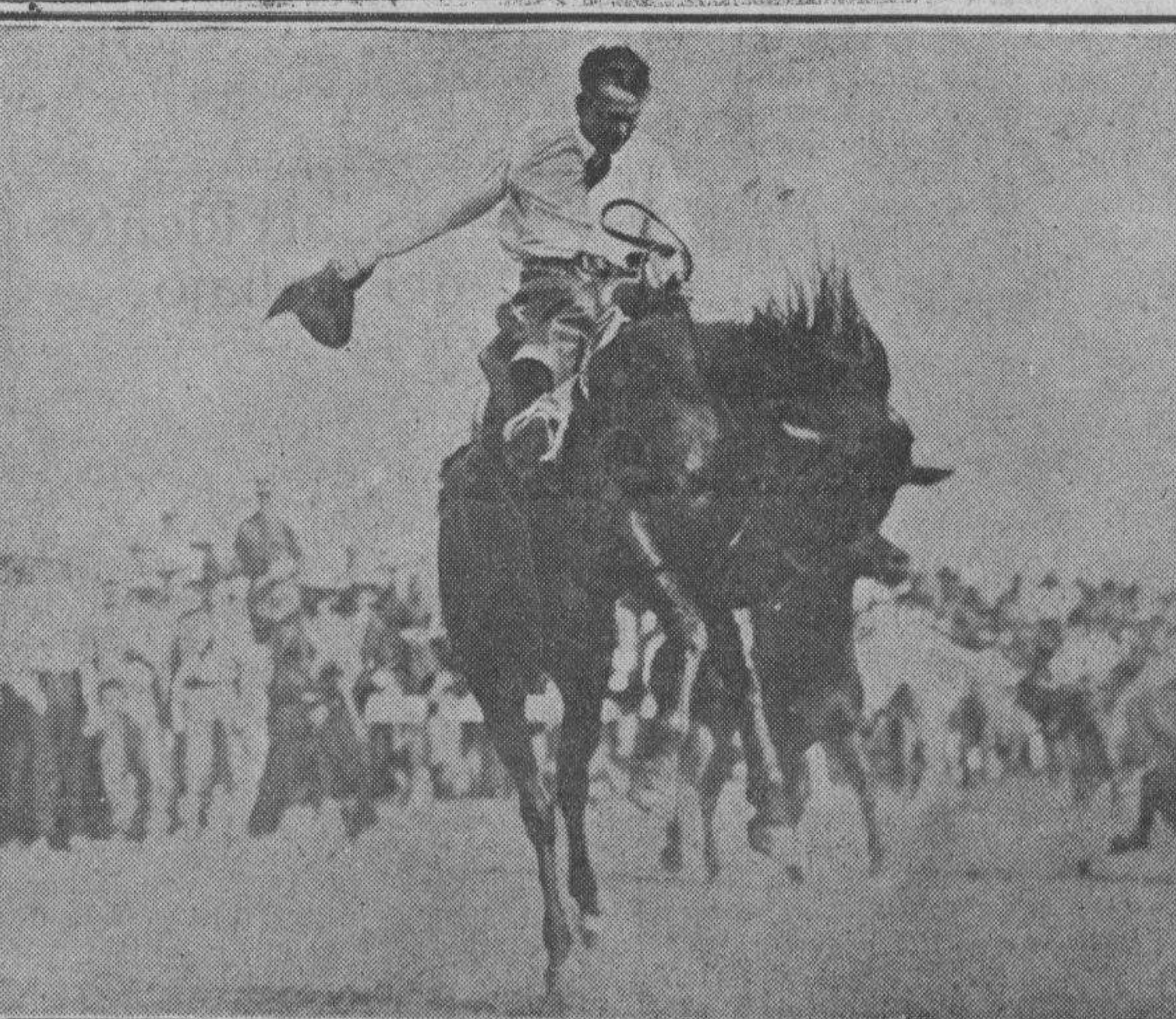
OTRO ASPECTO DE LA FIESTA: UN «DESBRAVADOR».