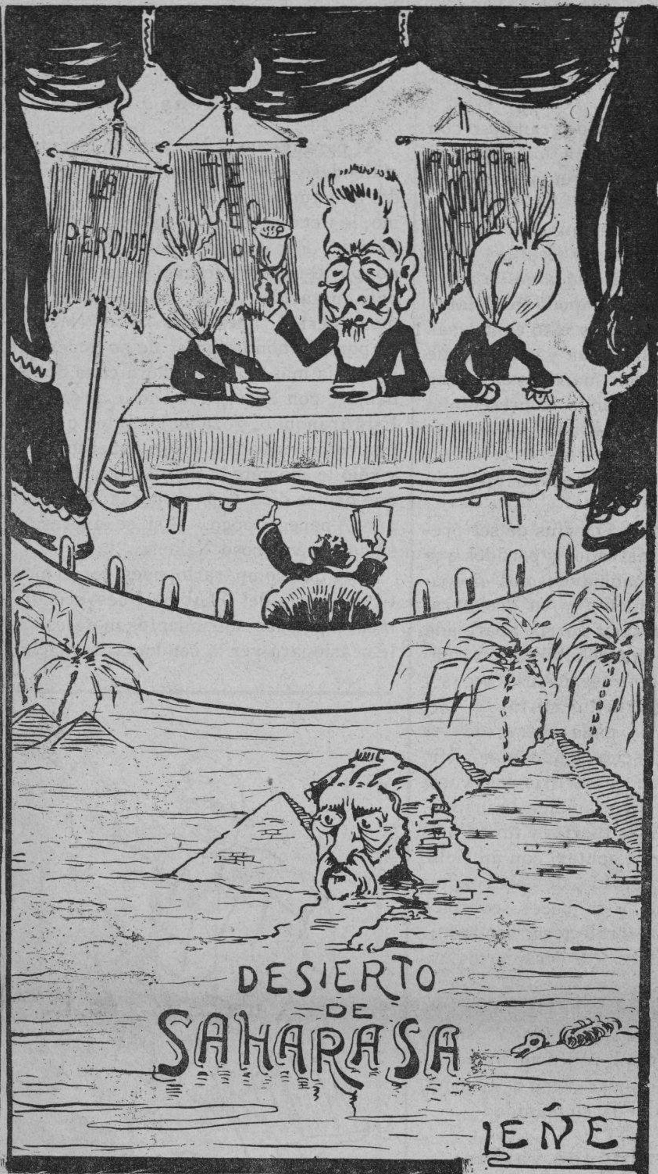
Sin el pueblo que canta la soledad del solidario espanta.

do, voy en unión de la Verdad. Otras campañas he comenzado tan solo como ahora y al fin la Razón y la Verdad vencieron, y los más y los mejores se pusieron á mi lado, aceptaron, defendieron y proclamaron lo por mi propuesto, aunque de mí no se acordasen después; que por muy duro que sea, no me importa que ninguno se acuerde de mí, con tal que nadie olvide sus compromisos y deberes.