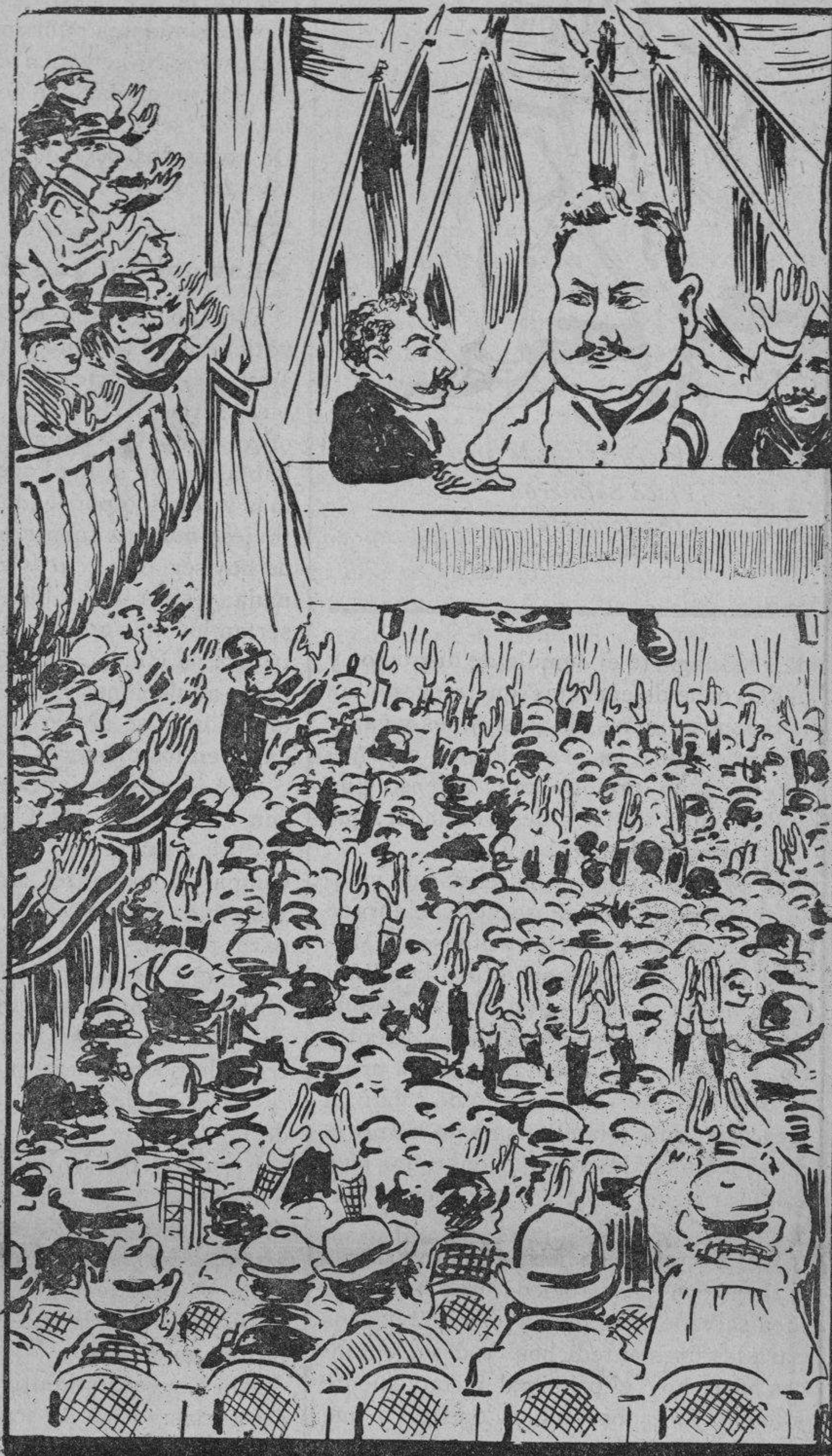
A la voz del caudillo valeroso, marcha el pueblo á la lid más poderoso.