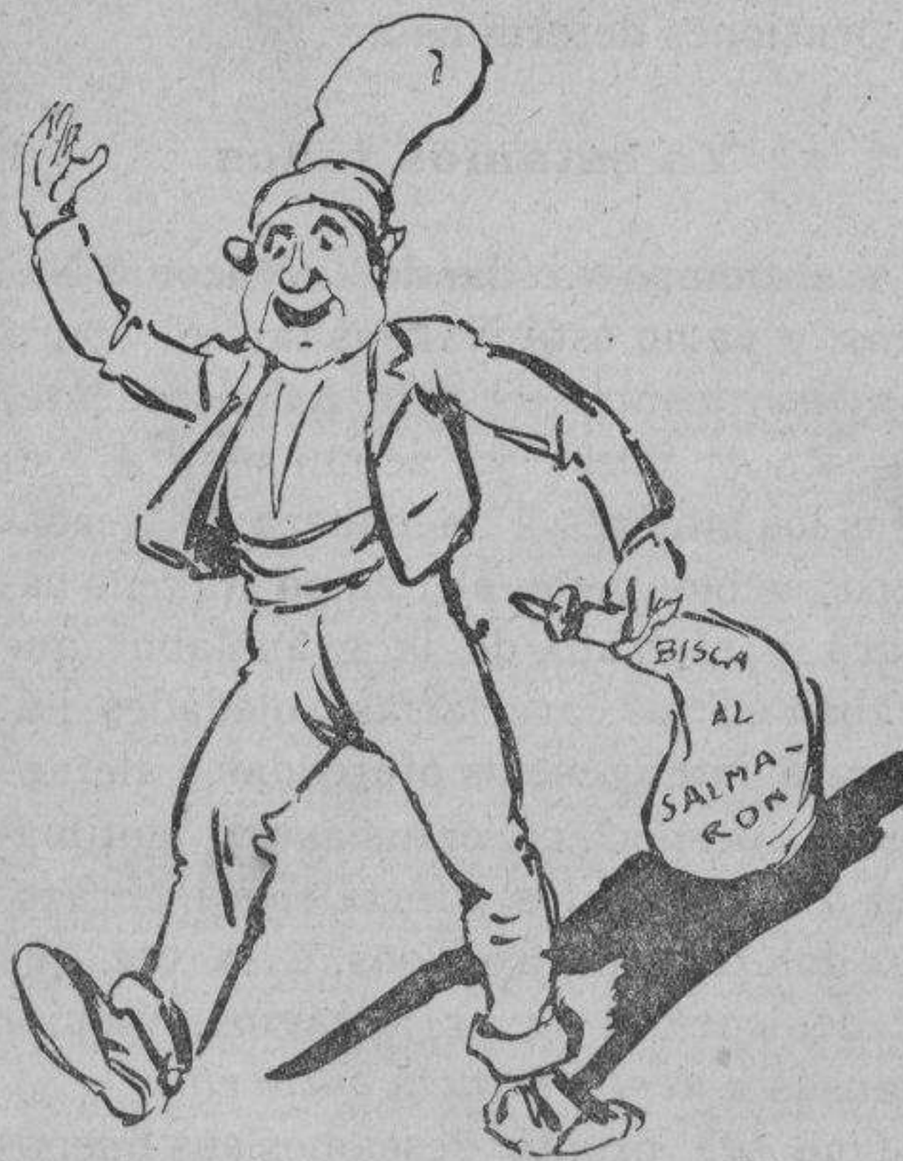
UN PUBLICITARIO.—¡Que viva la pancha! ¡Viva Salmerón! ¡Viva la frescura y venga el turrón!

Con la adhesión de dos ó tres periódicos de provincia comenzó Nakens su ímproba labor hacia 1901, y todavía en visperas de la celebración de la magna Asamblea, cuando ya contaba con la adhesión de cuarenta y un periódicos republicanos y cuarenta y un nombres de los más notables y prestigiosos del partido, todos los cuales hacía publicar á la cabe-