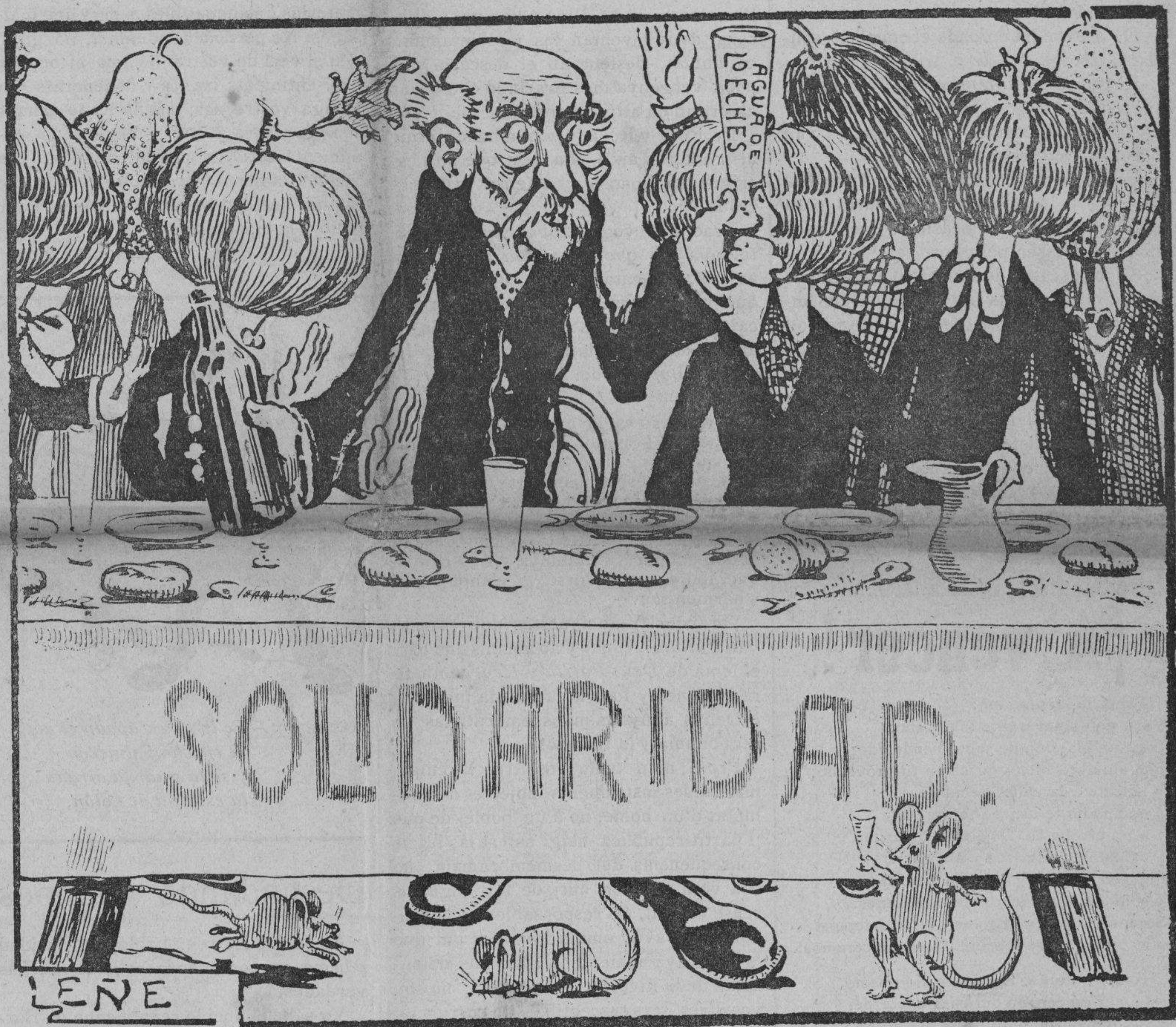
Insignes calabacines de la Solidaridad.