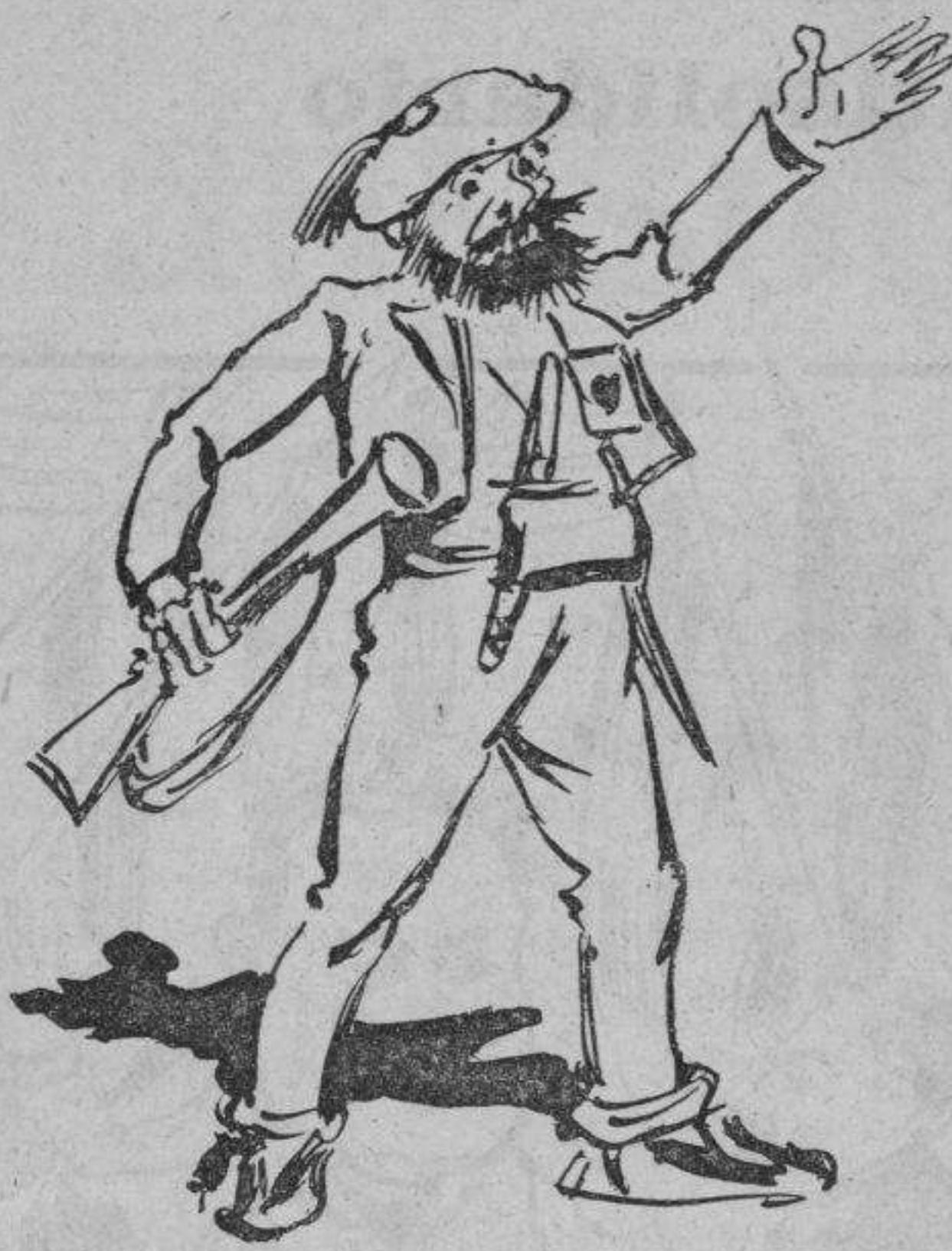
CARCA.—¡Visca Vazquez Mella! ¡Visca Salmerón y la utonomía de la Inquisición!

Hemos afirmado antes que Nakens viene trabajando hace veintitantos años en pro de la unión de los republicanos, porque la Asamblea magna de 25 de marzo