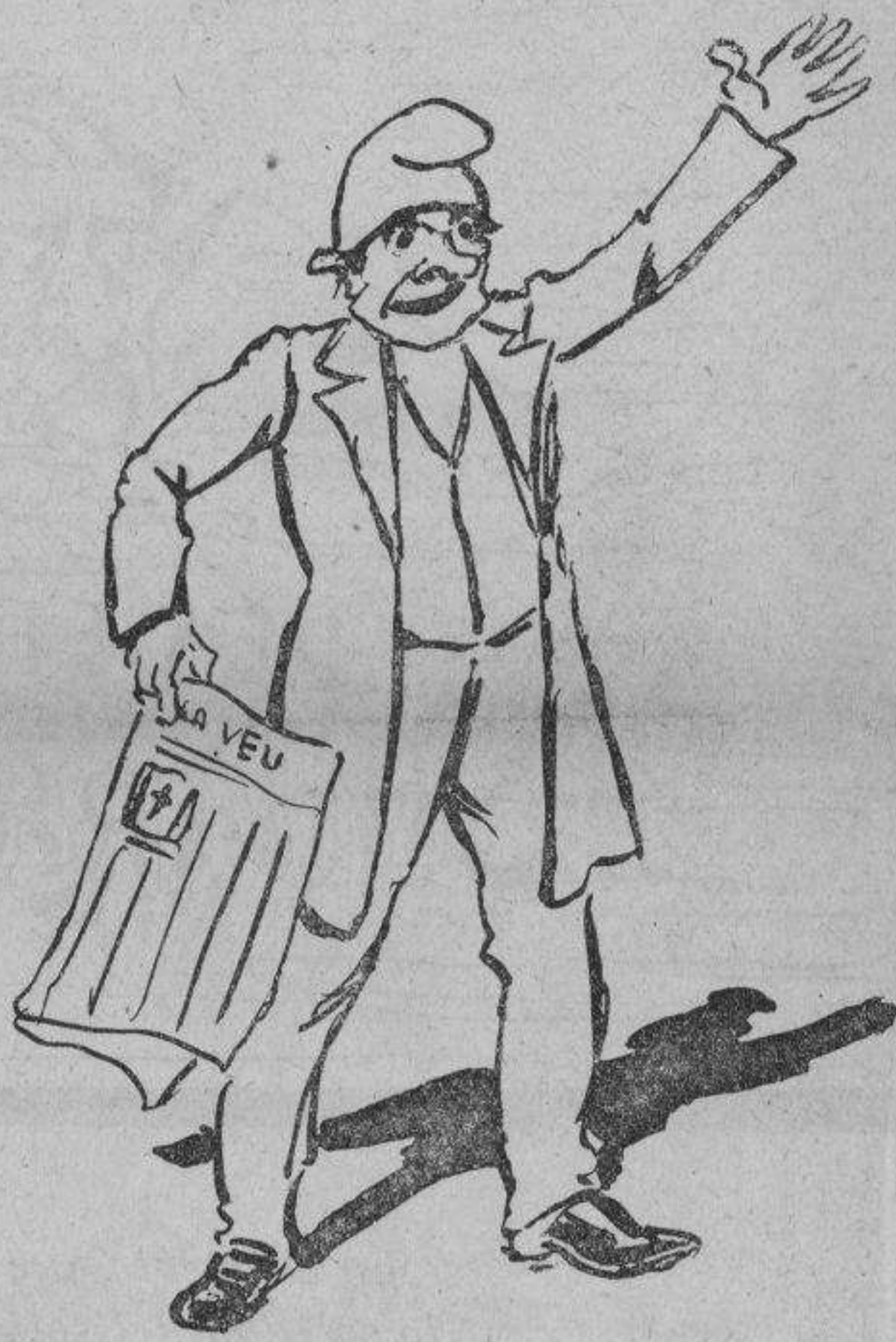
¡CU CUT!—Visca Catalunya Visca en Salmelón. ¡Era castellana! Visca Rosinyol!

¿Por qué compararlo, pues, con el mártir de la Isla del Diablo? Pues sencillamente por los sufrimientos morales que le ocasionará ver la conducta de muchos