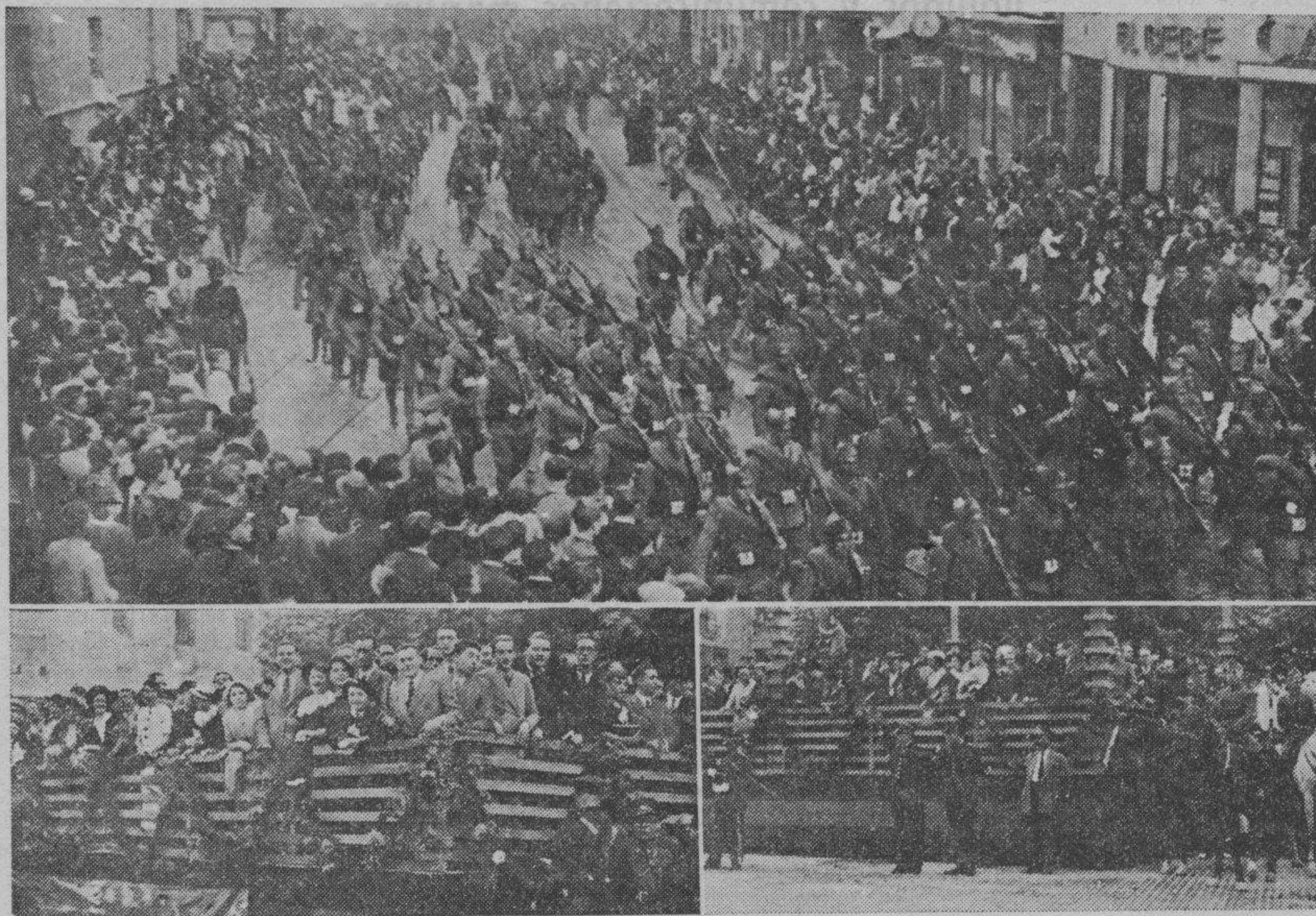
Desfile de las tropas, que fueron aclamadas entusiastamente por el público.—Vista de las tribunas

El desfile militar fué un acontecimiento en el que tomó parte la masa popular, con manifestaciones de afecto a las tropas.—Iluminación general.—En espera de varias inauguraciones; hoy, la de la Feria de Muestras.