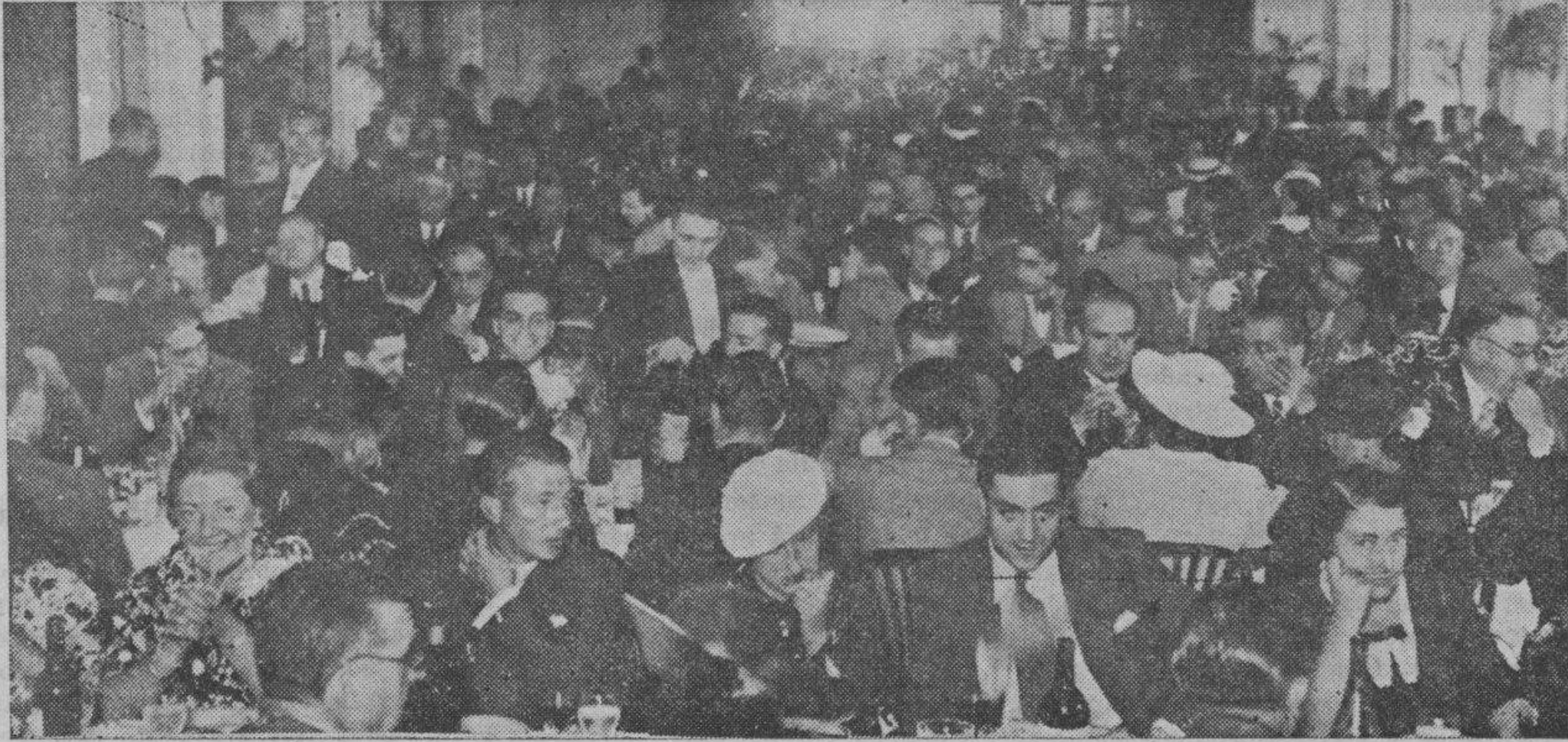
Almuerzo dado en el Gran Hotel en honor de los doctores concurrentes al I Congreso Español Pro Médico

establecer una asignatura al final de la misma.