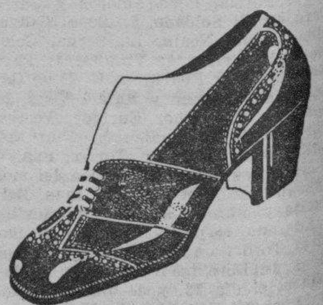
Art. 16.028 taflete negro ptas. 20 Art. 10.325 en taflete marrón ..... ptas. 18 Art. 11.547 en ante negro ptas. 35 Artículo 210.508 en camello marrón, puntera cocodrilo ..... ptas. 18'50 Artículo 210.902 en potro marrón, con centros de pala y talonera en gamo beig.... ptas. 20 " 16.338 taflete azul " 23'50 " 10.225 charol negro " 18 " 11.525 en ante marrón " 35 " 16.528 ante marrón " 24 " 11.537 en ante azul " 35 " 16.548 ante negro " 24 Los mismos modelos en medio tacón " 11.507 en ante negro, medio tacón ... " 35