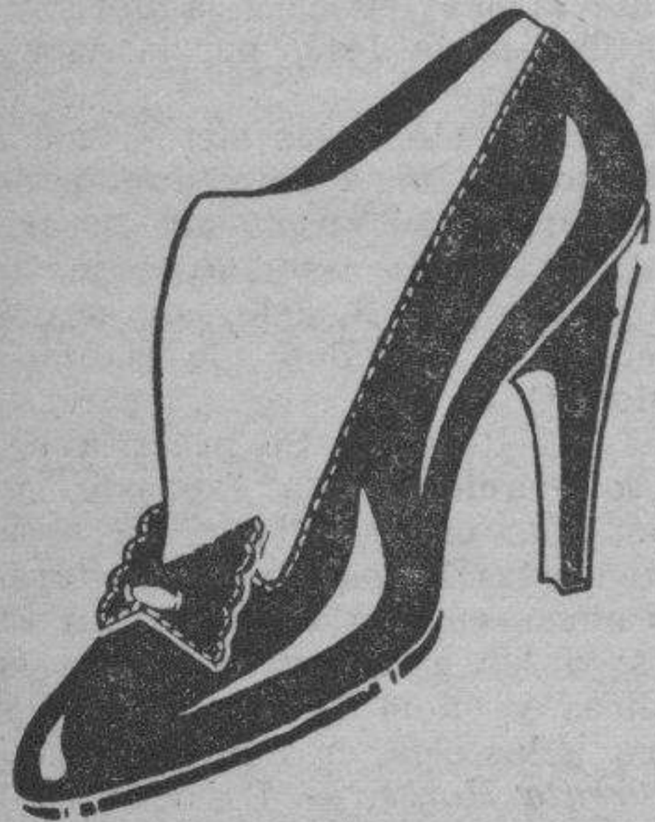
Art. 16229 en charol neg. ptas. 21'50 " 16029 en taflete neg. " 23'50 " 16339 en taflete azul " 23'50