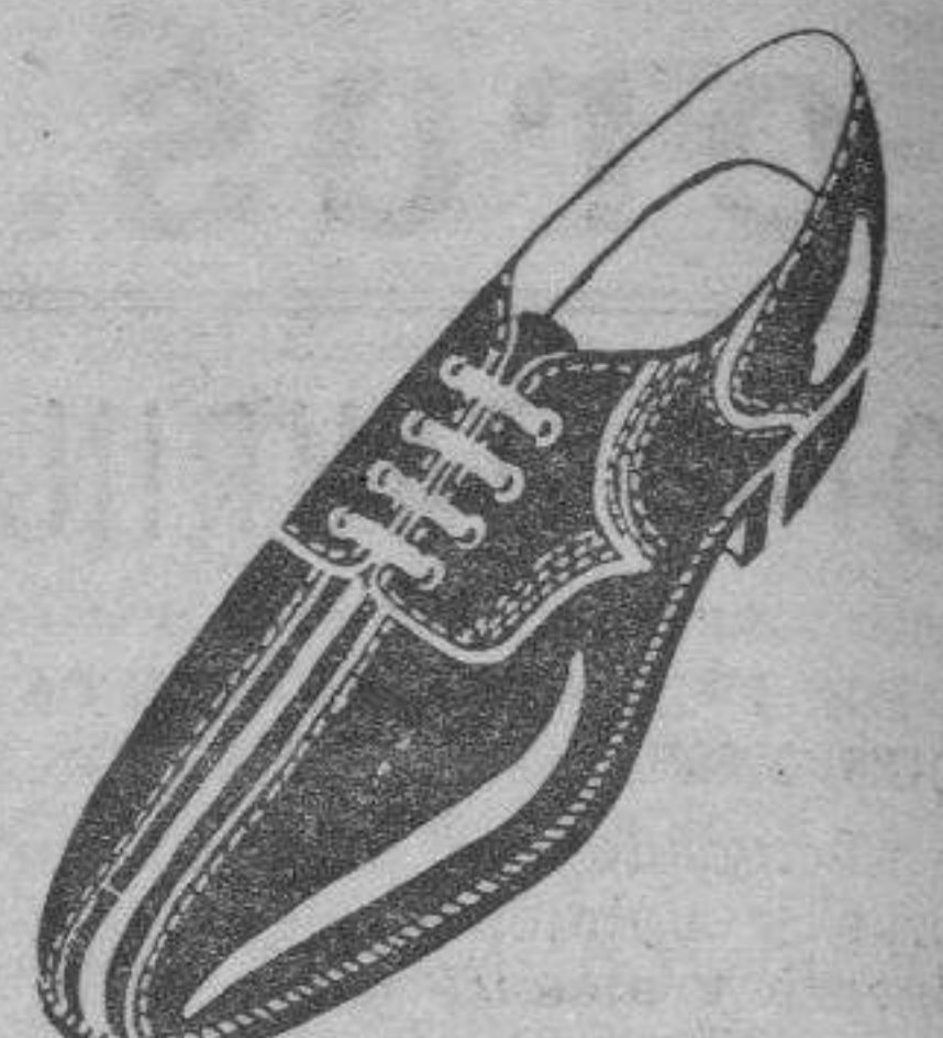
Art. 101 en box-calf negro ptas. 20 Art. 3101 en box-calf negro ptas. 24 Art. 113 en box-calf negro ptas. 25 Art. 3103 en box-calf negro ptas. 25 Art. 4125 en box-calf negro 28'50 " 401 " color " 20 " 3401 " color " 24 " 414 " color " 25 " 3403 " color " 25 " 4425 " color 28