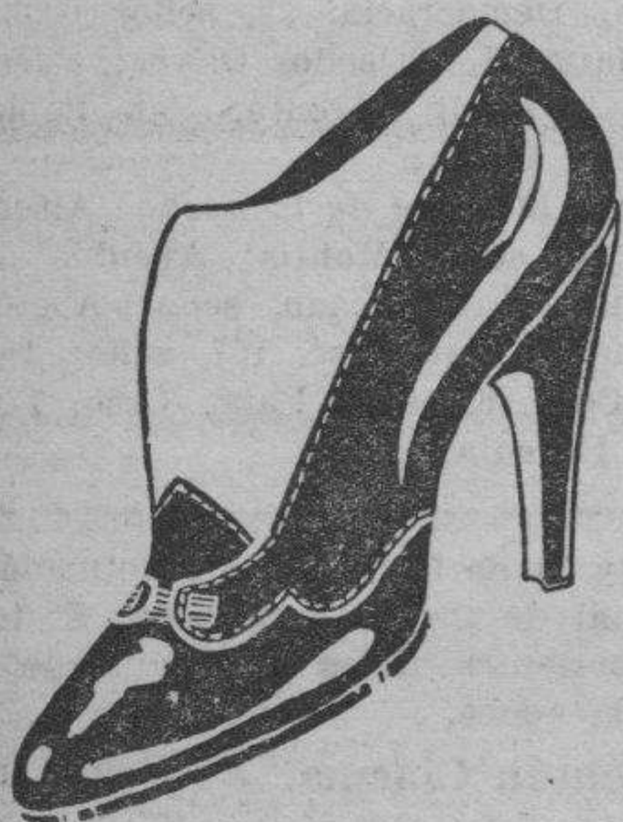
Artículo 17.942 pala lagarto gris, talonera charol negro ..... ptas. 30 Artículo 17.925 pala serpiente - mate gris, talonera taflete azul ..... ptas. 32'50 Artículo 17.926 pala serpiente - mate beig, talonera ante marrón ..... ptas. 32'50 Los mismos modelos en medio tacón