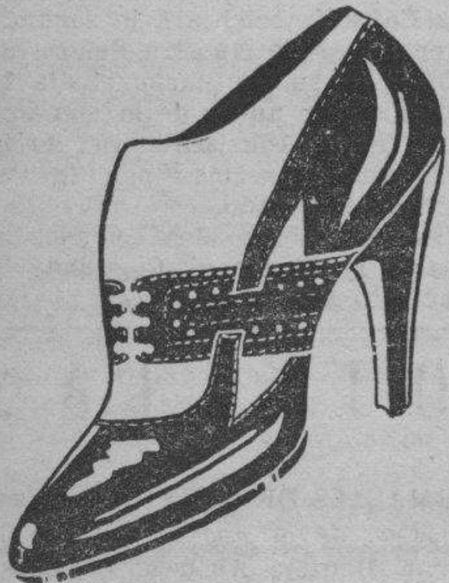
Art. 13.234 charol negro aplicaciones ante ptas. 16'50 Art. 13.214 igual modelo en medio tacón " 16'50