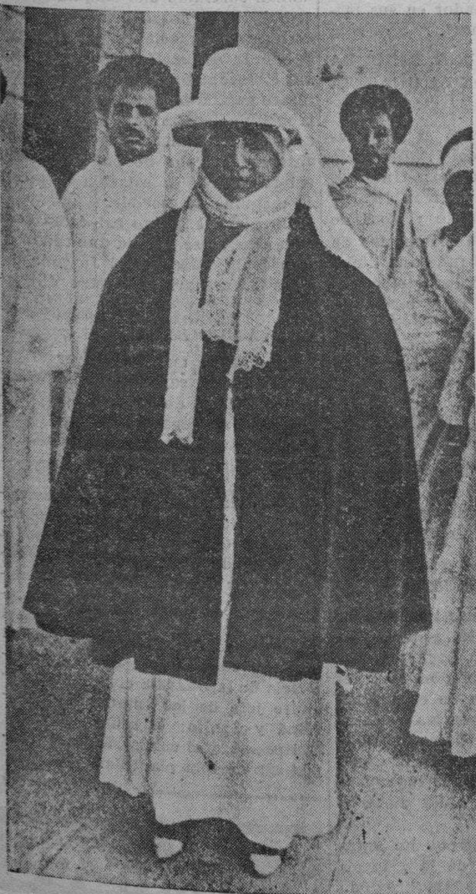
La emperatriz de Abisinia, a su salida de un templo en el que se elevaron preces al Todopoderoso en favor de la paz