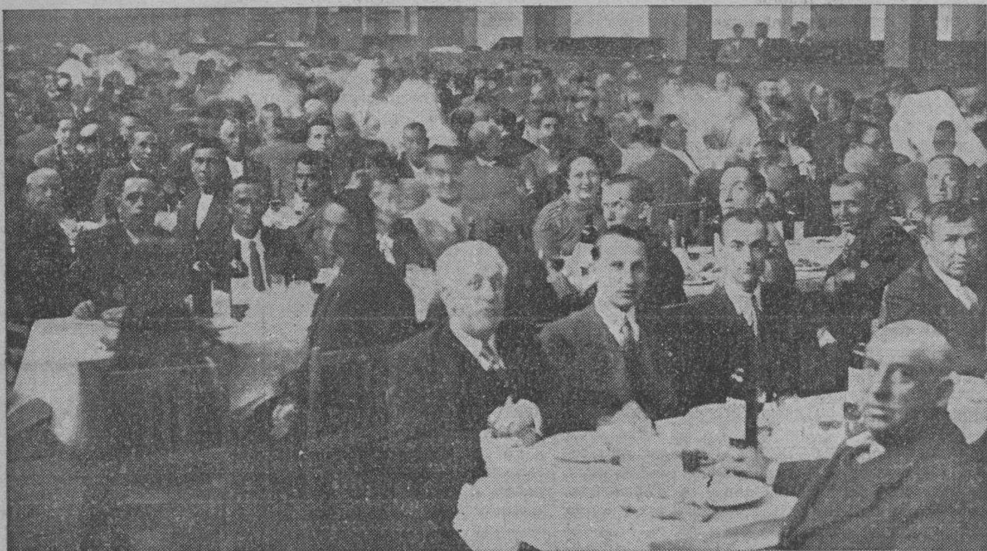
Un aspecto del Frontón Aragonés durante el banquete-homenaje que los alcaldes de la provincia dedicaron al gobernador civil, señor Otero Mirelis.

La sala de espectáculos del Frontón Aragonés se hallaba desde la una de la tarde del domingo repleta de público que se asociaba al homenaje que, en nombre de los alcaldes de la provincia de Zaragoza, habían organizado los de la capital, Cariñena y Tauste y que se iba a ofrendar al gobernador civil, señor Otero Mirelis. Pasaban de mil los concurrentes al acto, consistente en un banquete y en la entrega de un álbum con numerosas firmas.