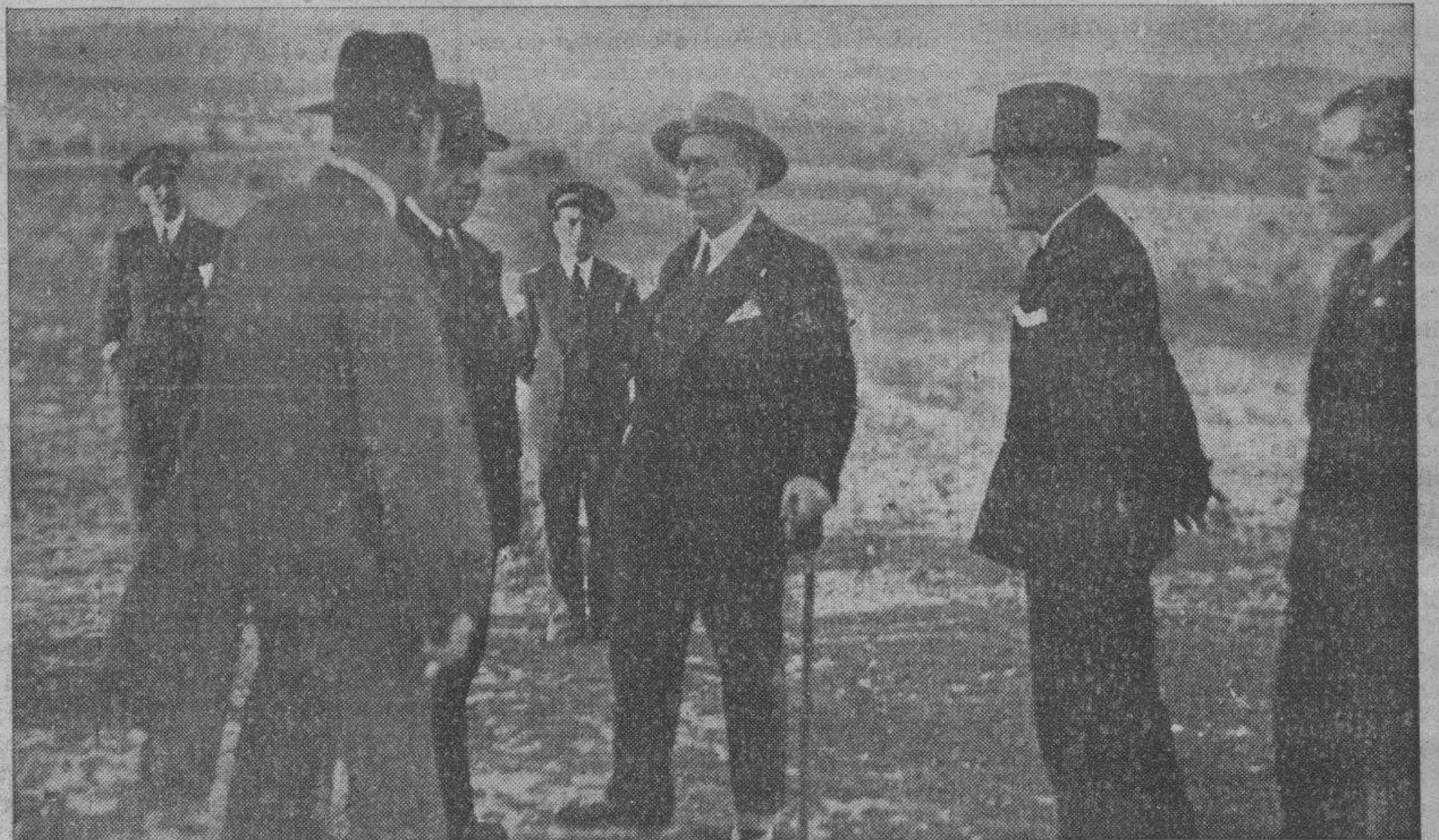
El señor Lerroux, con el señor Rocha, ayudantes y periodistas, durante el paseo campestre del domingo, una hora antes de comenzar sus gestiones para formar Gobierno.