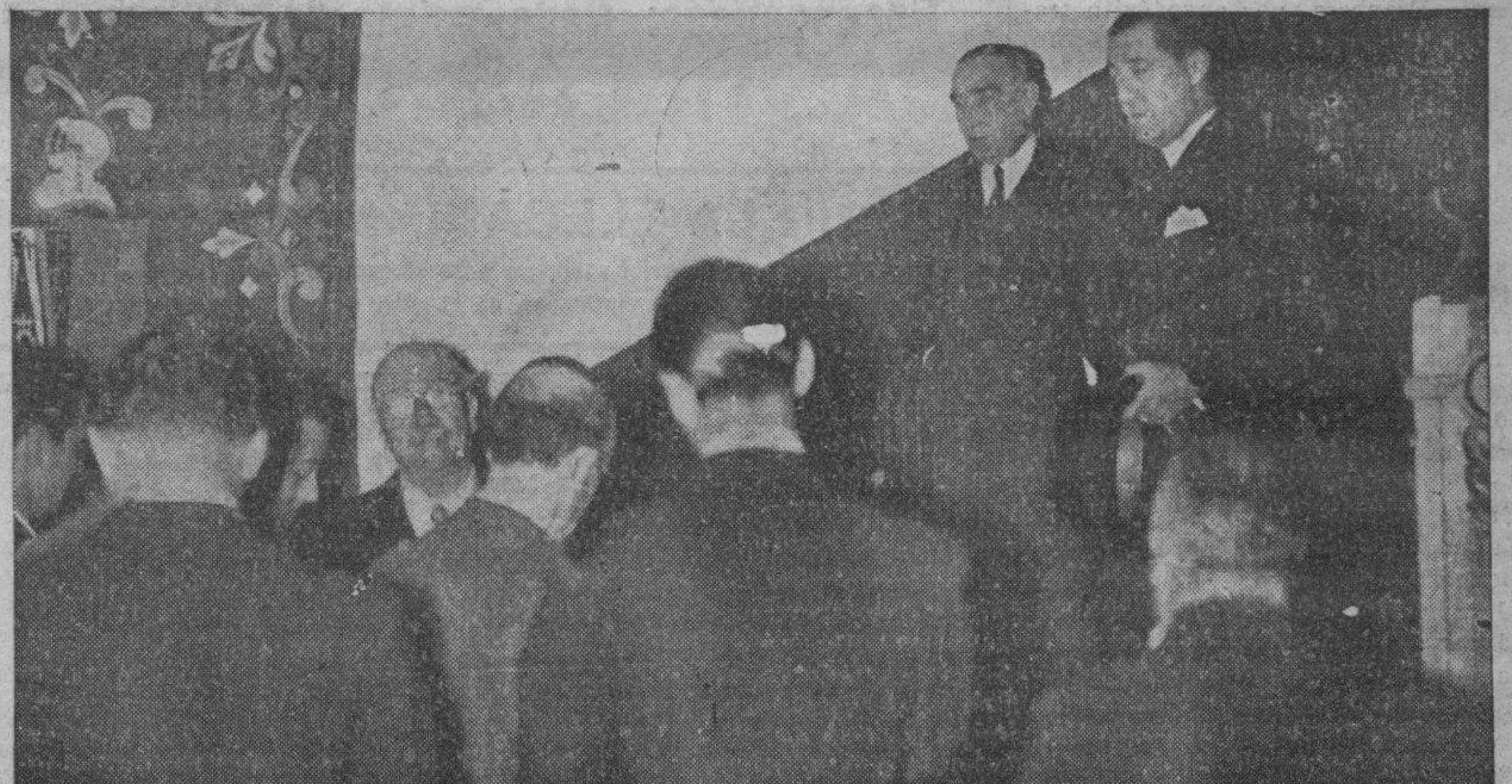
Don Alejandro Lerroux en su visita al señor Martínez de Velasco para rogarle le diera ministros para formar Gabinete.