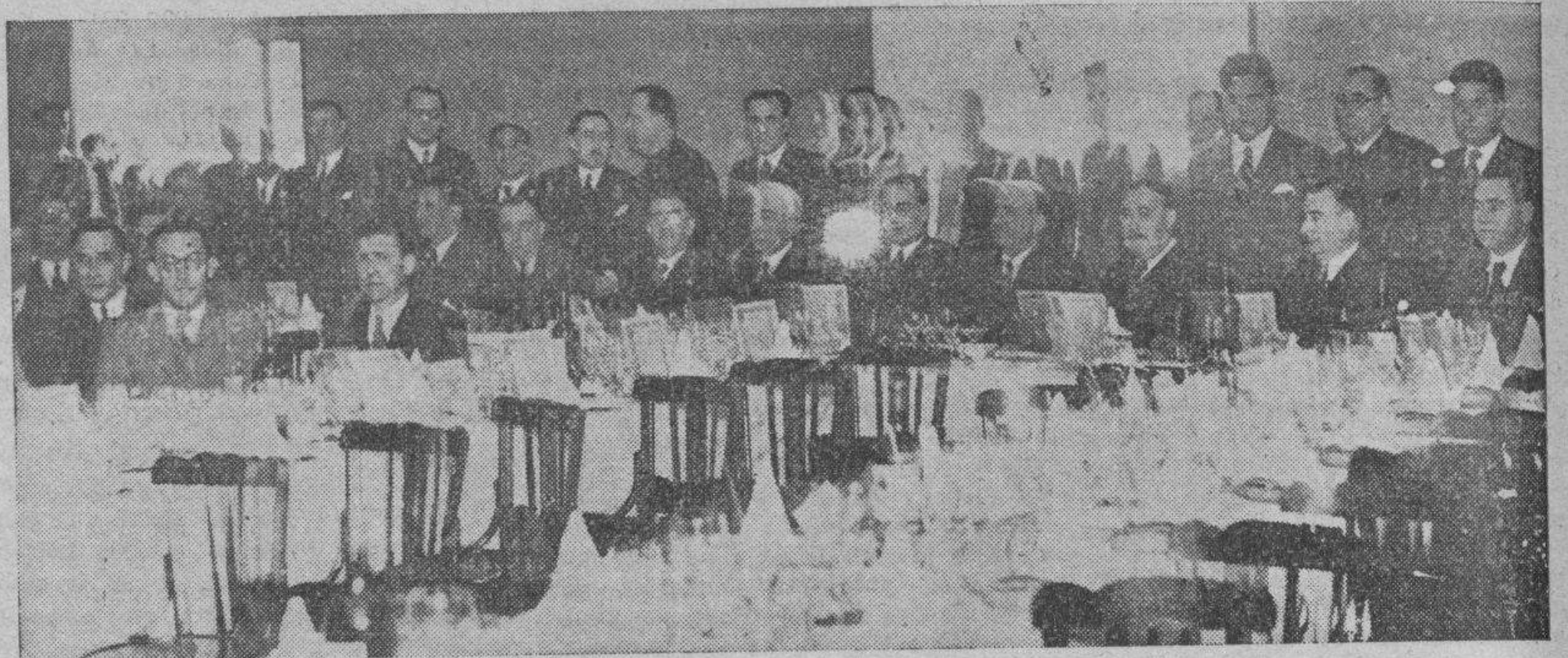
Concurrentes al banquete que la Federación Patronal de gráficos dedicó, con todo merecimientos, a los fundadores de la "Revista de Artes Gráficas", acto que tuvo extraordinaria brillantez.