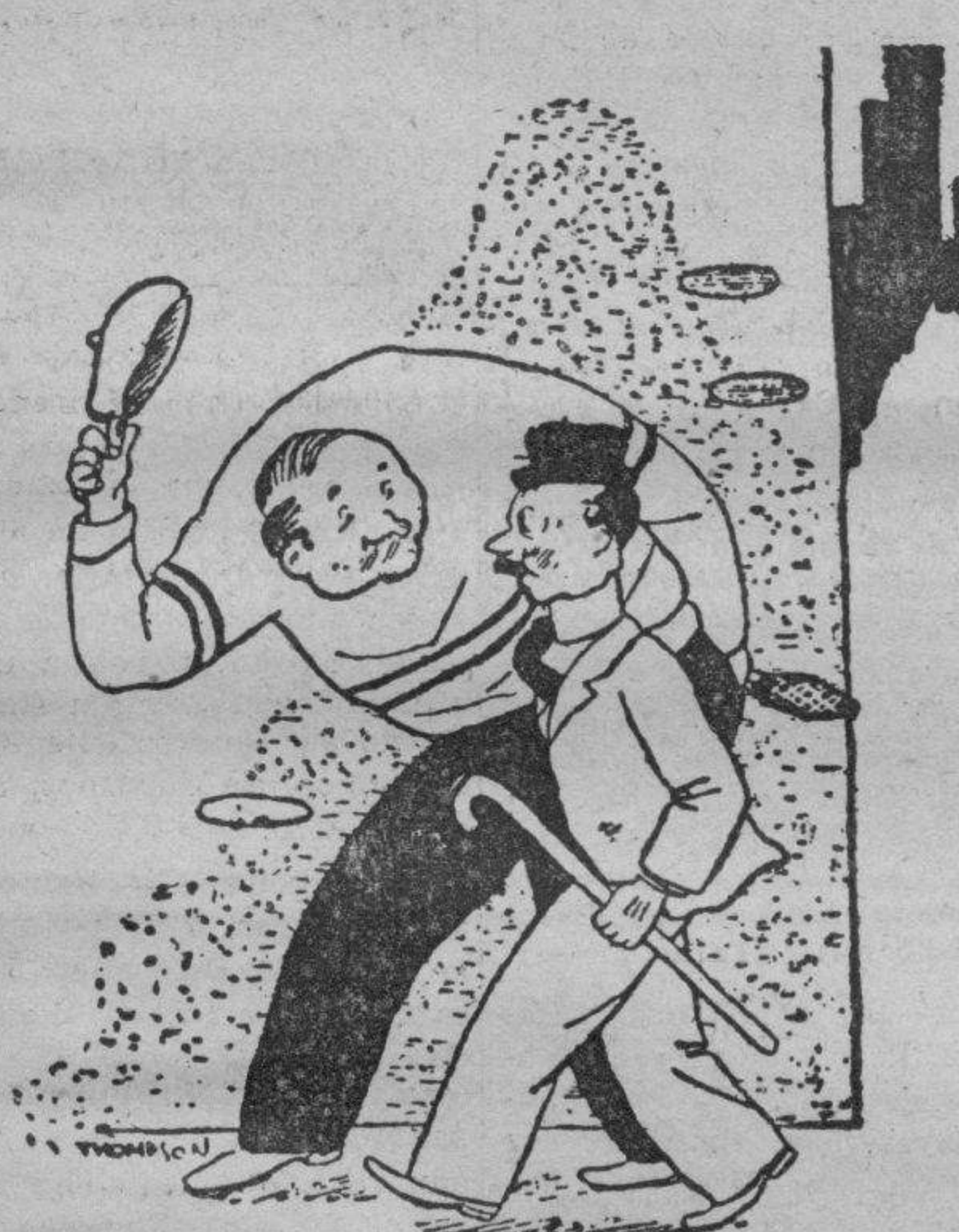
LOS RANDAS MODERNOS Perdón, señor, ¿me haría el favor de la cartera? (Columbia Gester)

La noticia ha causado excelente impresión entre los aficionados y según tenemos entendido dicha Comisión tiene el propósito de aceptar el ofrecimiento. — CANO.