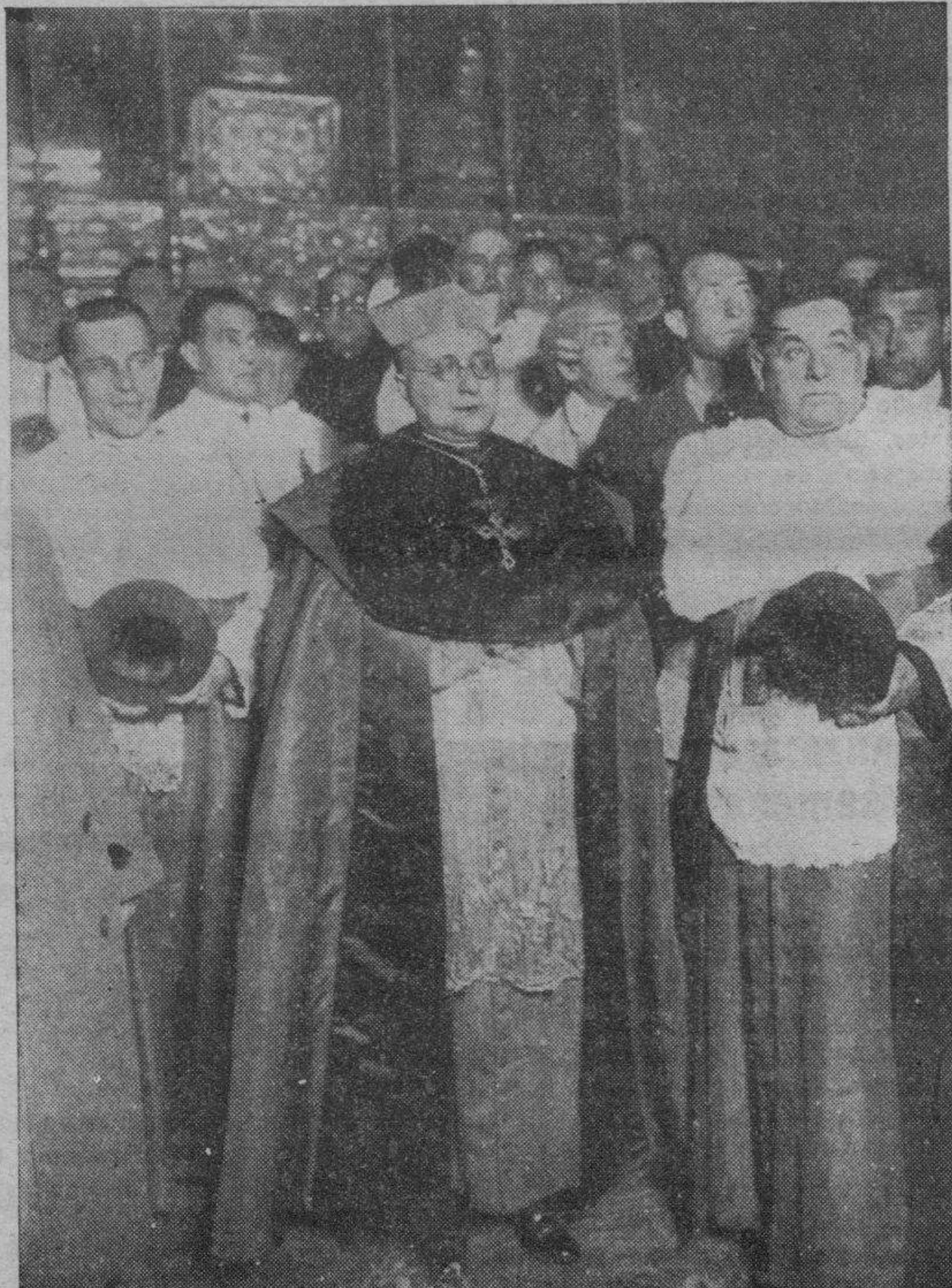
El ilustre obispo de Huesca, monseñor Ruesca, al tomar posesión de su diócesis.

En virtud de la precedente disposición queda incorporado el campo de aviación de Zaragoza al régimen general de los aeródromos de importancia de la Península.