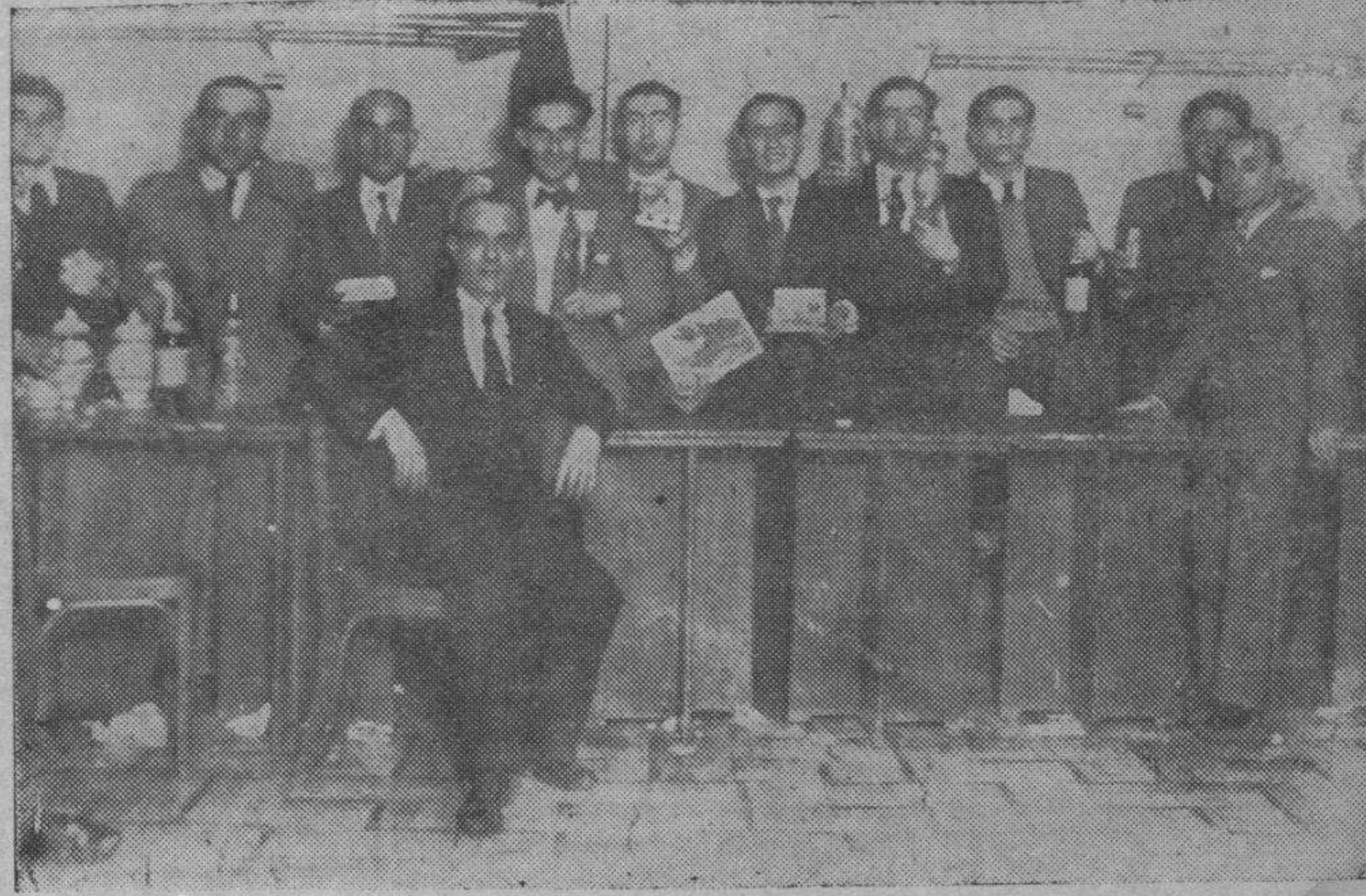
Los vencedores del campeonato de billar ruso-americano, celebrado en el MIAMI.