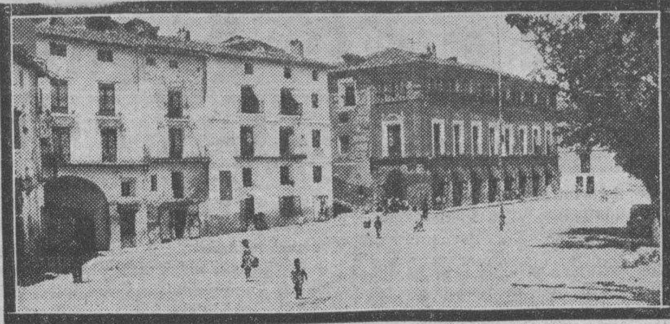
ATECA. — Plaza amplia, señorial. Plaza con arcos de piedra. Plaza remansada que brinda un descanso antes de comenzar la conquista de sus pinas callejas confluyentes.