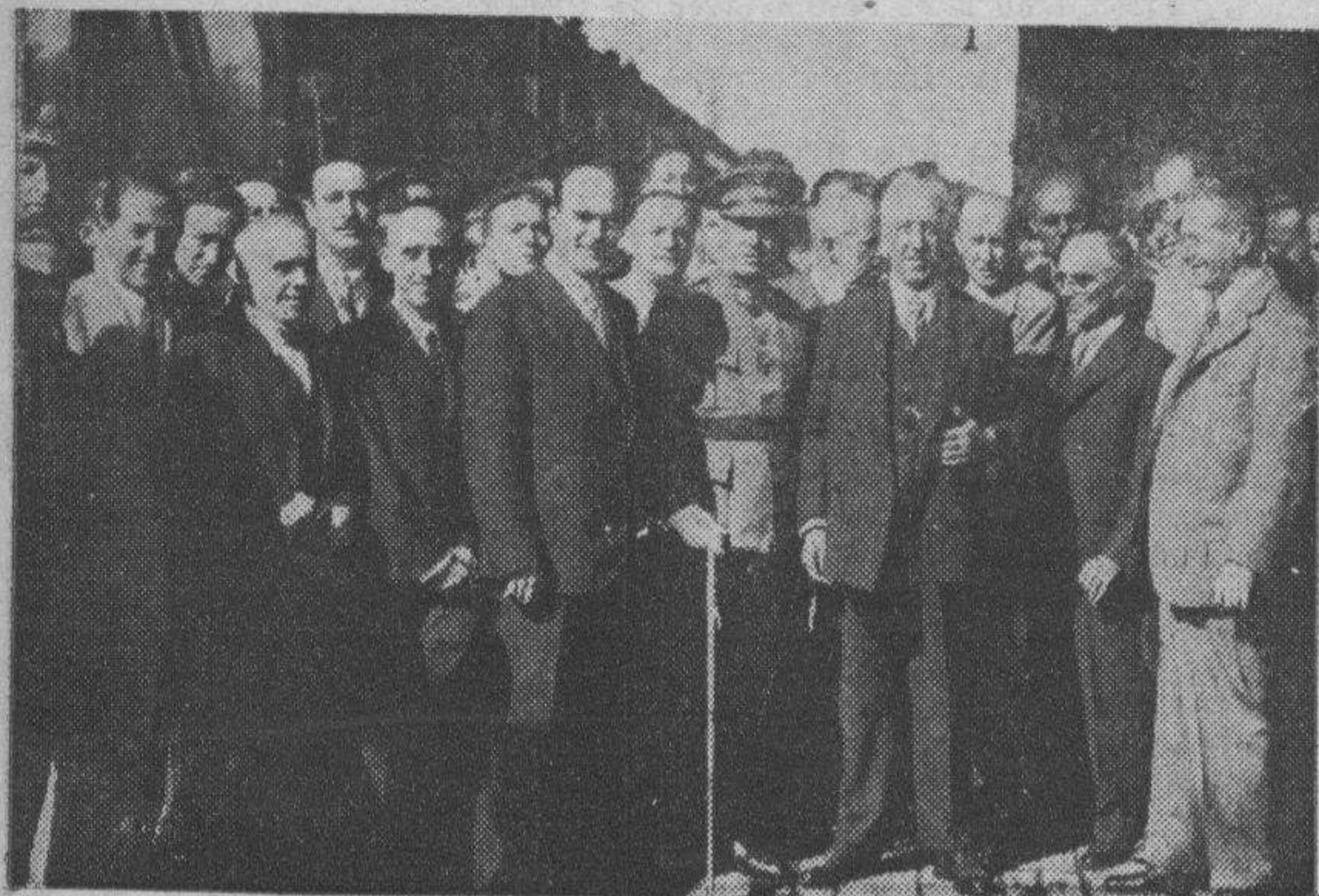
El señor Alcalá Zamora, rodeado de las autoridades, en la estación del Norte.

Celebramos este éxito inicial que tan bien dice de las posibilidades de la economía aragonesa y del entusiasmo e interés que han puesto en la obra los organizadores.