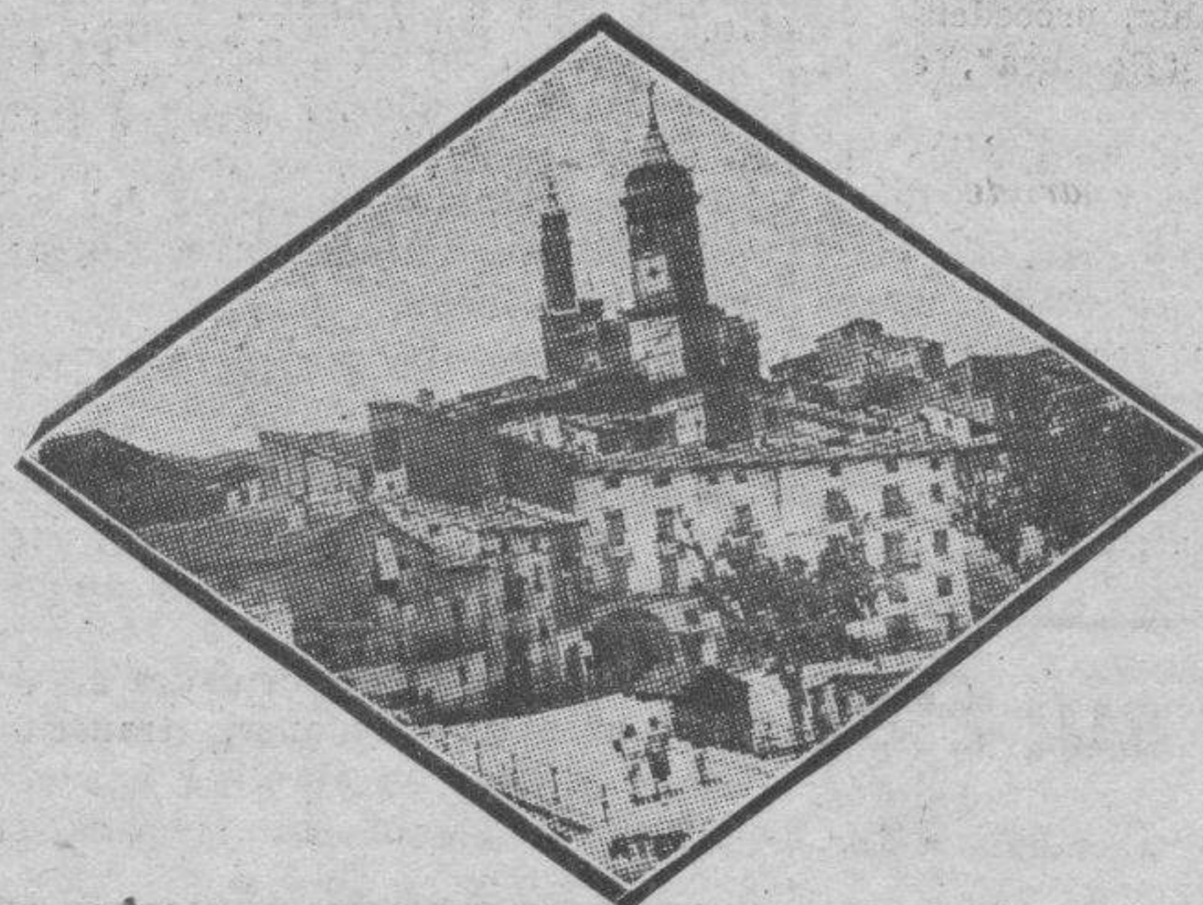
ATECA. — Las casas, blancas como palomas, rozan tímidamente el valle donde confluyen Jalón, Piedra y Mambles, mientras las torres de Santa María y del Reloj vigilan atentamente la ribera, prontas a dar el grito de alarma... — El Arco de la Yedra. Estampa teatral que plasma en el recuerdo de los atecanos todo un cortejo de poemas medievales. En último término, el forjido de la torre inclinada, joya árabe que parece abatir su testa bajo el peso de muchas centurias...

En cuanto a la agricultura, que es la fuente principal de riqueza, existen cuestiones de transcendencia, referentes a la producción, y para que se vea la pasividad de los agricultores sólo citaré, como ejemplo, un caso y no precisamente de los más importantes: