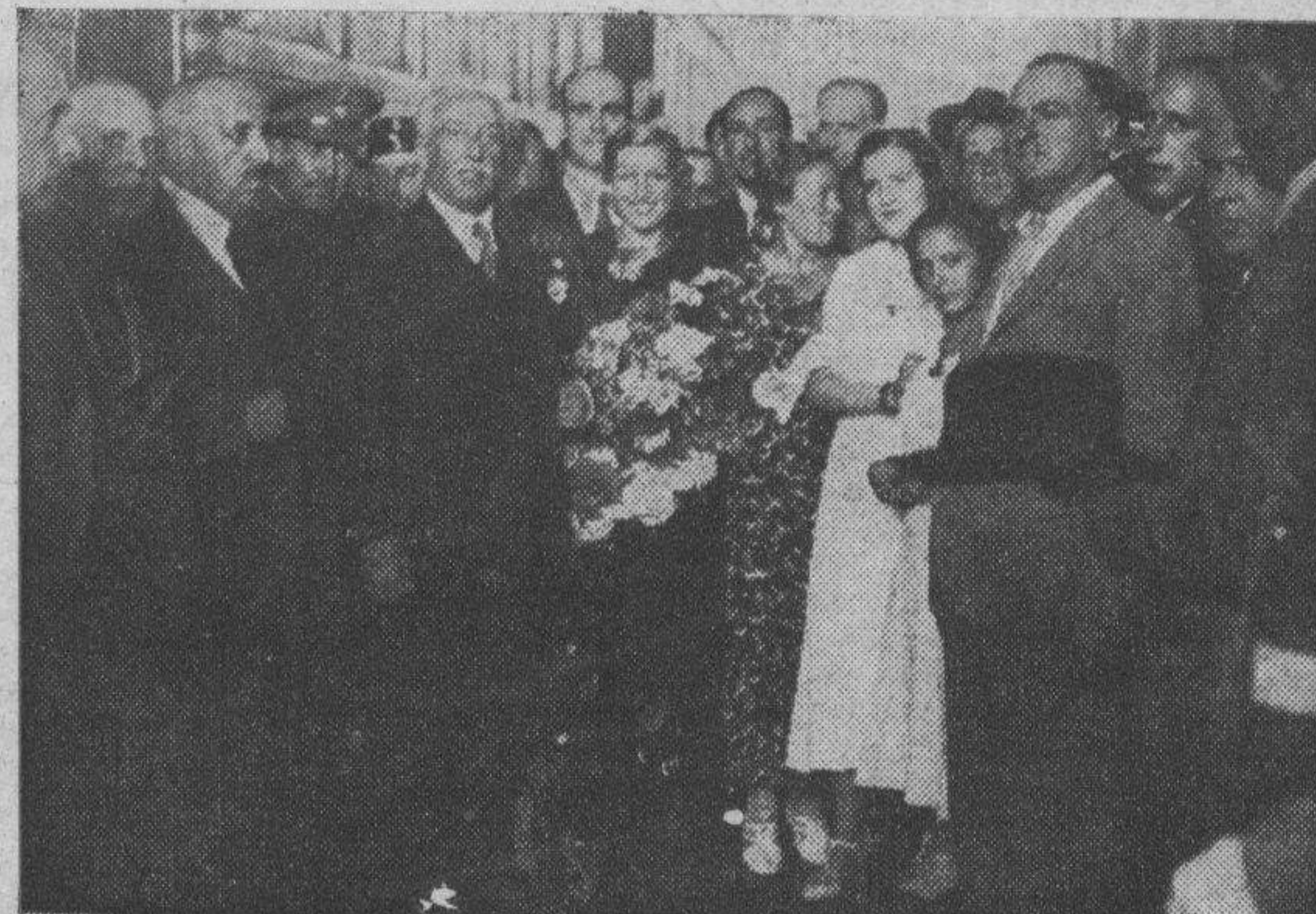
Un grupo de señoritas de la Juventud Radical cumplimentando a S. E. y a su esposa, durante la permanencia de los ilustres huéspedes en nuestra ciudad.