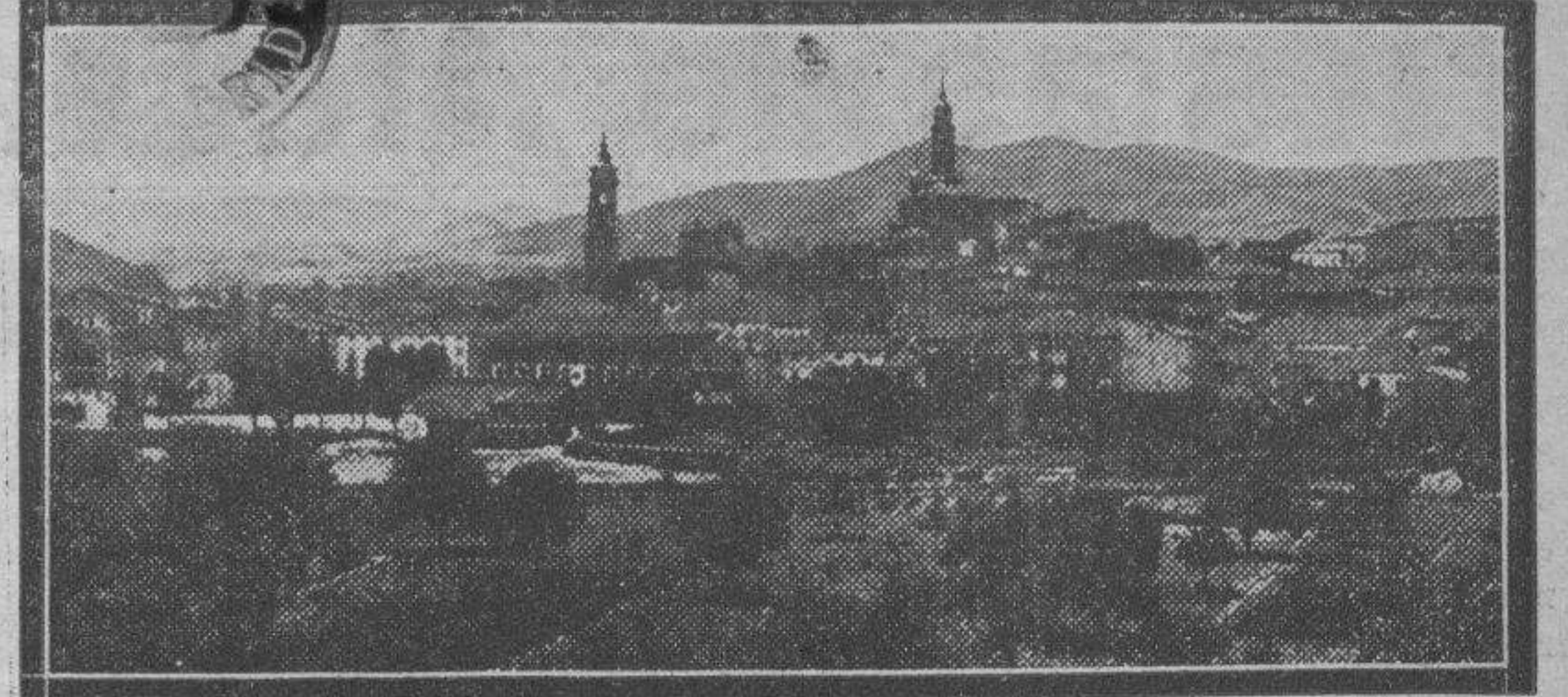
ATECA. — Vista general. Escalera de rejecho con tonalidades verdes y terrosas. En el crepúsculo, millaradas de luces que rompen, como estrellas en fuga, las tinteblas del valle.

aquí tus padres y personas queridas; aquí tus ríos; allá tus fuentes; esos tus campos; alrededor tus montes; este tu templo, casa de Dios; este tu altar en el que juraste amores; esa... tu Virgen que los acogió..."