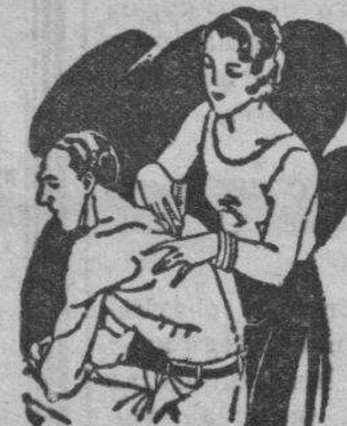
Artritis Dolores de muñeca y brazos Dolores de espalda y riñones

El LAPIZ TERMOSAN se vende en todas las Farmacias y Centros de Específicos a 4'45 pts. el tubo grande, y a 3 pts. el tubo pequeño (Timbres incluidos)