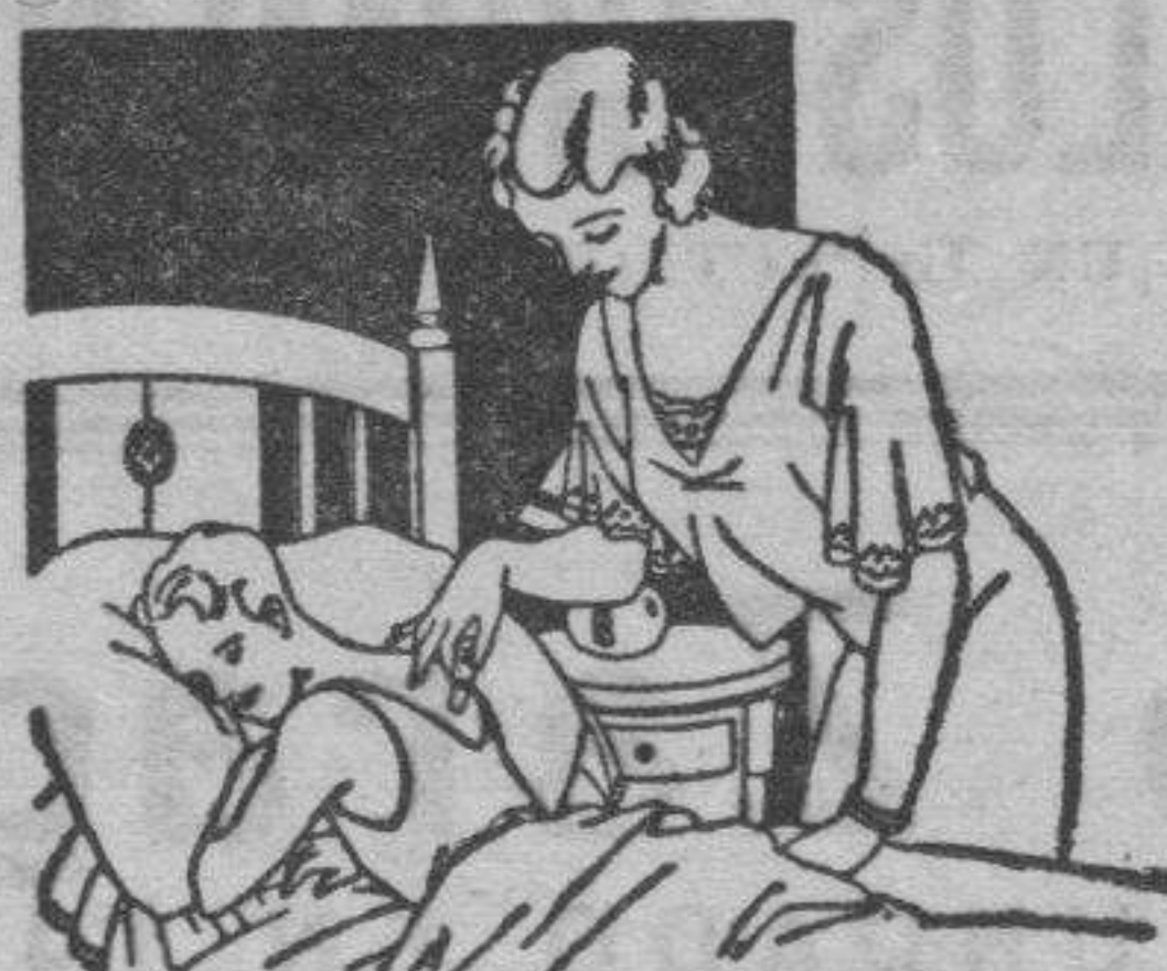
Resfriados - Asma - Pleuresias Congestión pulmonar