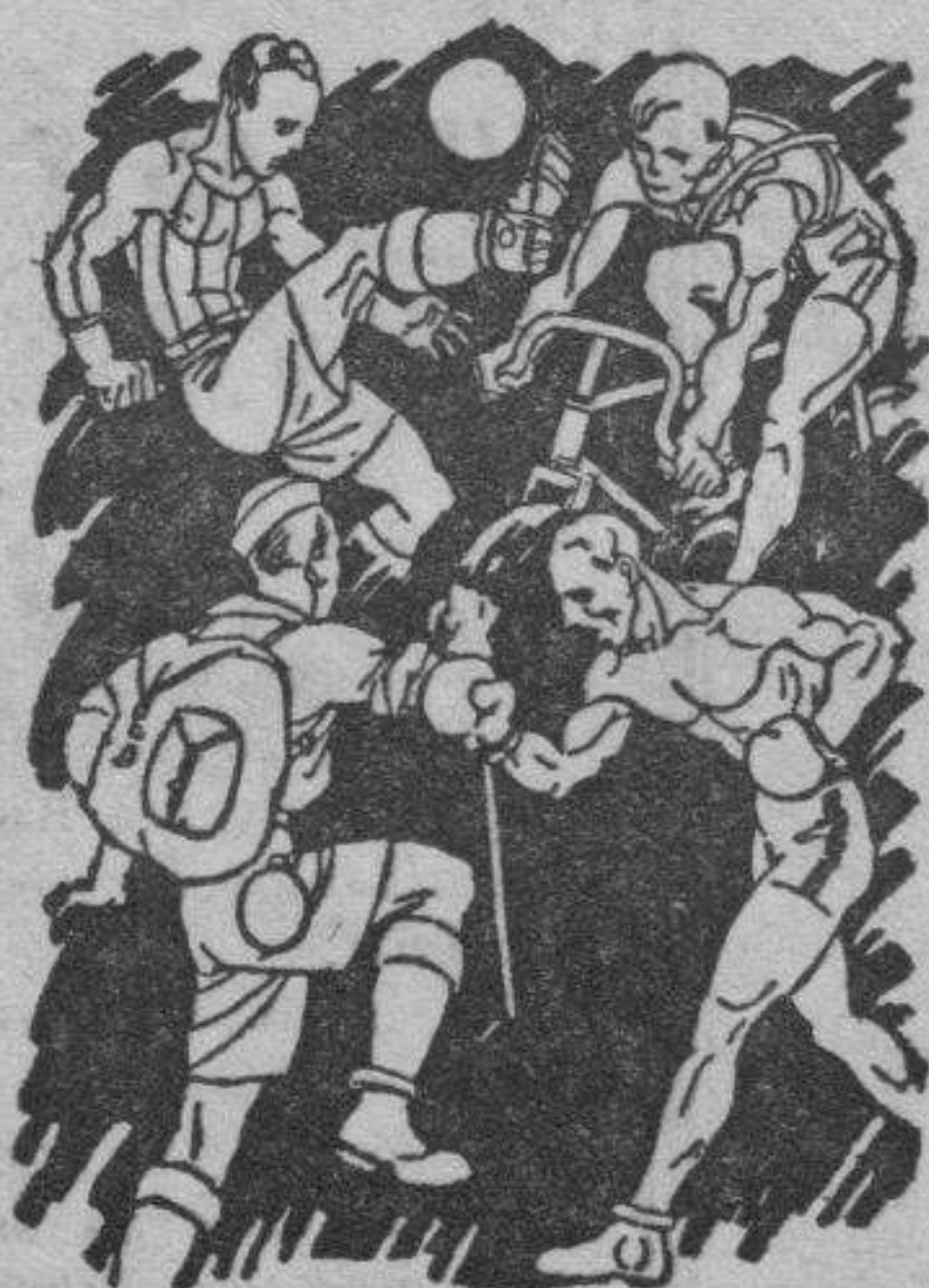
Indispensable para toda clase de sports. No ocupa sitio ni es frágil