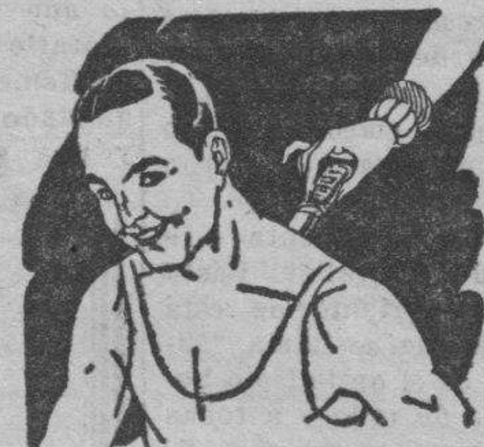
Rigidez del cuello Torticollis