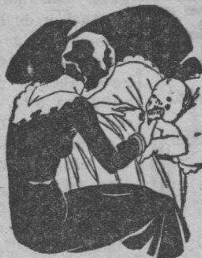
Tos - Catarros - Bronquitis Congestiones