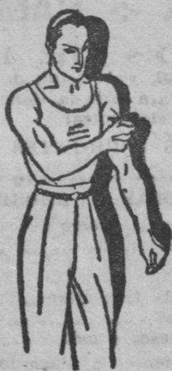
Fatiga muscular Golpes-Torceduras