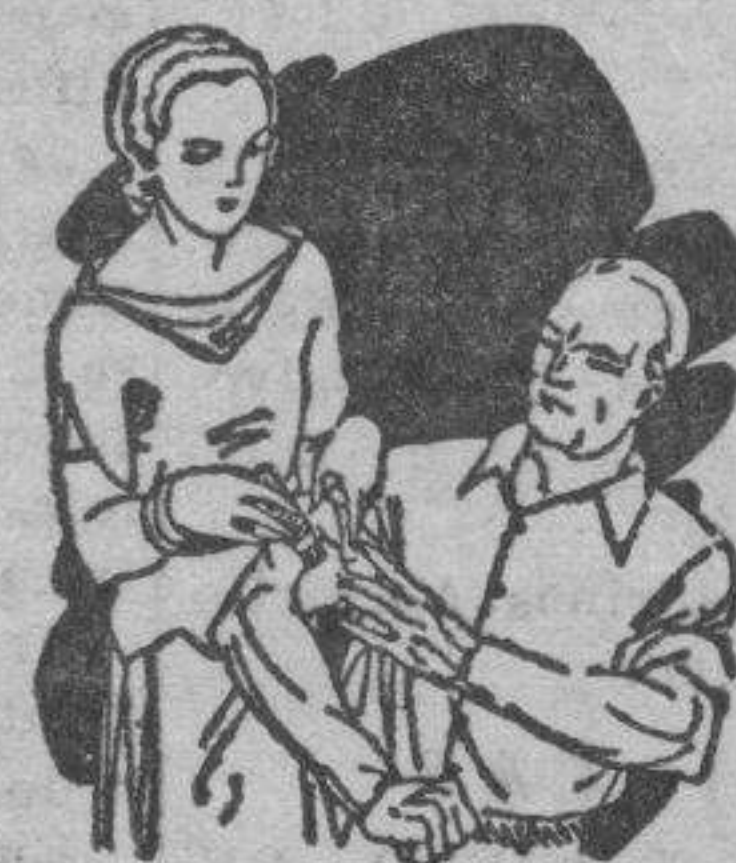
Dolor en las articulaciones Calambres

No ocupa sitio Descongestiona sin irritar No ensucia No tiene mal olor