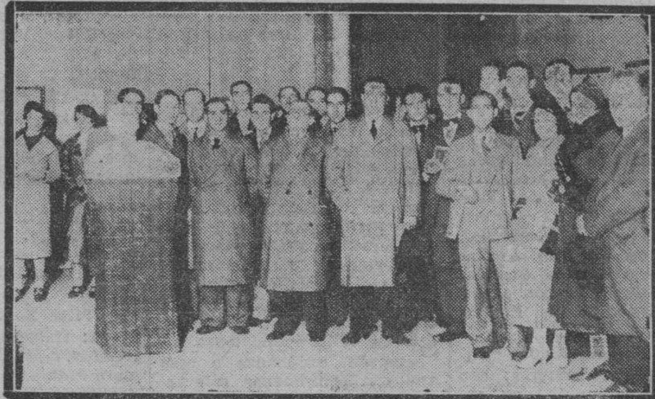
Las autoridades locales, artistas y público, en el acto inaugural de la Exposición Goya, instalada en el salón de Quintas de la Diputación provincial.