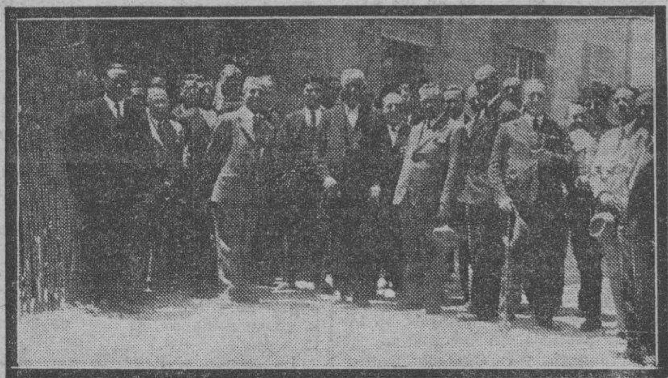
ALCANIZ. — Comisión delegada de la Dirección General de Ferrocarriles y Tranvías, autoridades de Alcañiz y encargado de la línea de Puebla de Híjar a esta ciudad, en el acto de inauguración de las oficinas generales y elección del solar para la proyectada escuela en el barrio de San José.

VINOS SANZ Son los mejores Pruebelos usted San Clemente, núm. 3. -Teléf. 34-87 Servicio a domicilio.