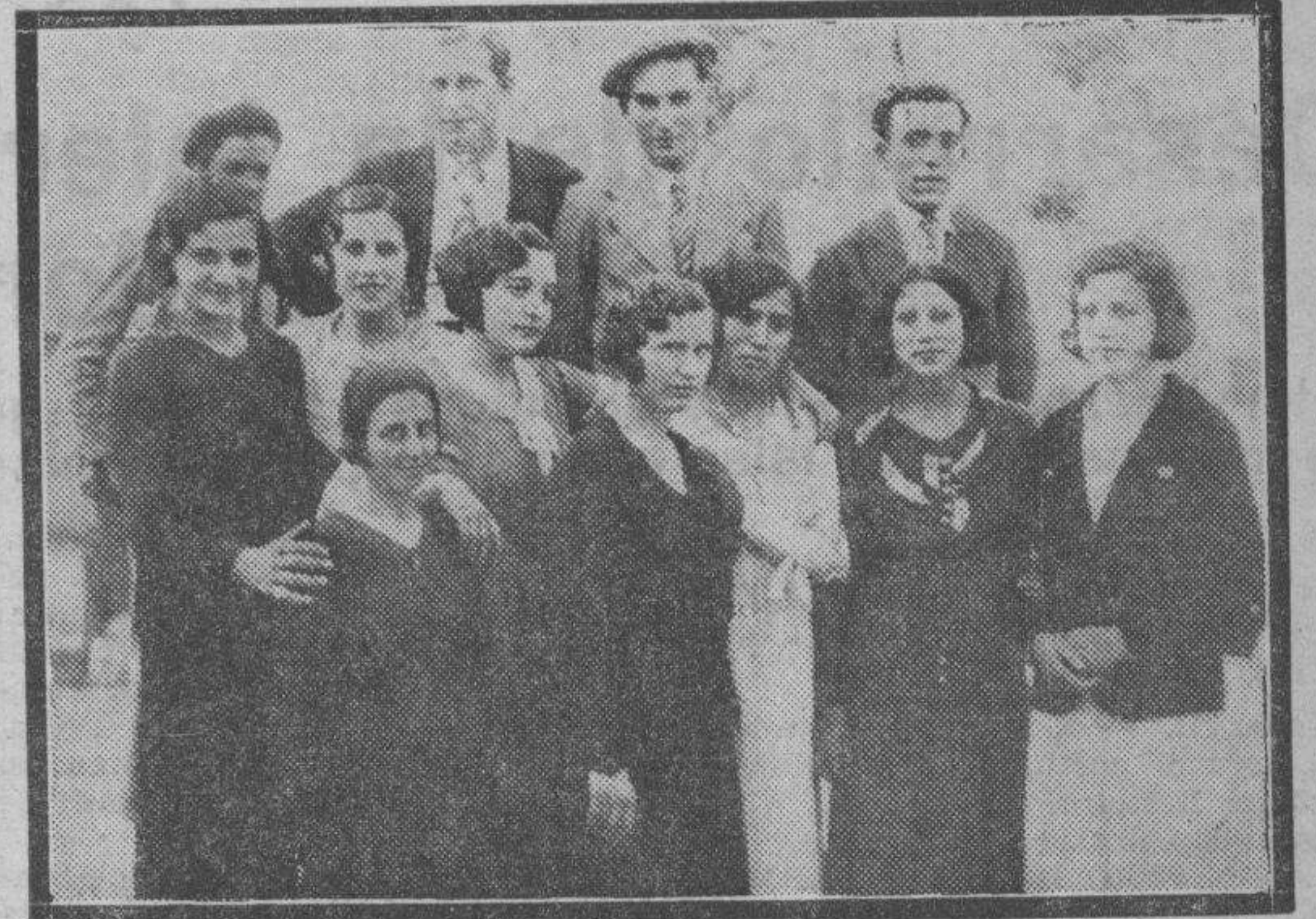
PINSEQUE. — Este simpático pueblo está celebrando con gran brillantez las tradicionales fiestas de San Pedro. En la foto, un grupo de bellas chiquillas y bienhumorados jóvenes, que han dado gran realce a los festejos.