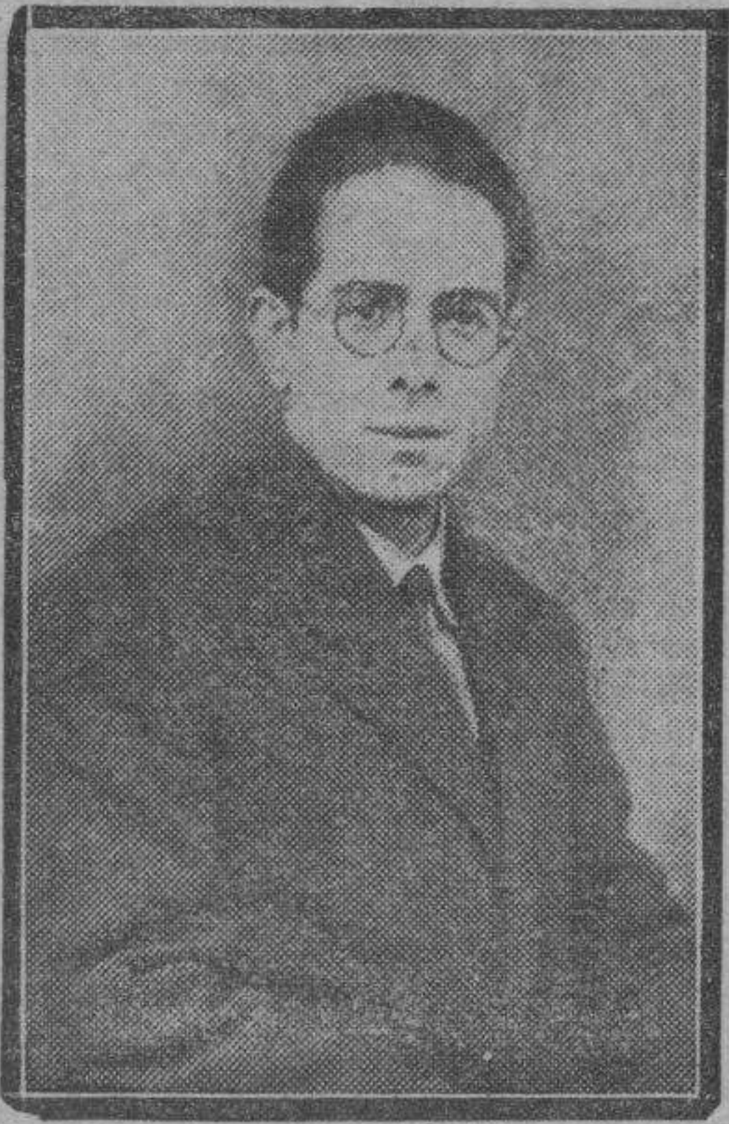
chotis "Barquillo 13", original del laborioso autor que nos ocupa.

En la calle, al pasar por un bar, percibí el sonido de un aparato musical mecánico que tocaba el castizo