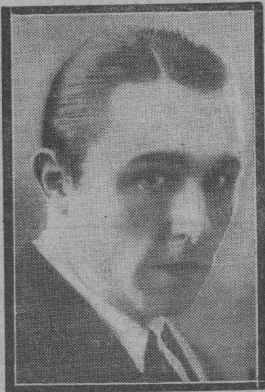
El popular actor de cine Rufino Inglés, que después de rodar varias películas españolas en Paramount se halla interpretando el role principal de un nocturno de Choptin, "Bajo el cielo de Palma de Mallorca".

Se trata de una película extraordinariamente interesante por su ambiente — reconstitución del siglo XVII japonés, en plena época feudal de Shogunes y Dairós — y por su asunto. Este, ingenio en el planteamiento y desarrollo, está conducido con dinamismo formidable, de esencias puras de cinematografía. Por sí solo tiene positivo interés, que se acrece por la auténtica procedencia exótica de su realización. En técnica, a juzgar por "Yedo", los japoneses no han creado maneras nacionales, y las influencias recibidas parecen proceder de Europa mejor que de América. Las últimas escenas de la película, de cierto corte heroico, son bellísimas.