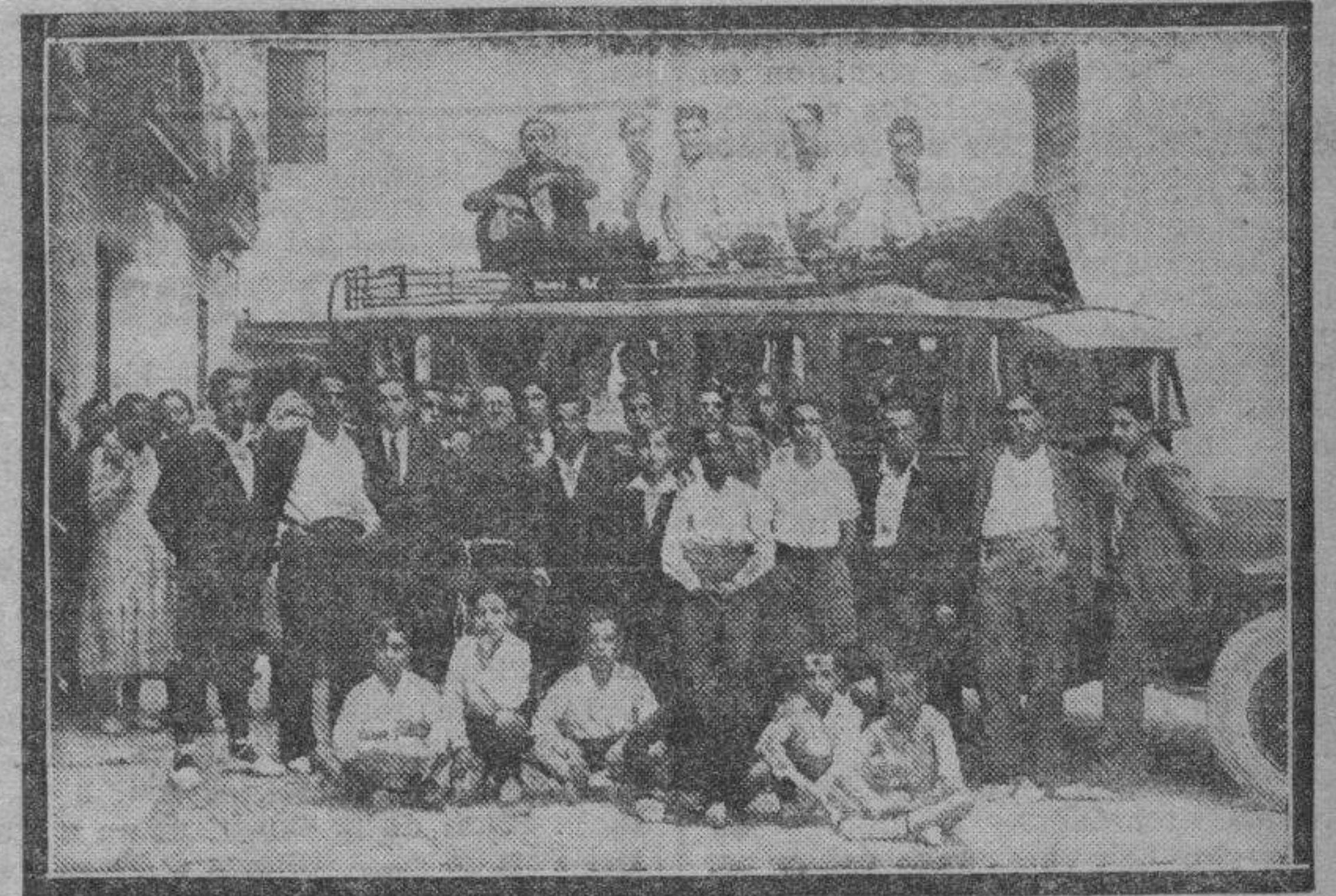
CASPE. — El Orfeón "Los Amigos del Arte", preparados para su primera excursión al Monasterio de Rueda.

Es de suponer que dada la competencia del Juzgado actuante, todo quedará en claro en seguida. El agresor ha quedado a su disposición. — JOSÉ LUIS SANZ.