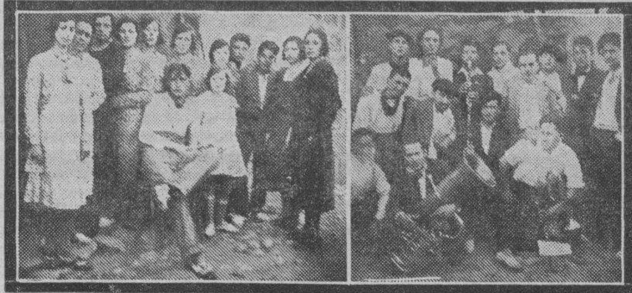
NAVARDUN. — Grupo de guapas y simpáticas mozas que con su belleza dieron extraordinario realce a las fiestas. Mozas acompañadas de la banda de música que ha amenizado las pasadas fiestas.