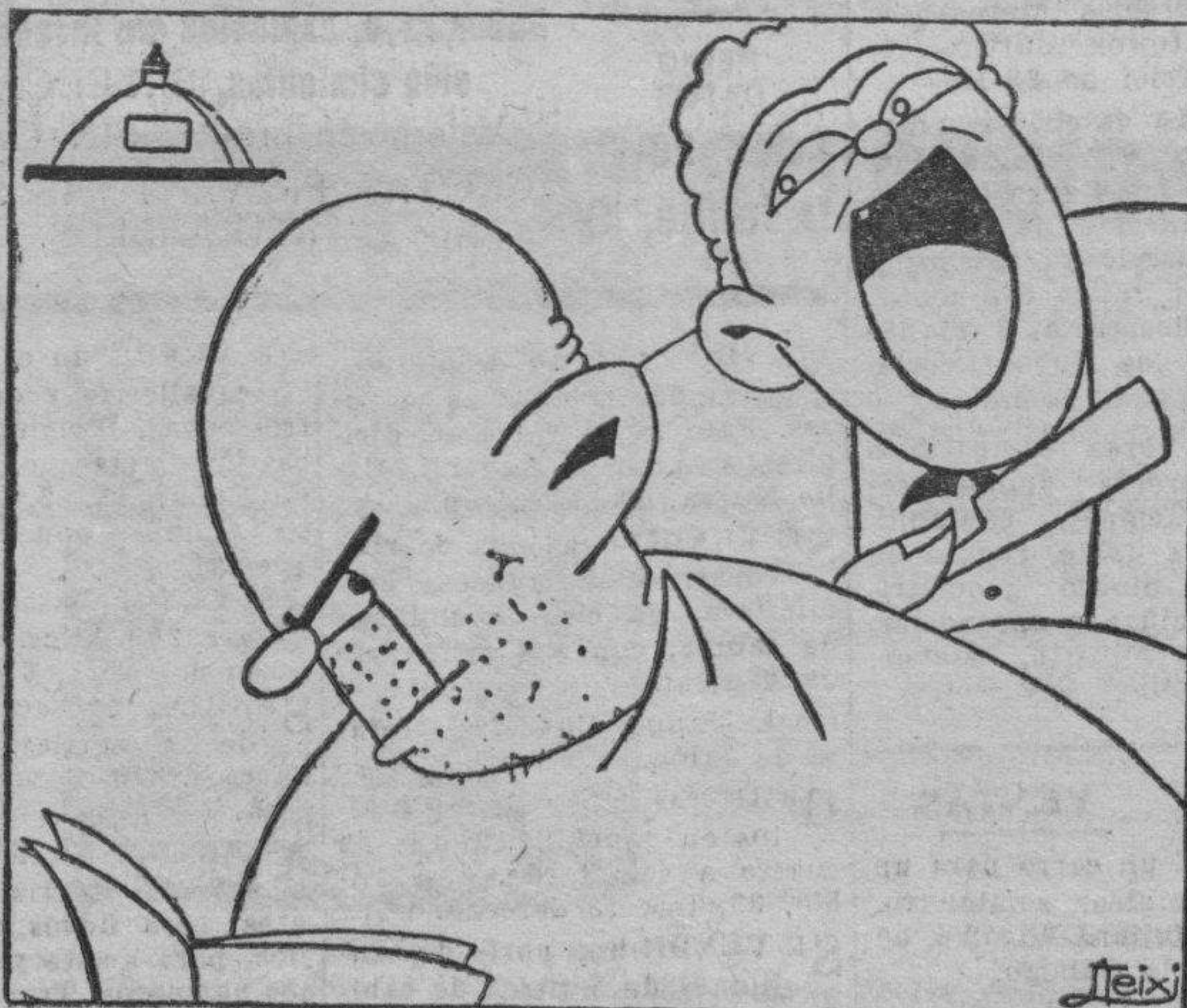
—¡Anda y que te ondulen con la permanen...!