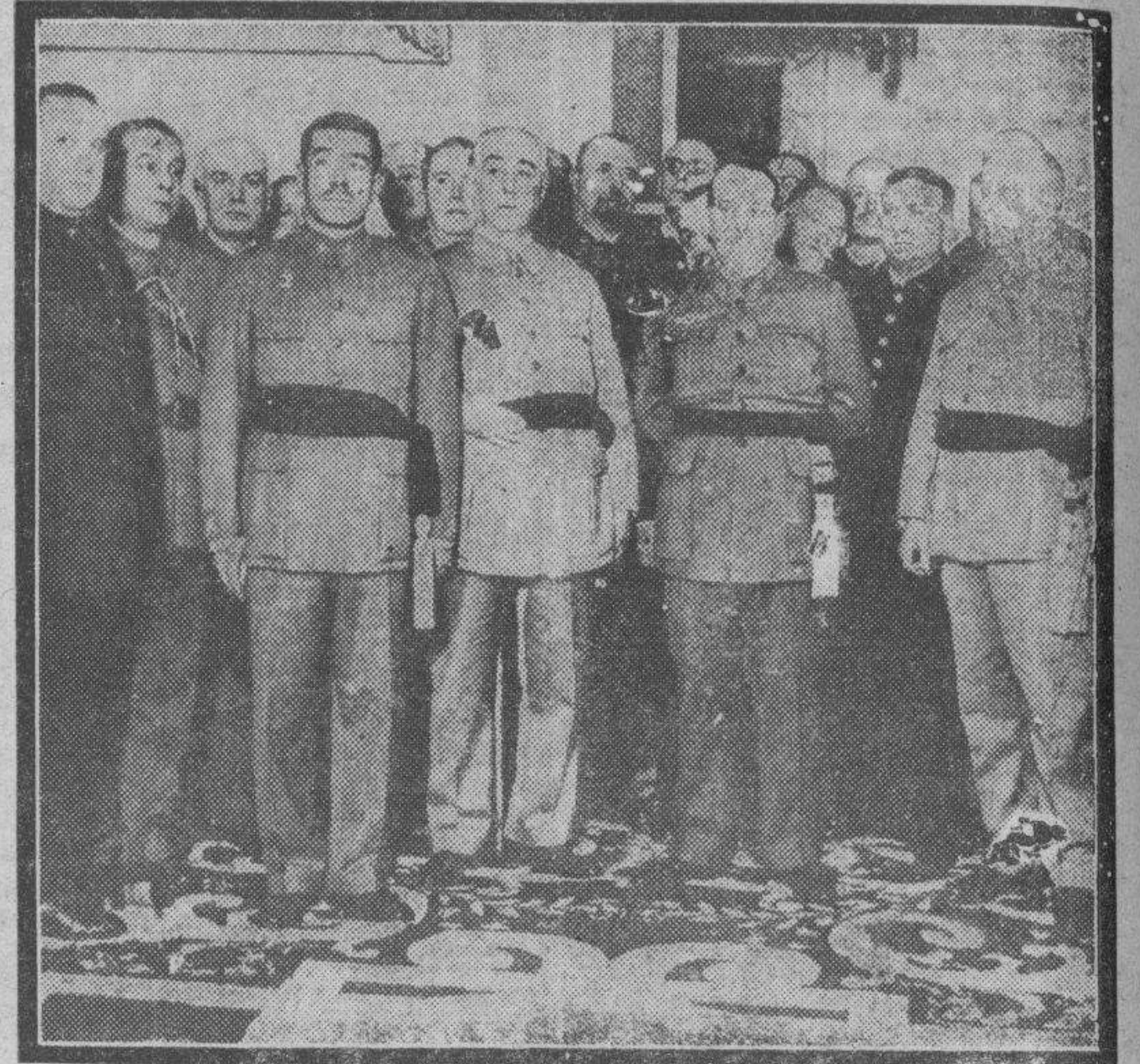
El general Sanjurjo en el acto de toma de posesión de la Dirección General de Carabineros, en el Ministerio de la Guerra.