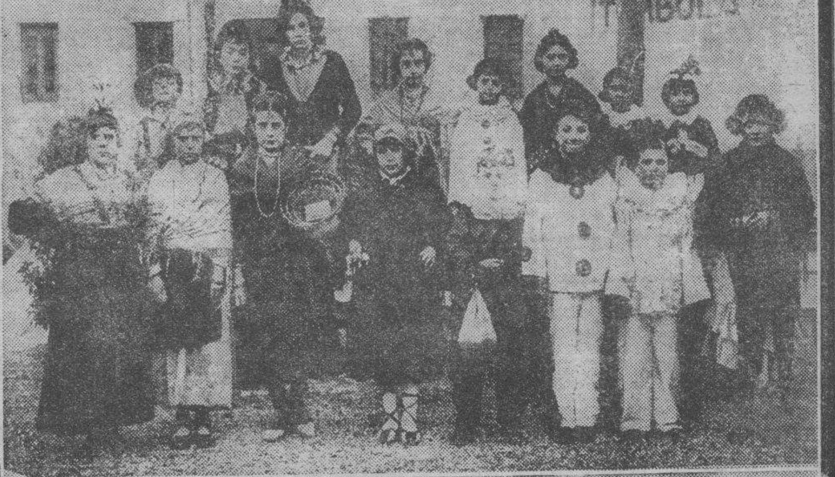
Un grupo de niños disfrazados que asistieron a la fiesta infantil celebrada por la Asociación de la Prensa de Zaragoza en el Iris Park.