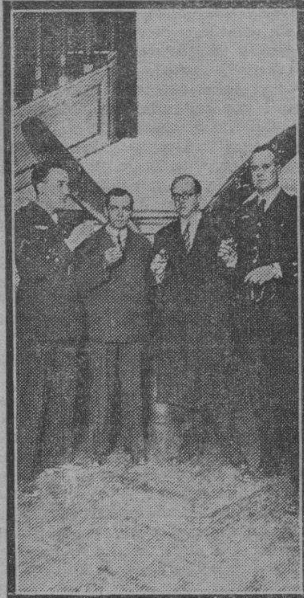
MADRID. — Mr. Hinkler, el famoso aviador que realiza solo la travesía del Atlántico Sur, a su llegada al aeródromo de Getafe, de regreso ya a la rubia Albión.