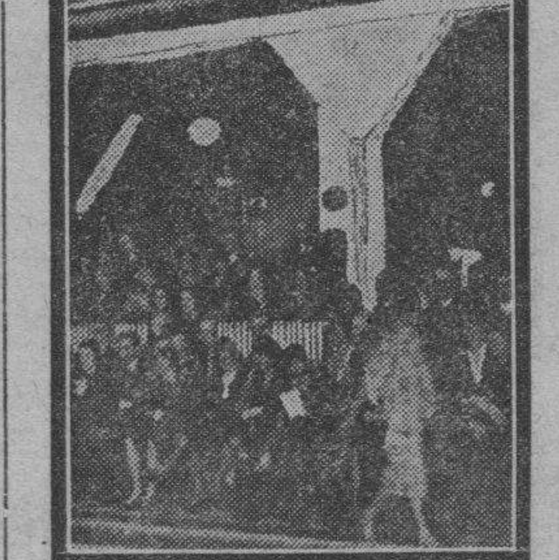
Un "policeman" berlinés disponiéndose a dar un salto sobre el espejeo.

El "poli" que aparece en la fotografía va equipado totalmente, y está a punto de echarse al agua sin que sus músculos se alteren lo más mínimo.