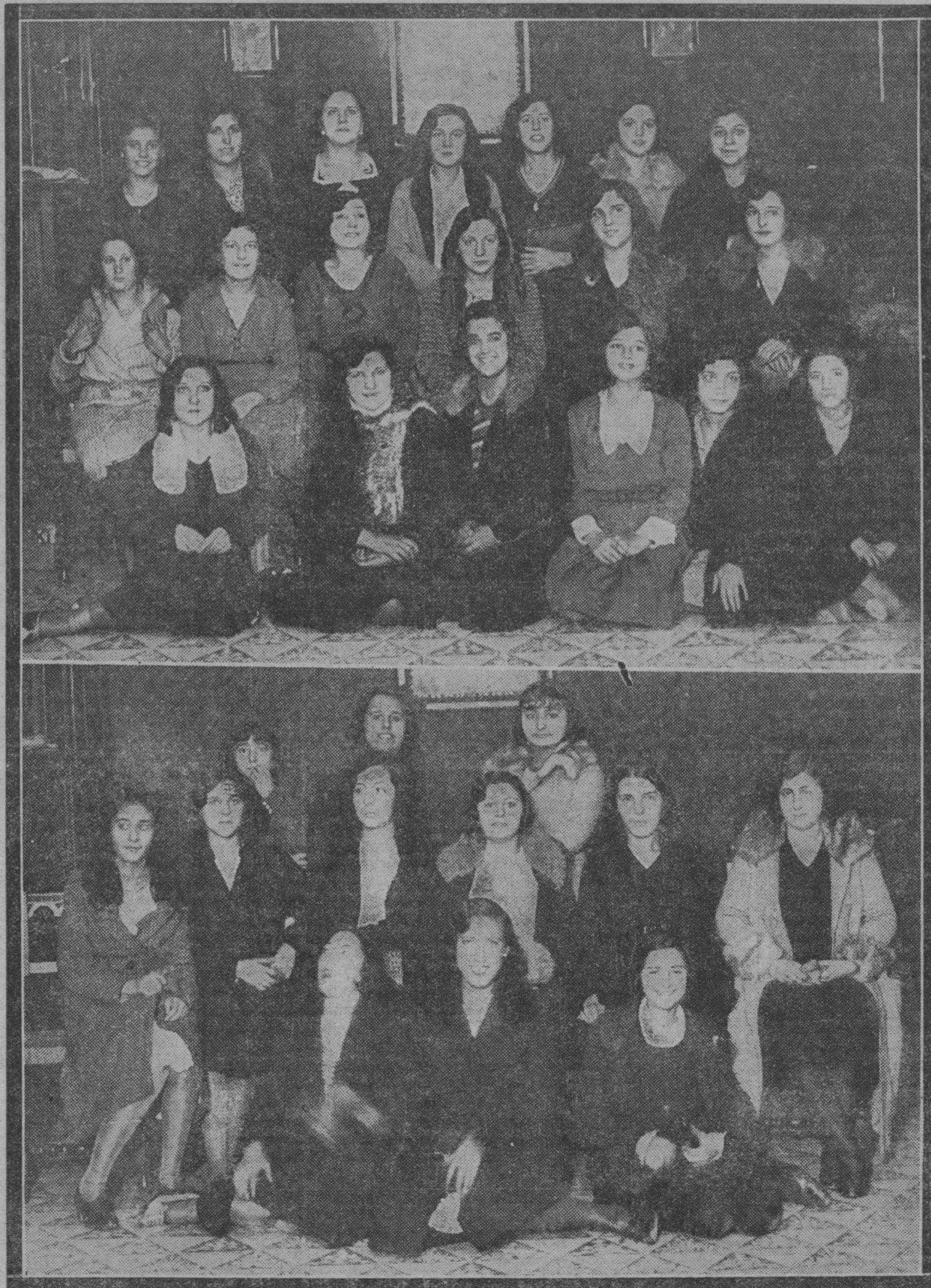
Ante la proximidad del día de las modistas, irrumpen a diario en LA VOZ DE ARAGON sendos grupos de muchachas, que prenden en nuestra Casa deliciosos aires de alegría y de juventud. En estas fotografías recogemos dos de estos grupos modisteriles, obtenidos durante su visita a nuestra Redacción.