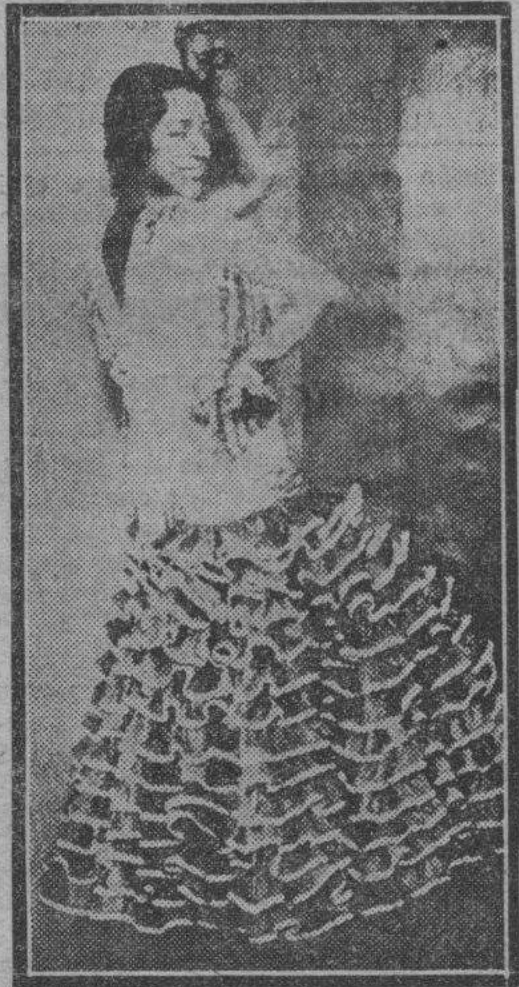
Antonia Mercé, "La Argentina", la aplaudida bailarina española, que ha llevado al extranjero el prestigio de nuestras danzas, es condecorada por el Gobierno con el lazo de Isabel la Católica.