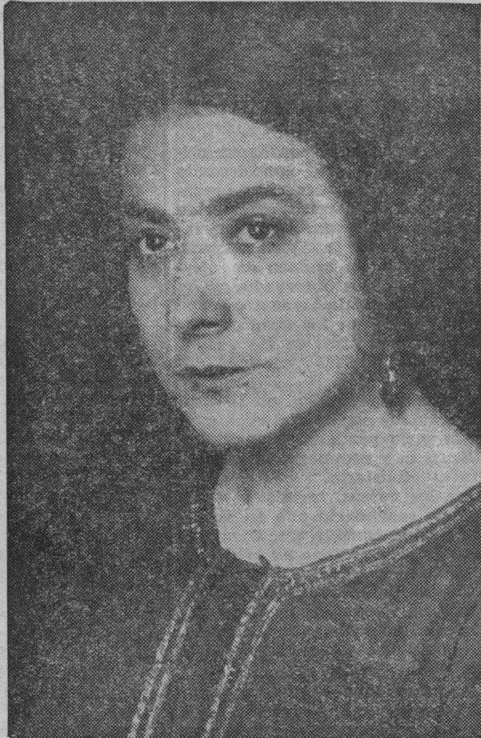
La sevillanísima bailarina Lolita Astolfi, que después de un paréntesis de tres años, ha reaparecido en los escenarios con éxito resonante. El público zaragozano tendrá nueva ocasión de admirarla en fecha próxima.