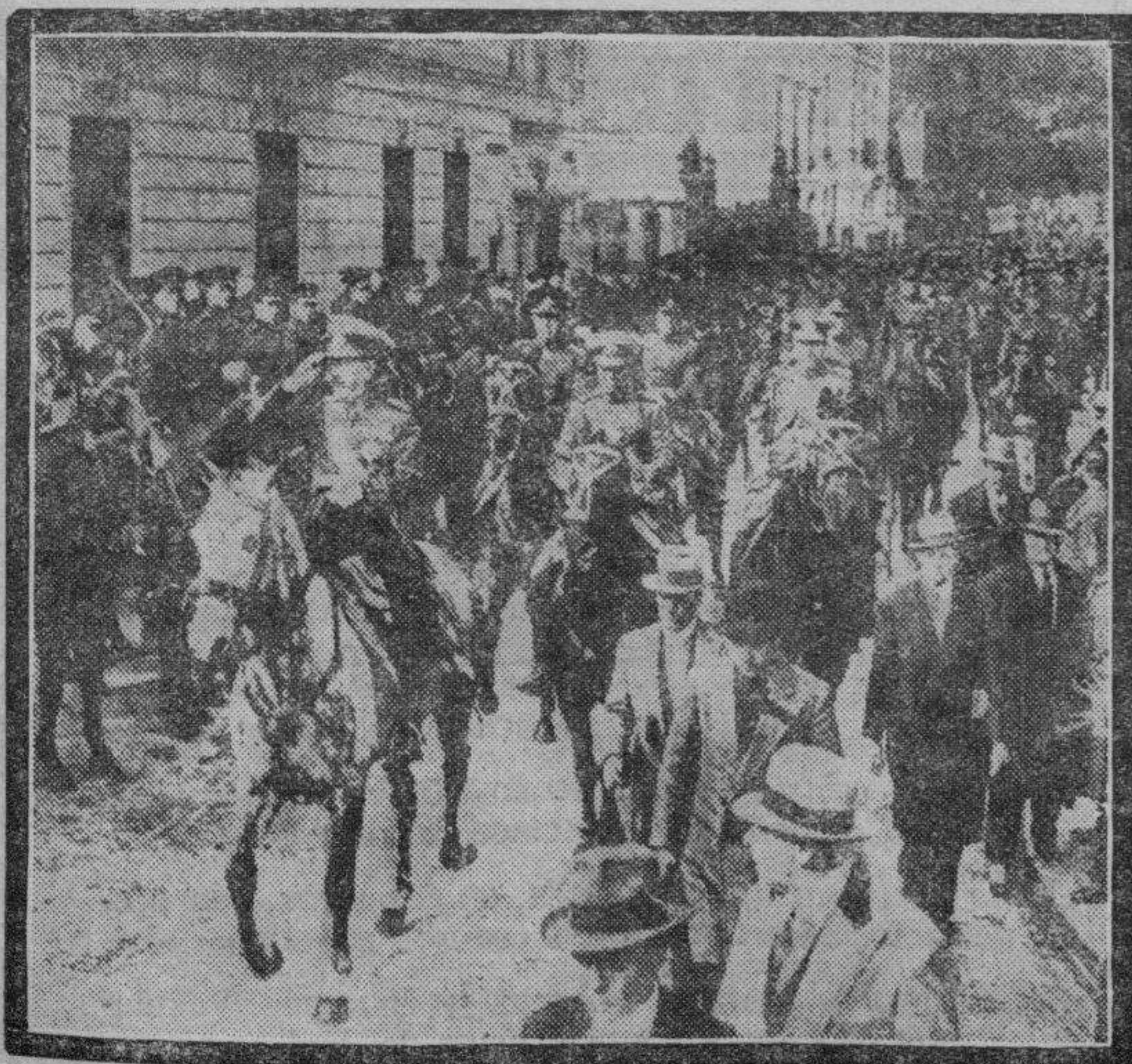
Para conmemorar el 50 aniversario de la independencia de la Argentina se celebró, entre otros actos, una fiesta militar, durante la cual el dictador Uriburu pasó revista a las tropas.