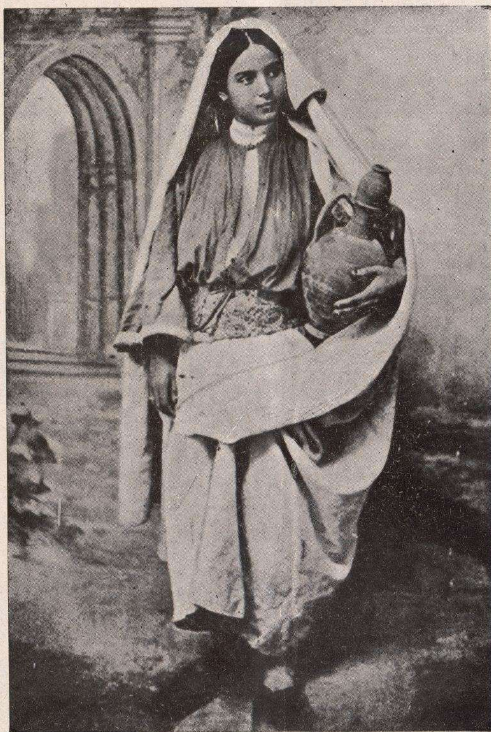
Tipos marroquíes.-Mujer aguadora