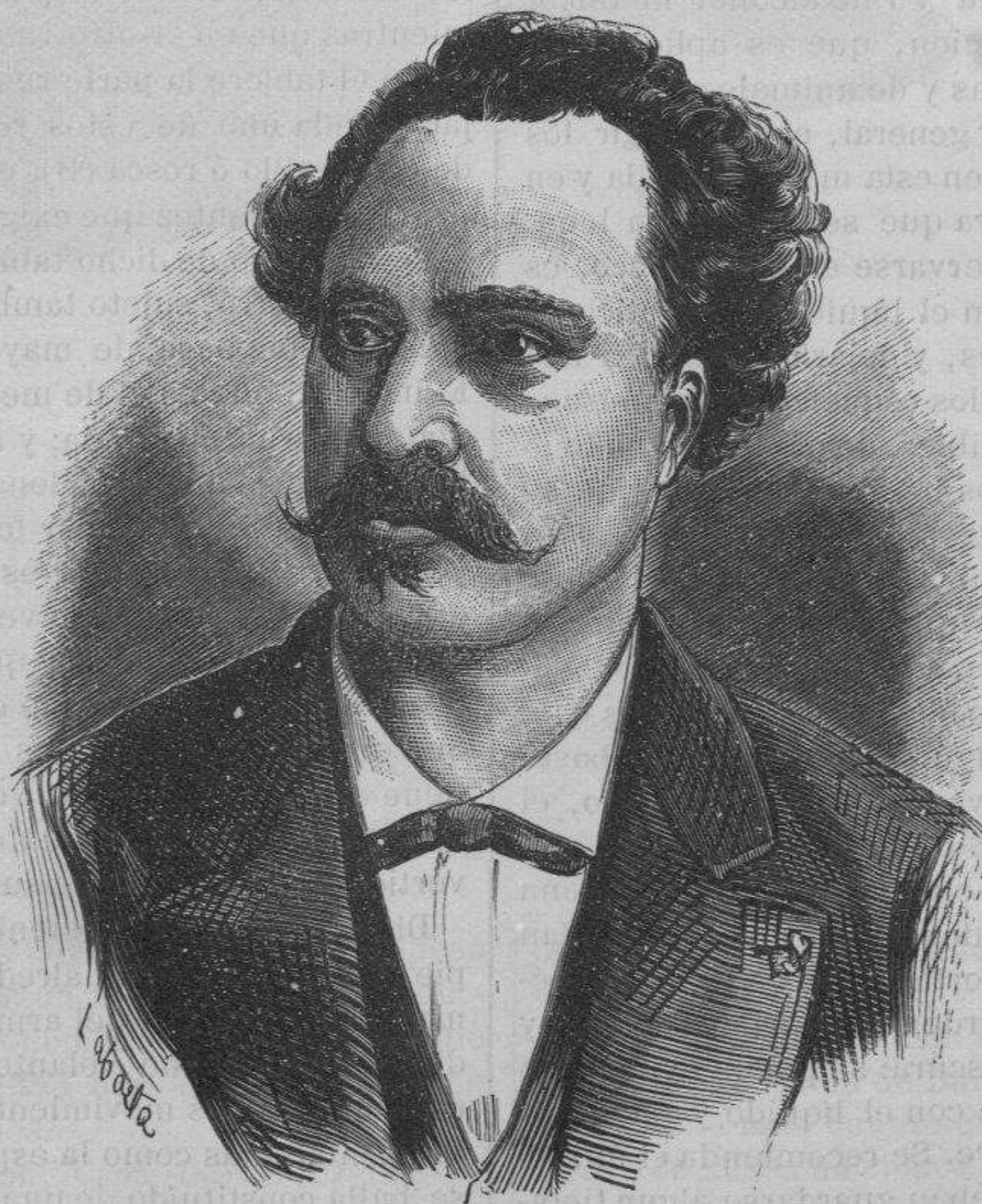
Mr. BIDEL, célebre domador de fieras

Más si el peligro realmente existe, los sagrados intereses de la salud pública exigen que se adopten sin vacilacion las más enérgicas medidas para conjurarlo; si bien dando conocimiento al público de las causas que vengan en su apoyo, para que pueda debidamente apreciarlas, pues los reconocimientos y disposiciones que sobre tan importante asunto hasta ahora se han adoptado, sin conducir á su esclarecimiento bajo un criterio fijo é indiscutible, ha de resentirse de las tales cortapisas el negocio de gallinas, en perjuicio del público consumidor que, en último resultado, es el que en semejantes casos viene á pagar, como suele decirse, los vidrios rotos.